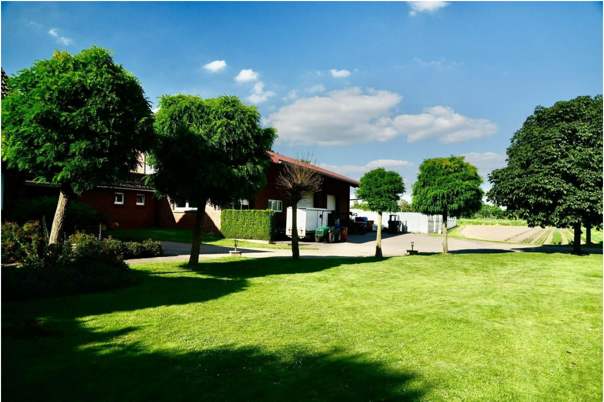
Vorgarten mit Betriebsgelände