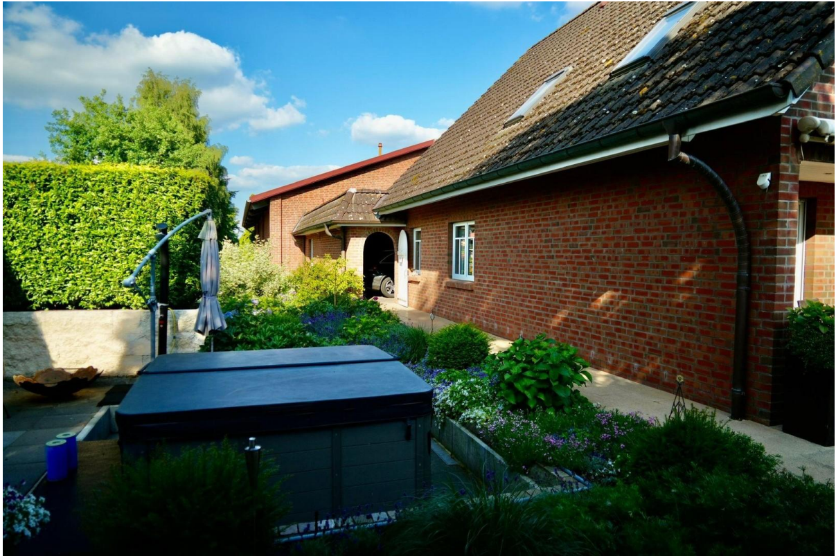
Pool zum Entspannen