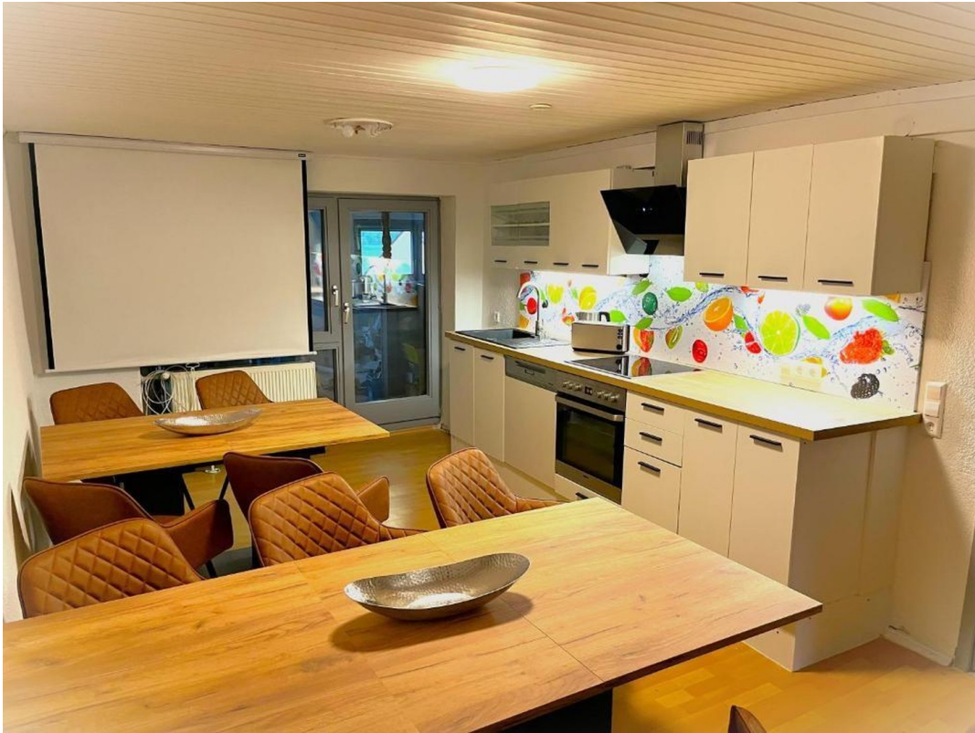
neue Küche mit el. Geräten