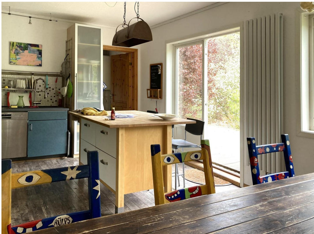
Wohnküche - Küche, Terrasse