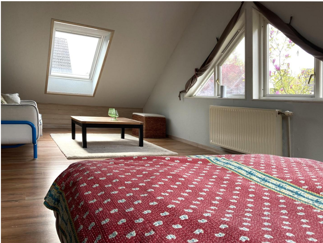
Obergeschoss - Zimmer 1