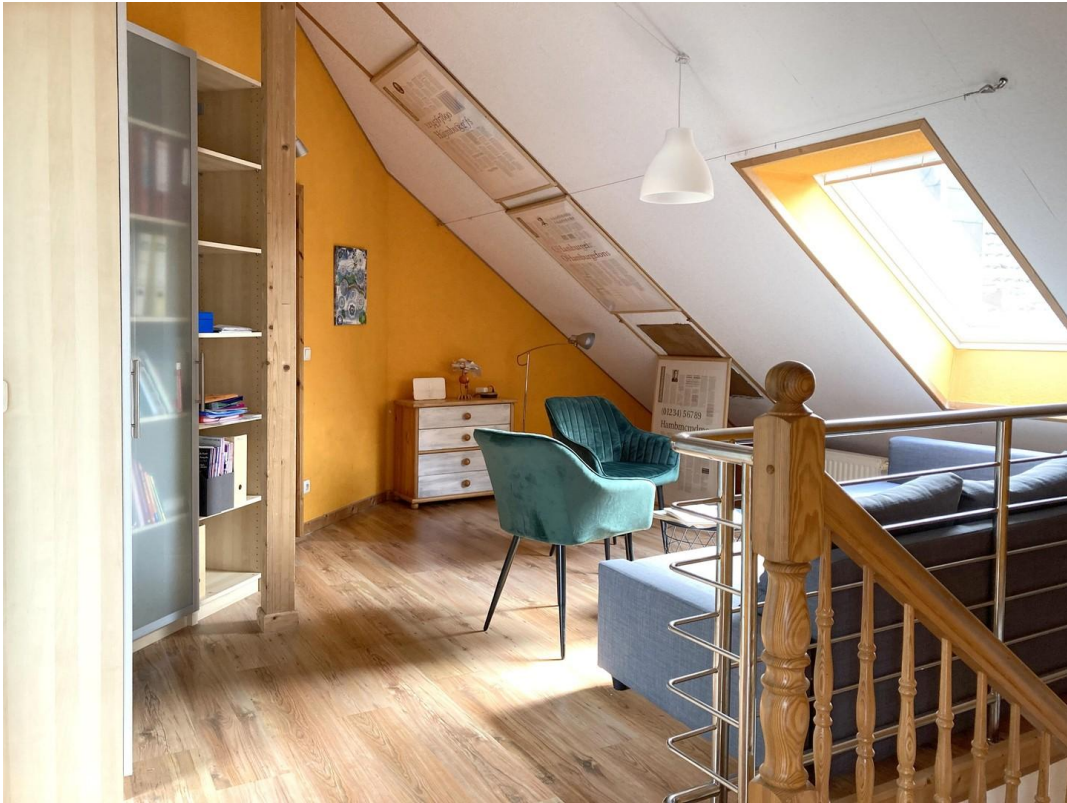
Obergeschoss - offener Bereich