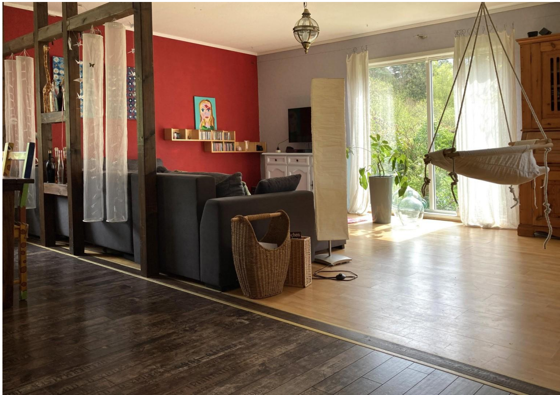
Wohnküche - Wohnbereich