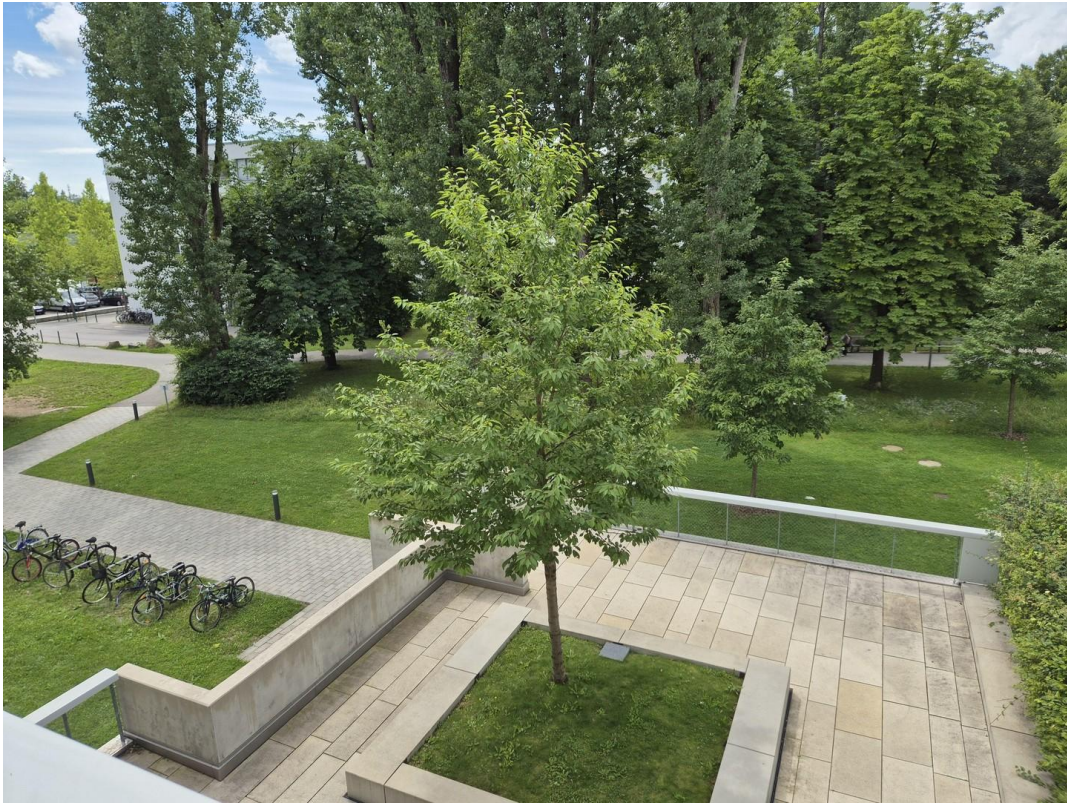
Aussicht von der Loggia