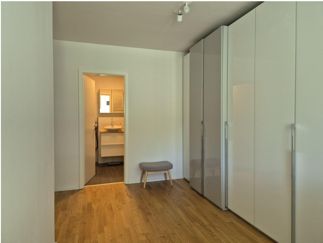
Schlafzimmer Zugang zum Bad