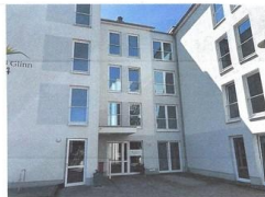
Hausansicht / Hauseingang