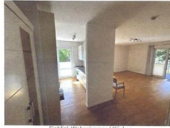
Einblick Wohnzimmer / Küche