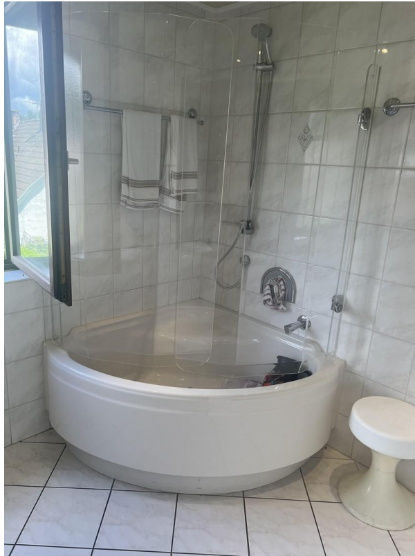
Dusche 1. Etage