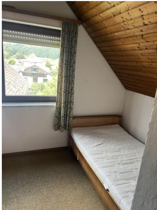
Dachgeschoss Zimmer 2. EG