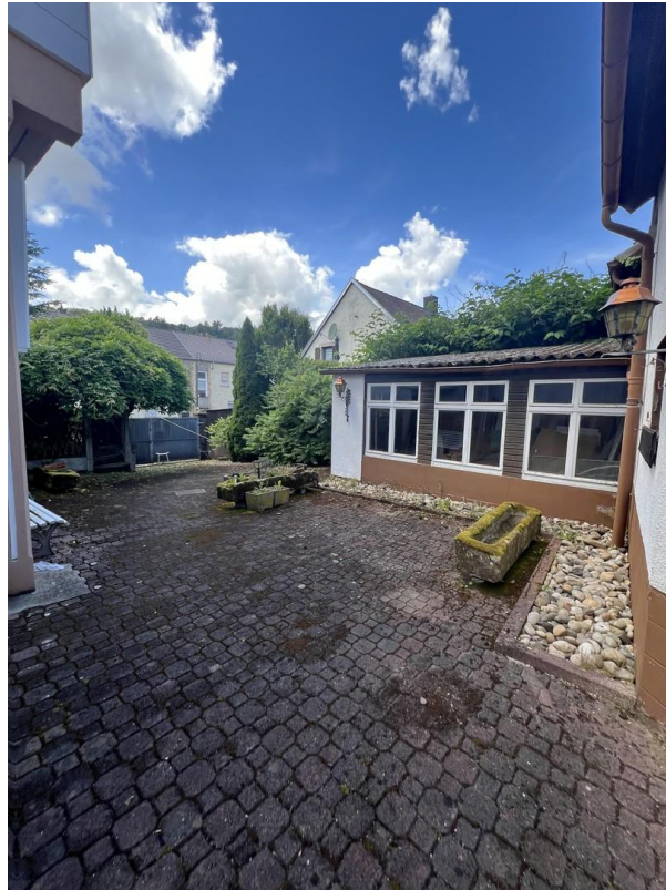
Garage u. Innenhof