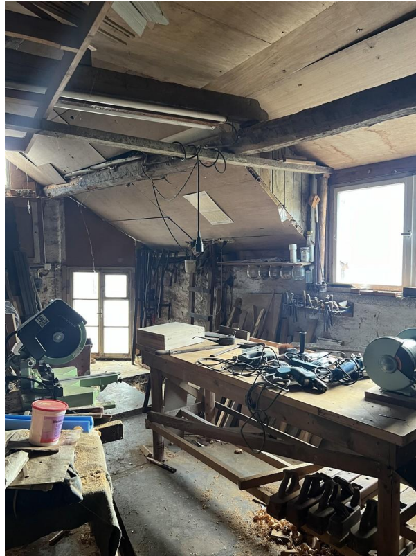
Werkstatt 1. EG