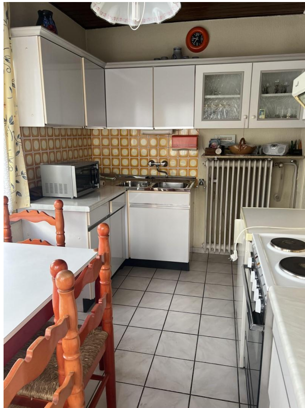
Küche 1. Etage