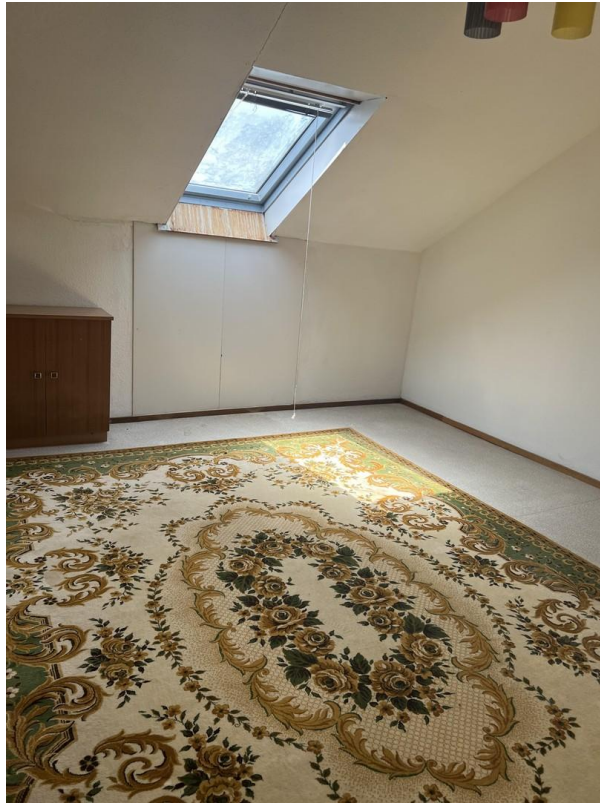
Dachgeschoss Zimmer 2. EG