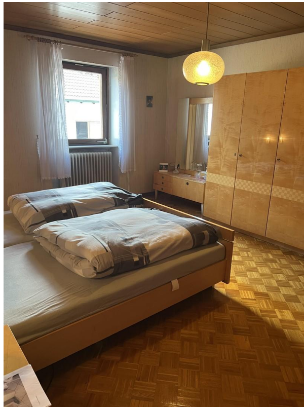
Schlafzimmer 1. Etage