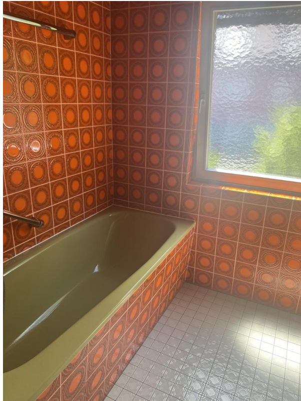
gr. Badzimmer/ Wanne EG