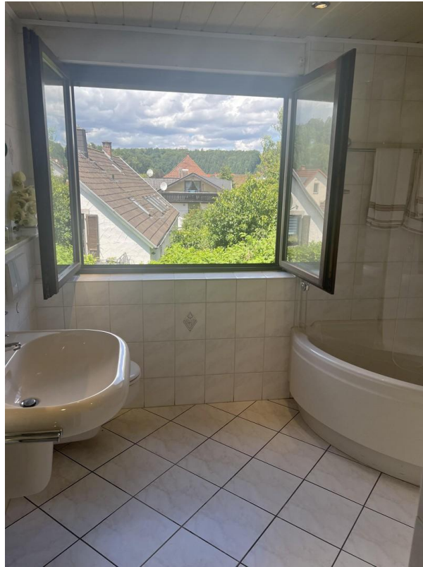
Badzimmer 1. Etage