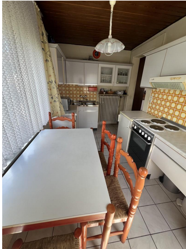
Küche 1. Etage