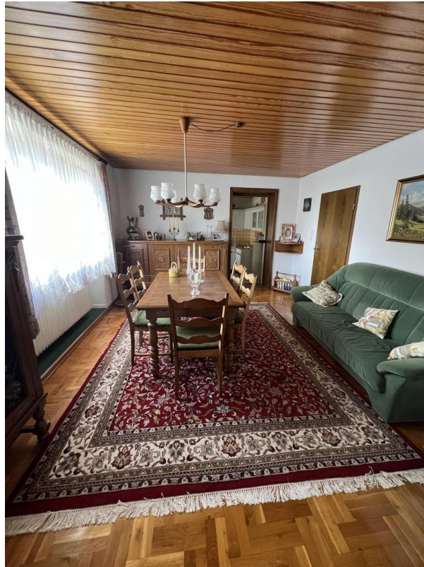
Esszimmer 1. Etage