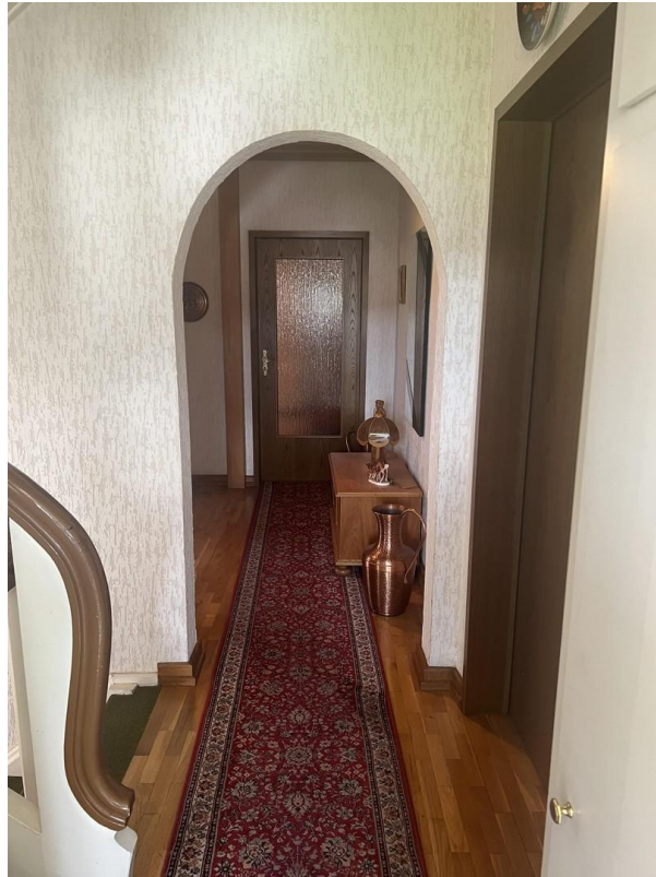
Flur 1. Etage