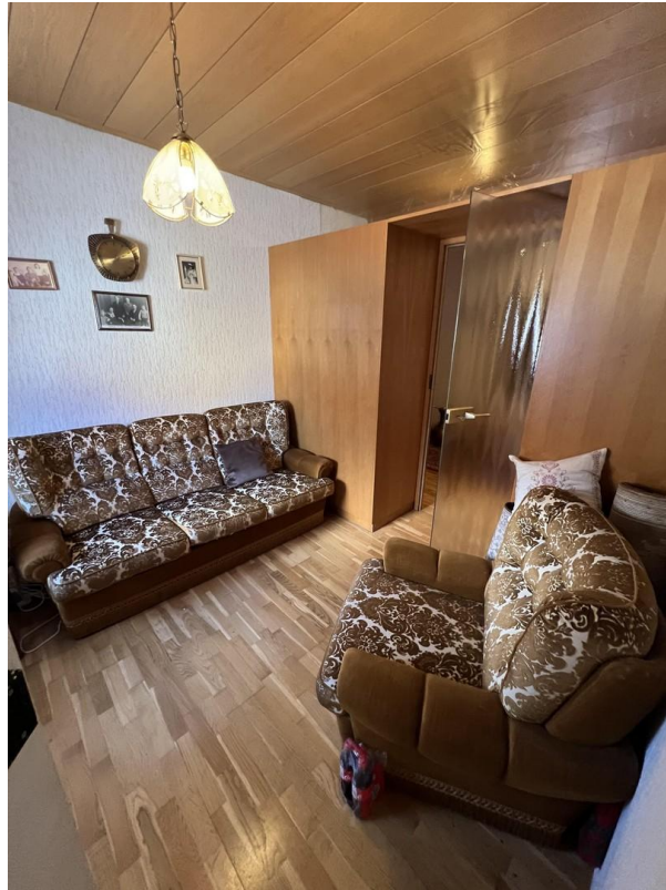
Zimmer 1. Etage