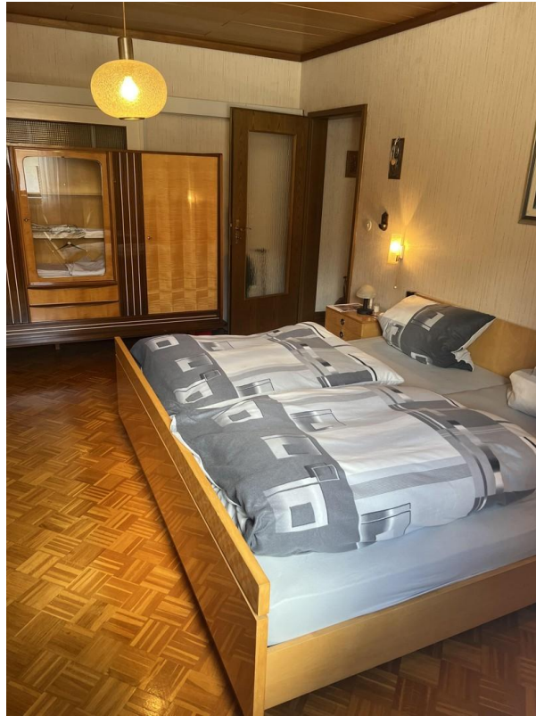
Schlafzimmer 1. Etage