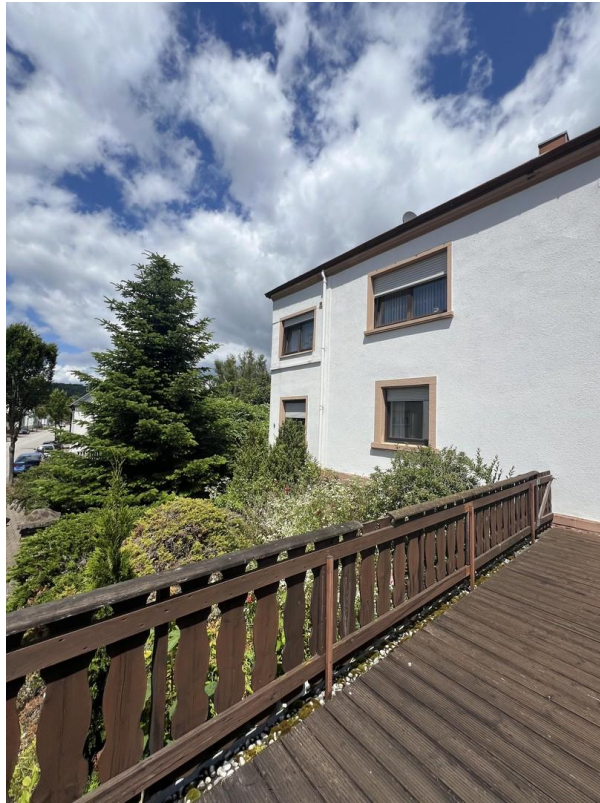
Terrasse vom WZ EG