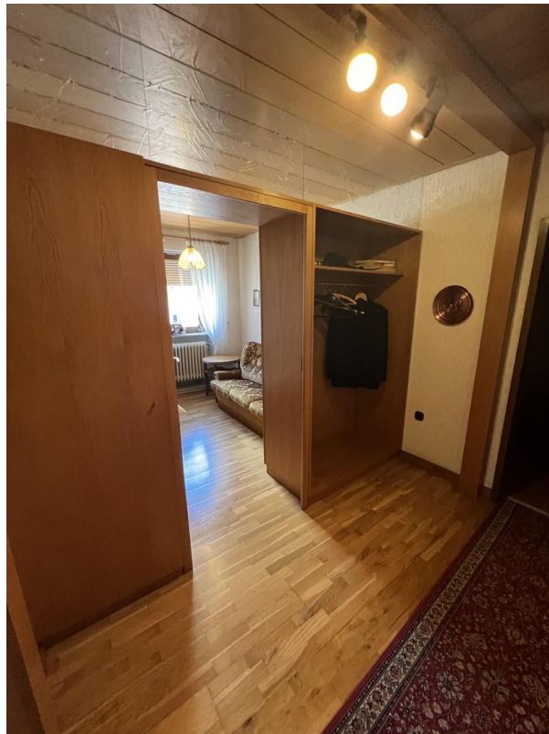
Ankleide 1. Etage