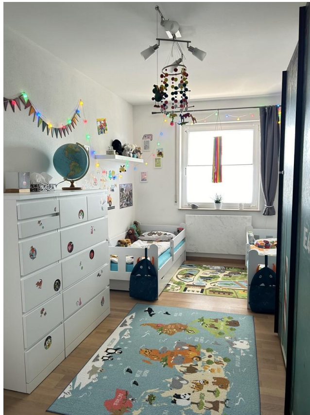
Kinderzimmer (Kind II)