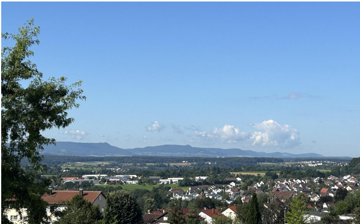
Blick auf den Ort + Albtrauf