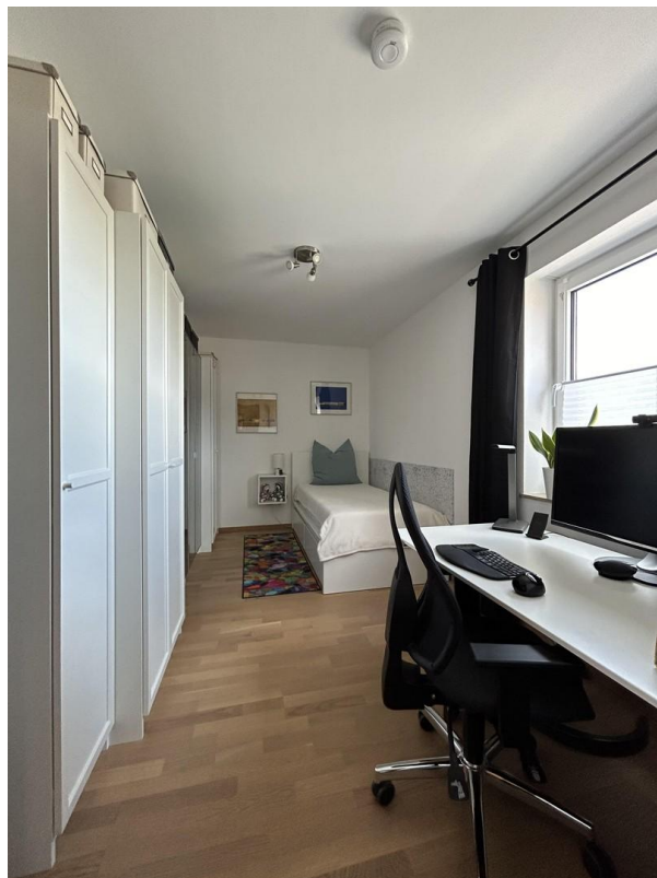
Gäste-/Arbeitszimmer (Kind I)