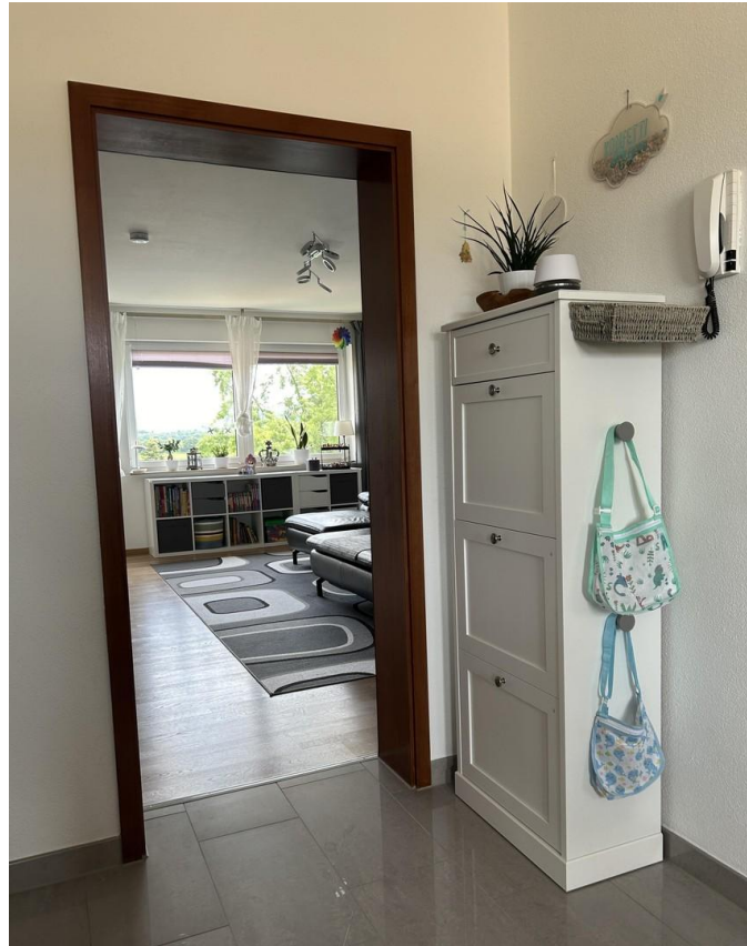
Eingang / Flur