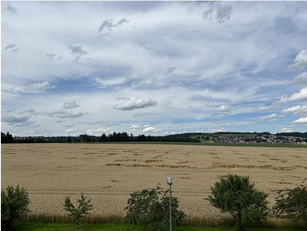
Aussicht Küche / Essen