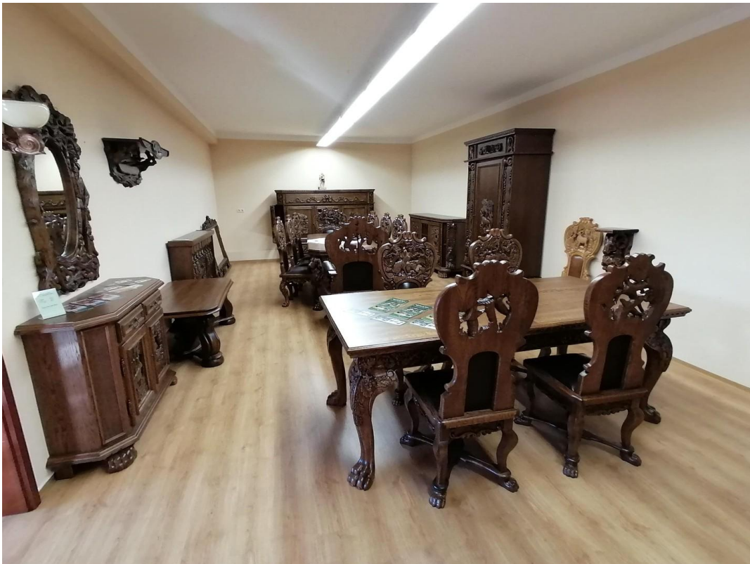
Raum ca. 50qm