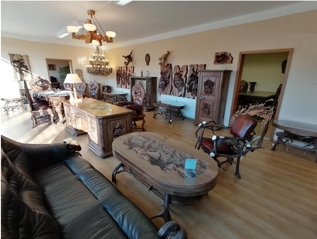
Raum ca. 50qm