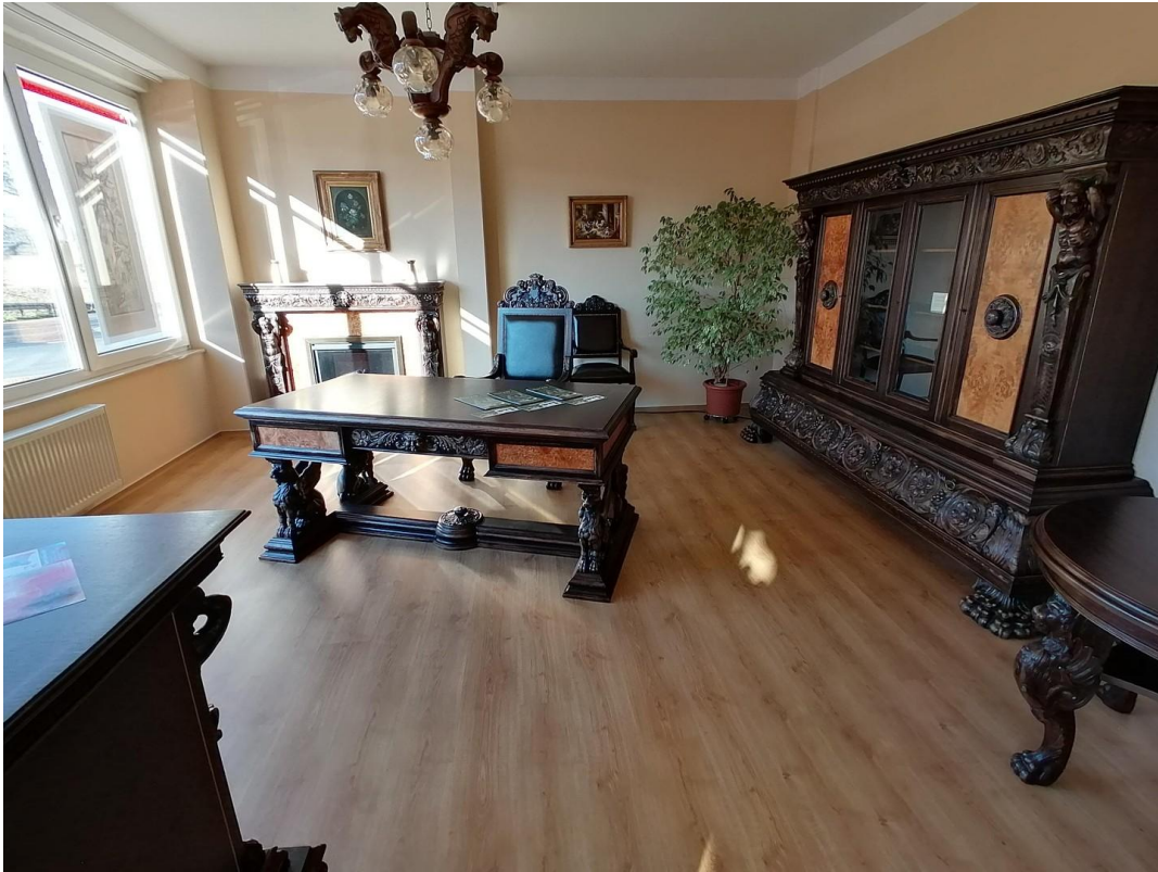
Raum ca. 26qm