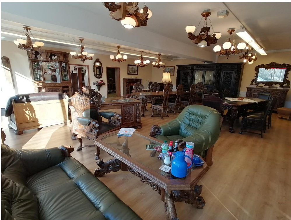
Raum ca. 100qm