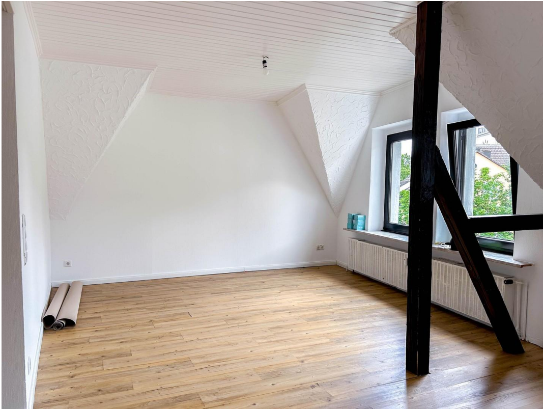
Blick vom Kamin