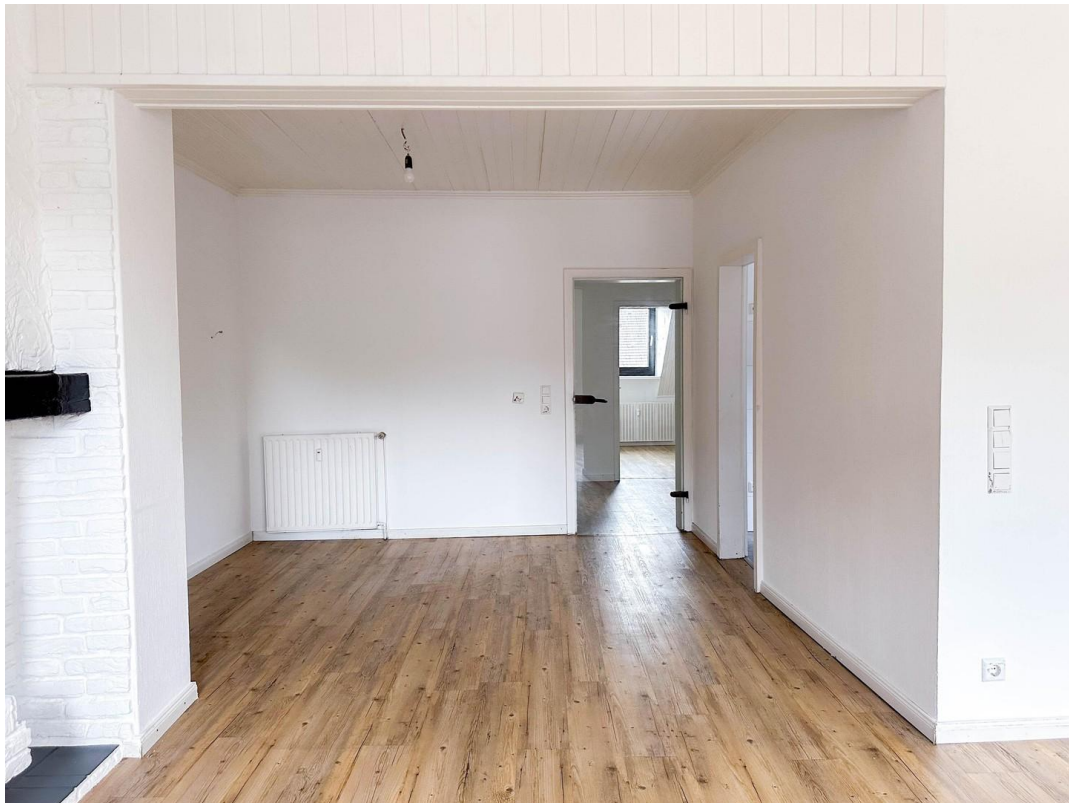
Blick in Richtung Flur