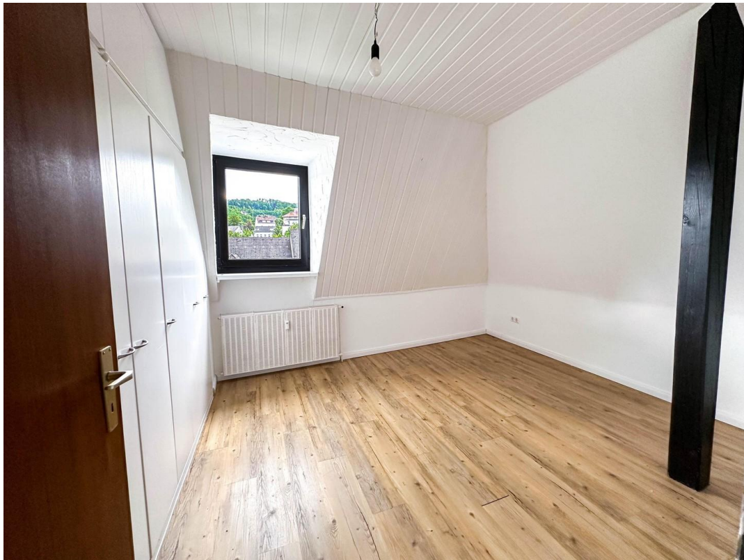
Blick in Schlafzimmer 1