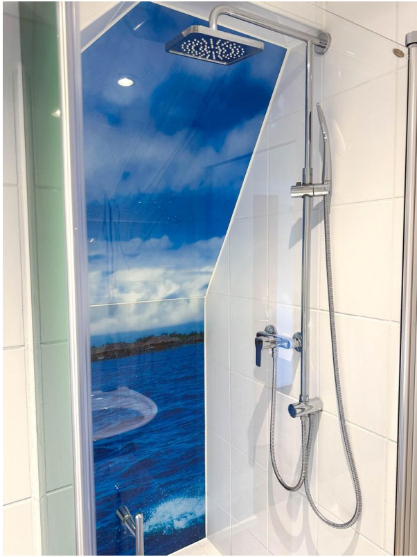
Badezimmer 2 mit Dusche