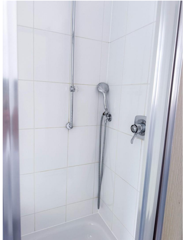
Mit separater Dusche