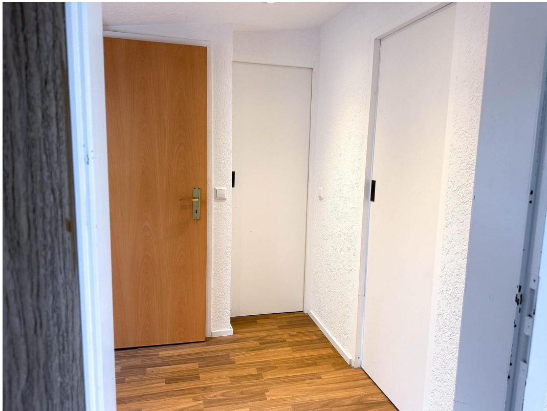
Flur oberes Geschoss