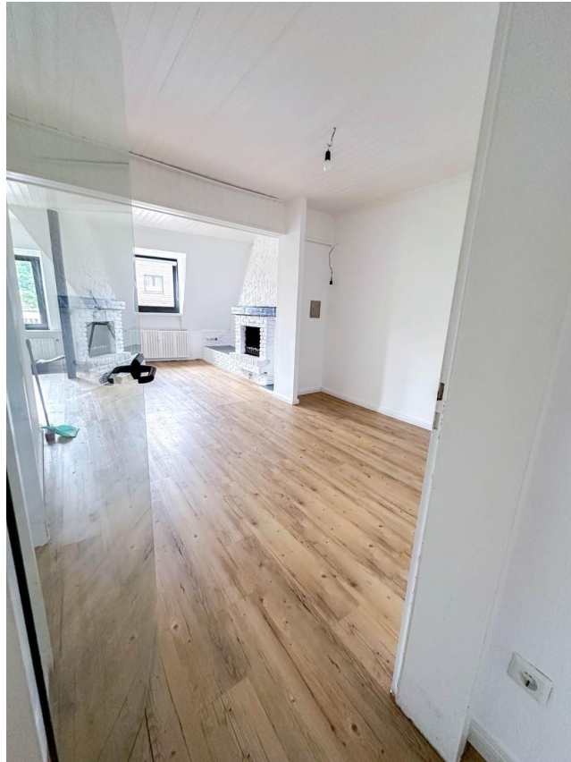
Blick in den Wohn/Essbereich