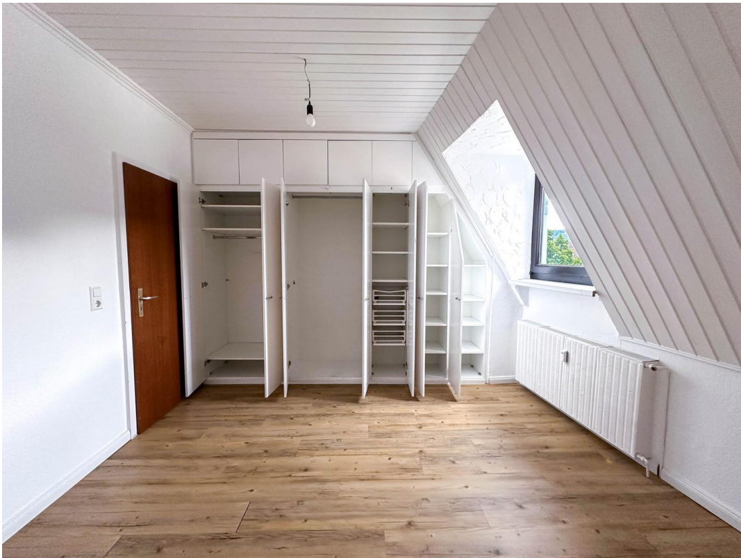
Wandschrank Schlafzimmer 1