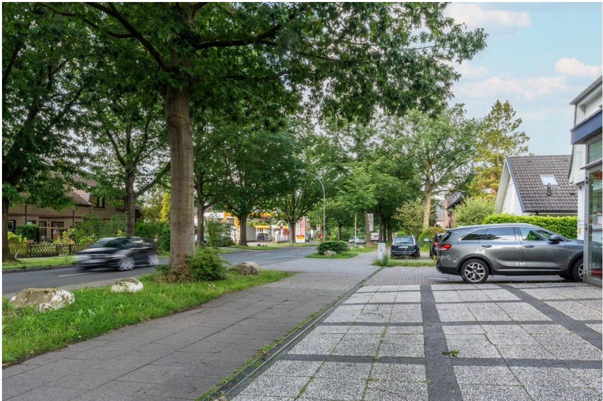
Gegenüber Shell Tankstelle