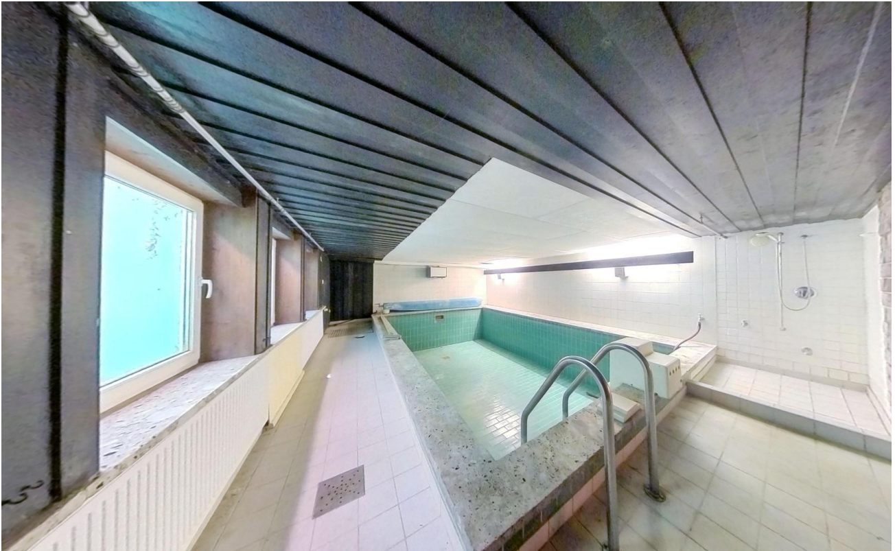
Pool im Keller