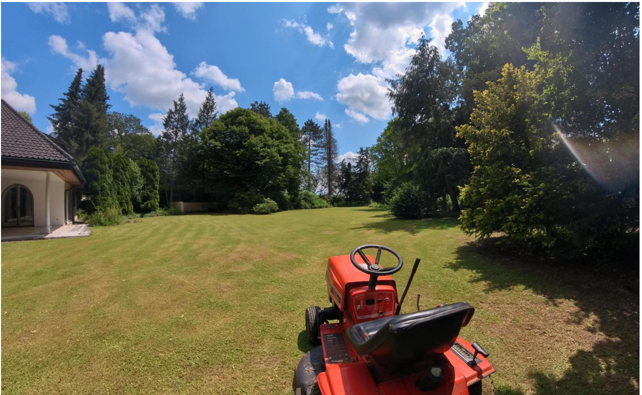
Grundstückspflege vor Start