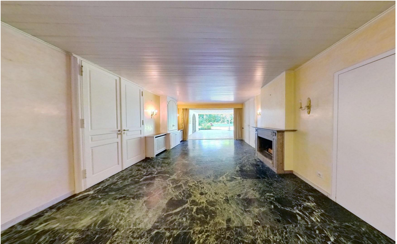
Eingangshalle mit Weitblick