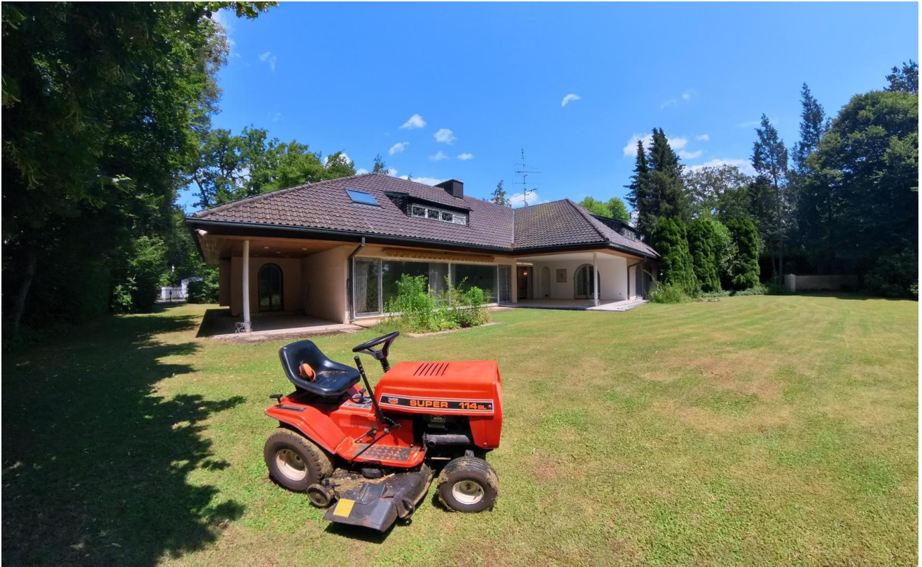
Blick auf die Terrasse