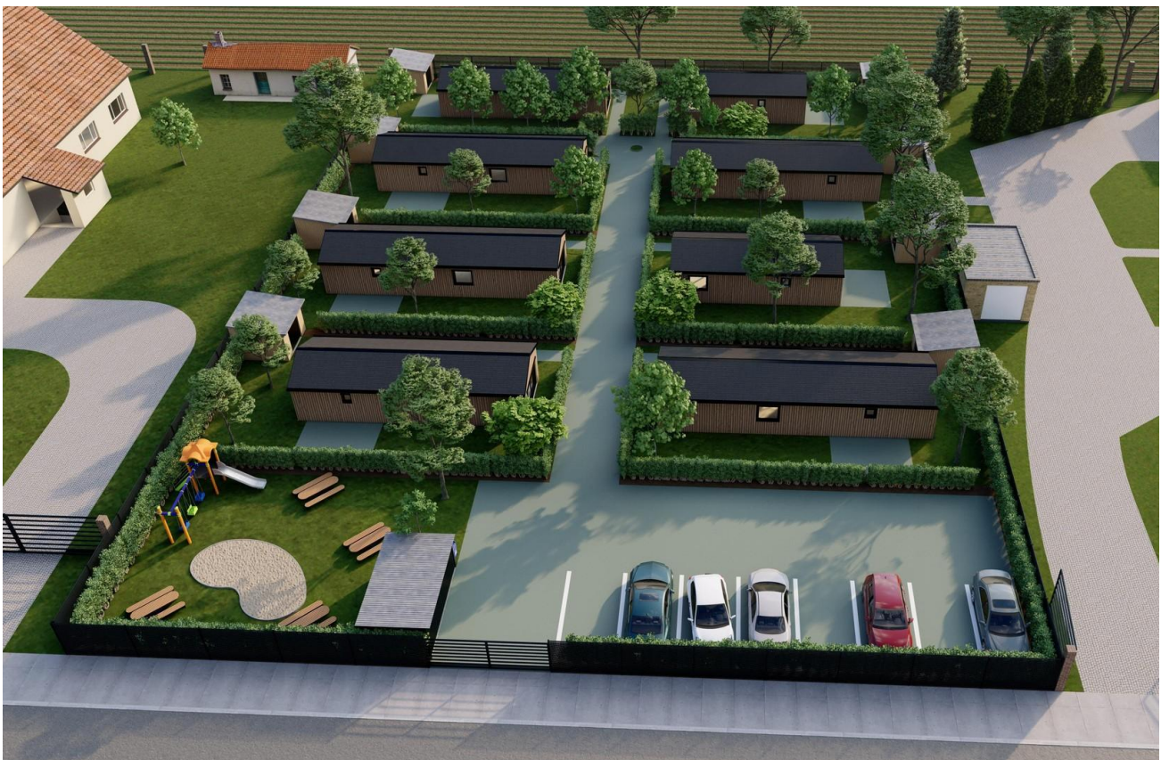
Übersicht Siedlung Südansicht