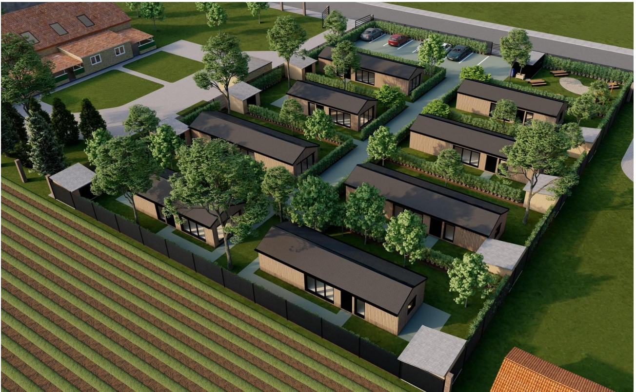
Übersicht Siedlung Nord-Ost