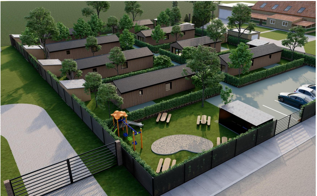
Übersicht Siedlung Süd-Ost