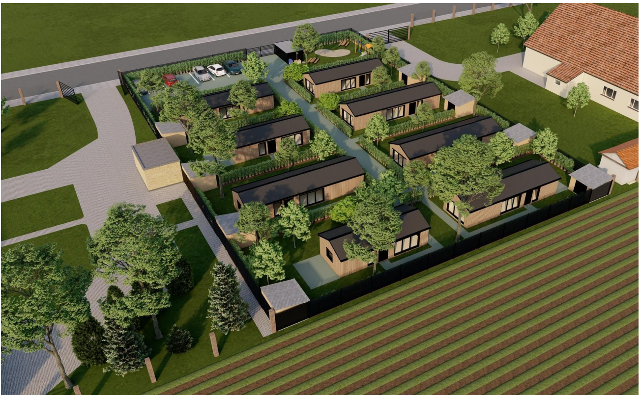
Übersicht Siedlung Nordansicht