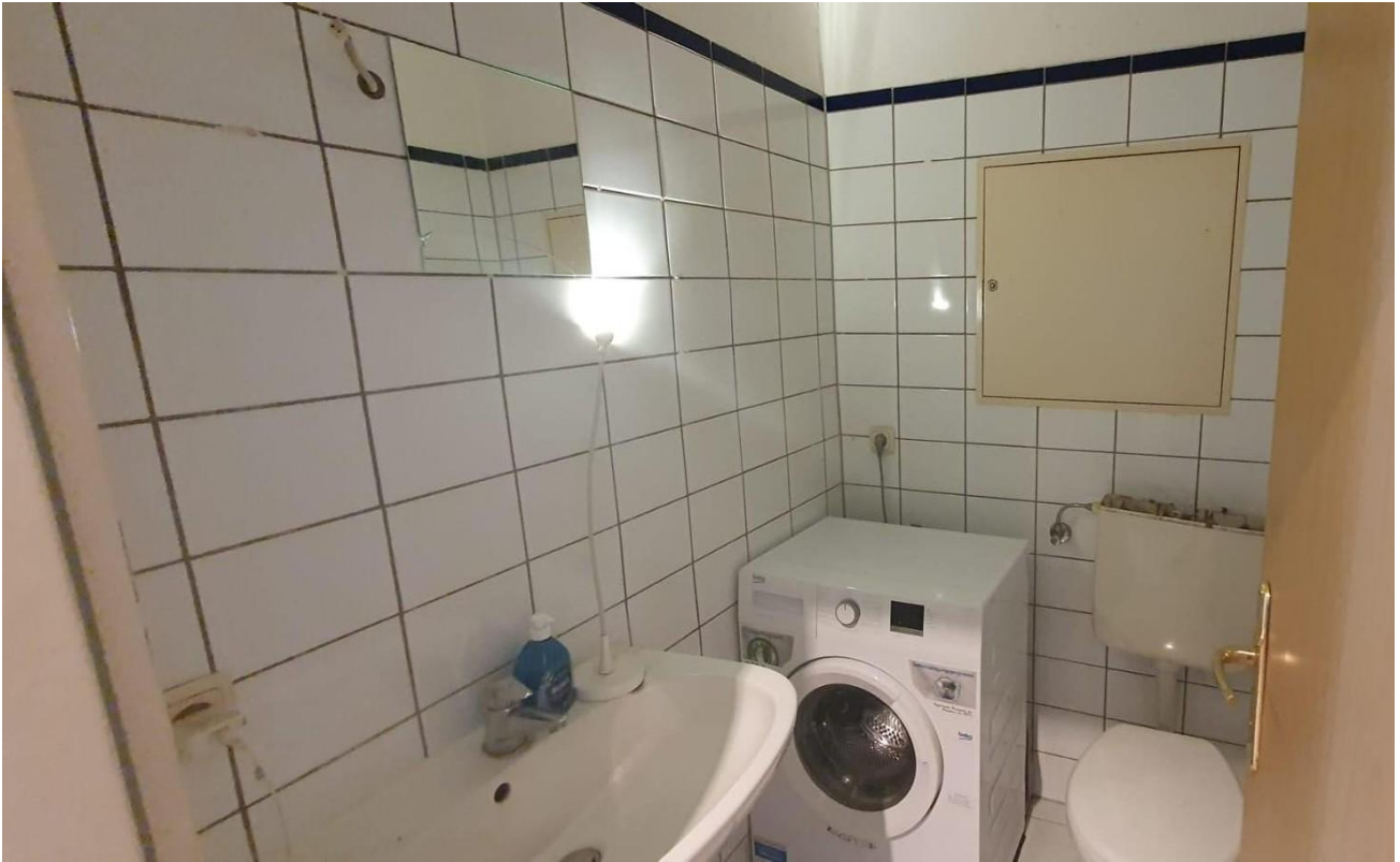
WC mit WT und WM-Anschluss