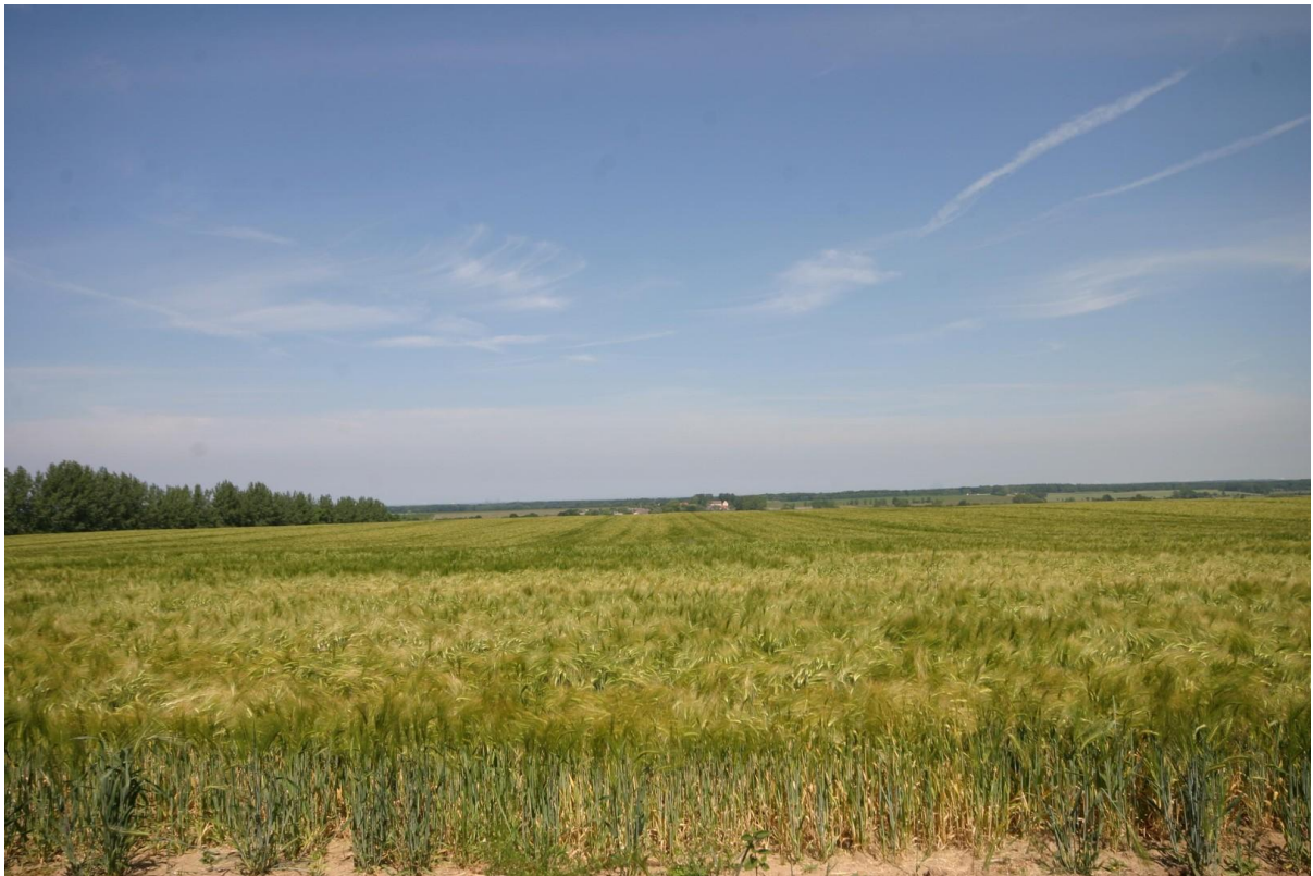
Blick vom Garten aufs Feld