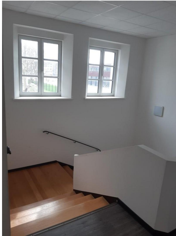
Treppenaufgang von oben