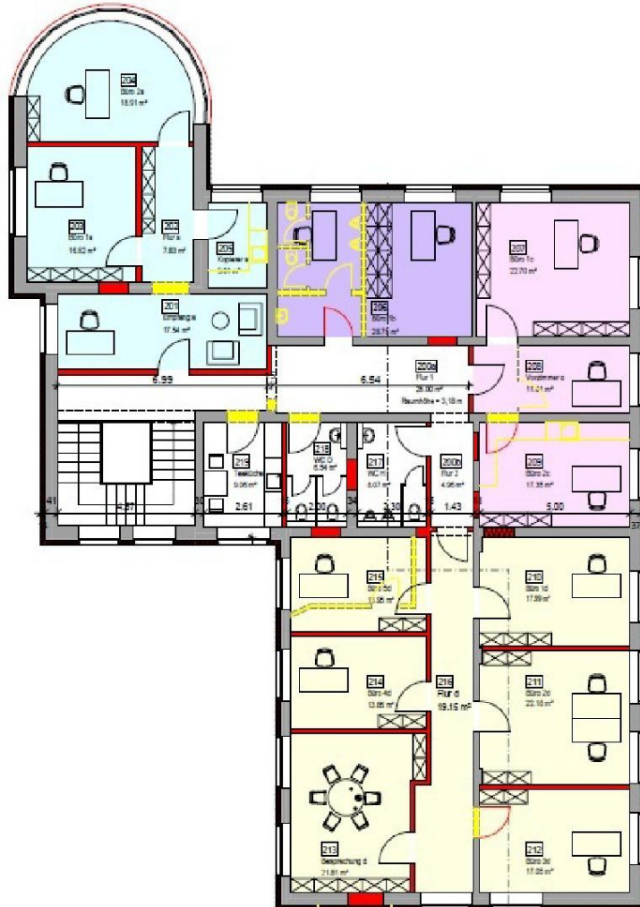
Anlage 1.1: Lage der Mietfläche im Obergeschoss (gelb gekennzeichnet)