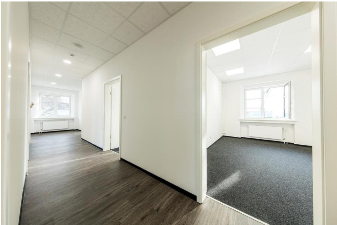
Flur und Büroraum