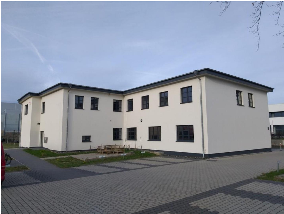
Gebäudeansicht mit Parkplätzen