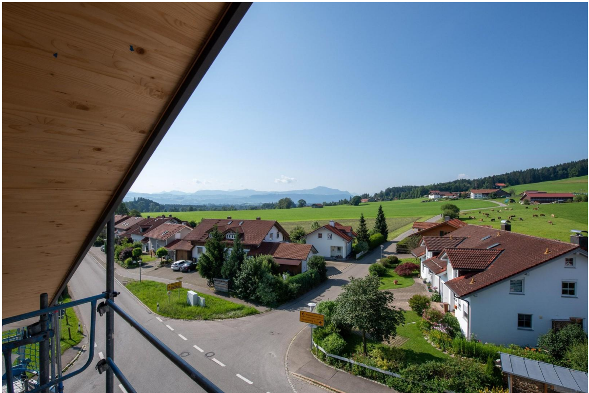
Ansicht von oben