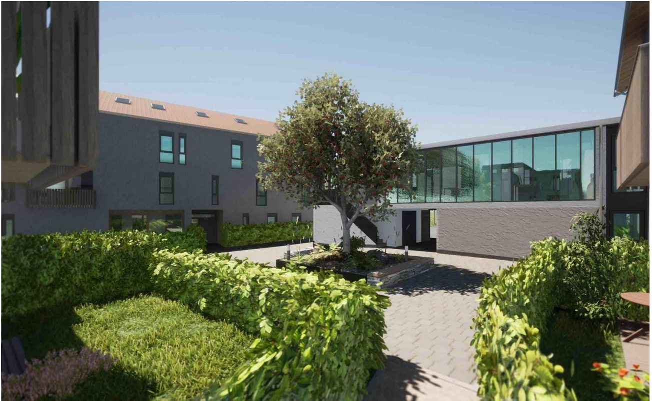
Innenhof mit Blick auf Gewerbe