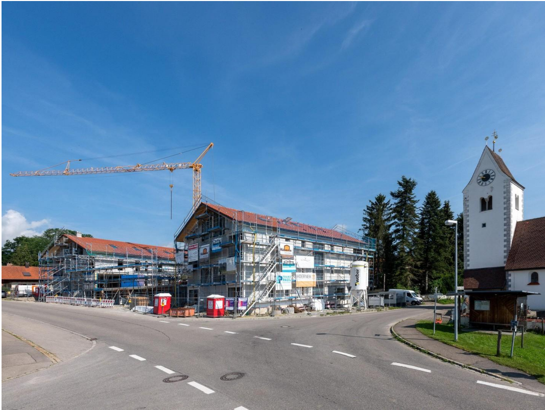
Haus A im Vordergrund