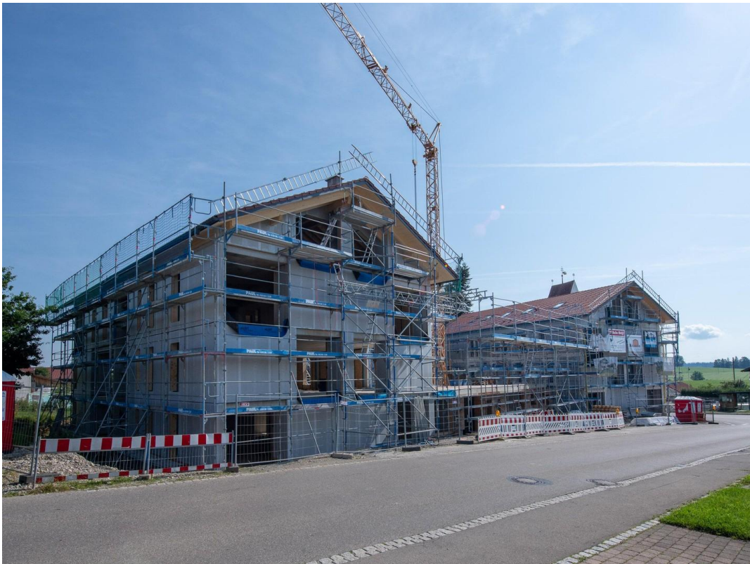
Haus C im Vordergrund