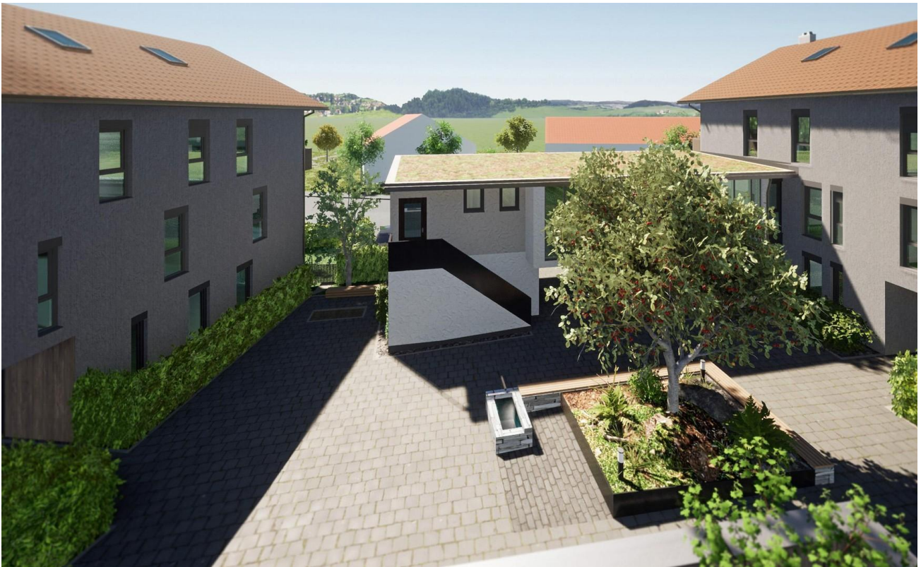
Innenhof mit Blick au Gewerbe