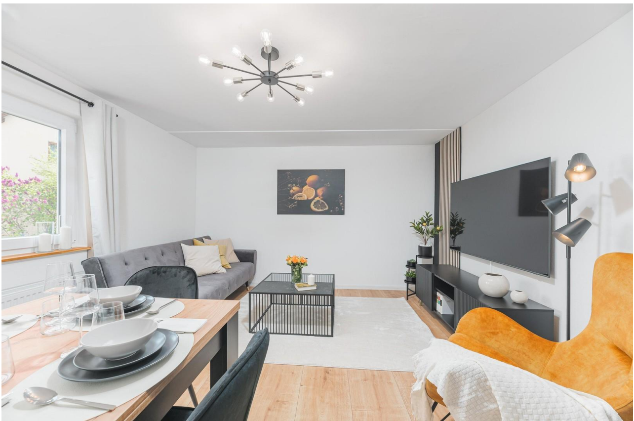
Wohnzimmer mit Esstisch