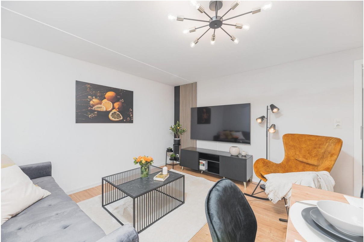
Wohnzimmer mit Esstisch