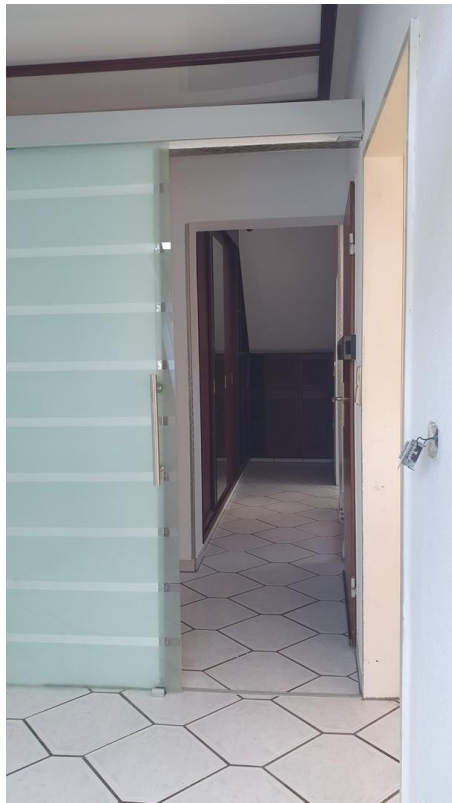
Von Nische zum Flur