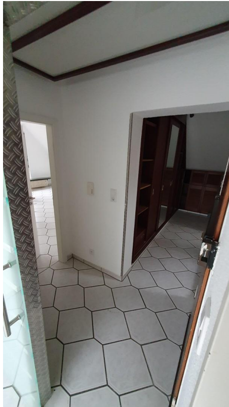
Flur, links zum Wohnzimmer