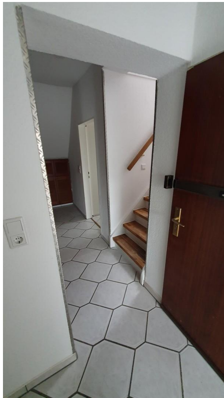
Flur, Blick zum Bad und OG