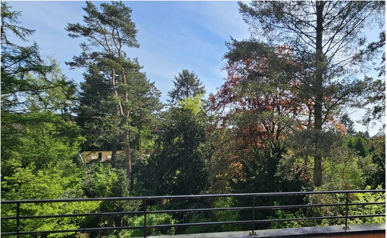
Blick aus dem Balkon