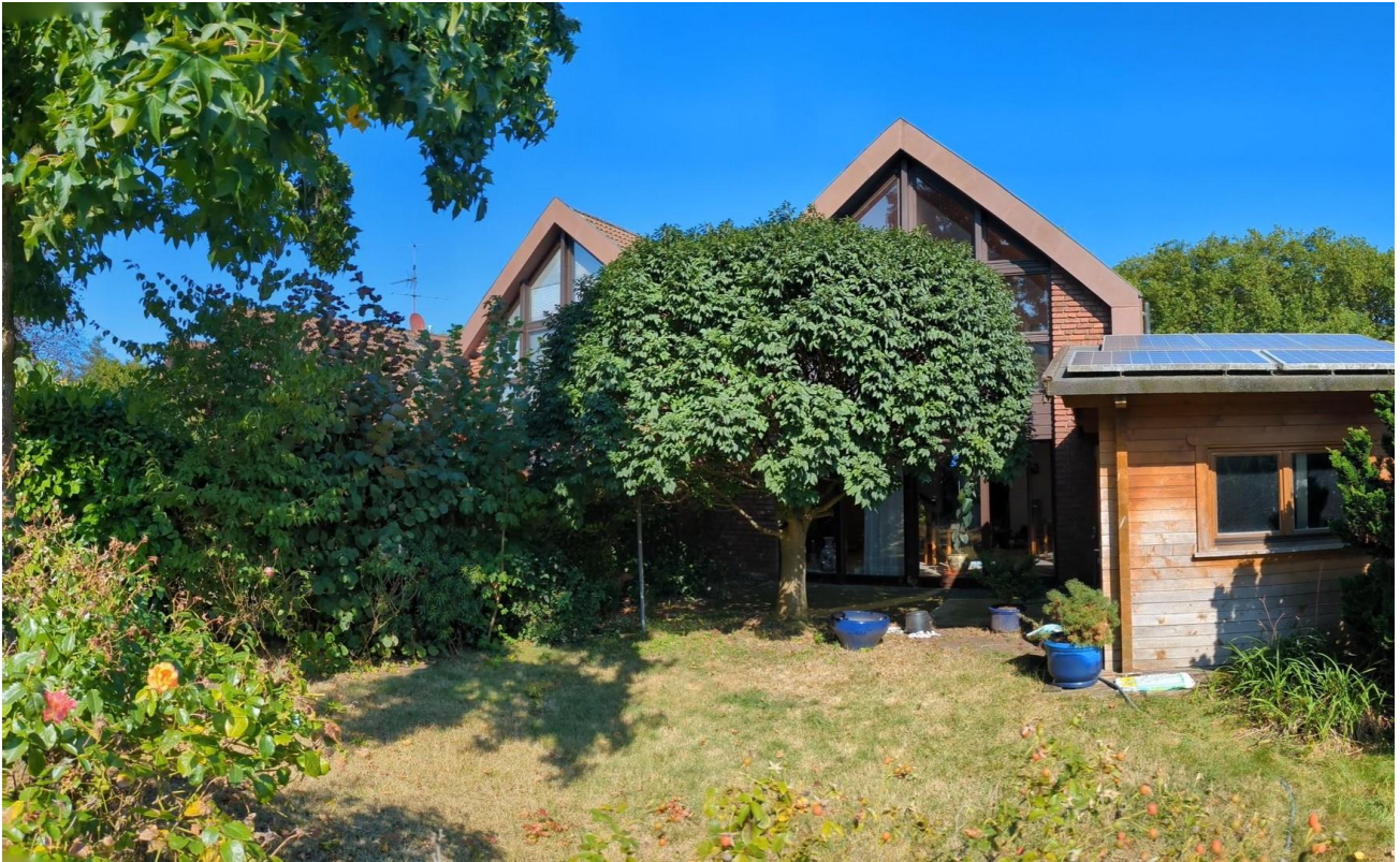
Rückseite mit Gartenhaus