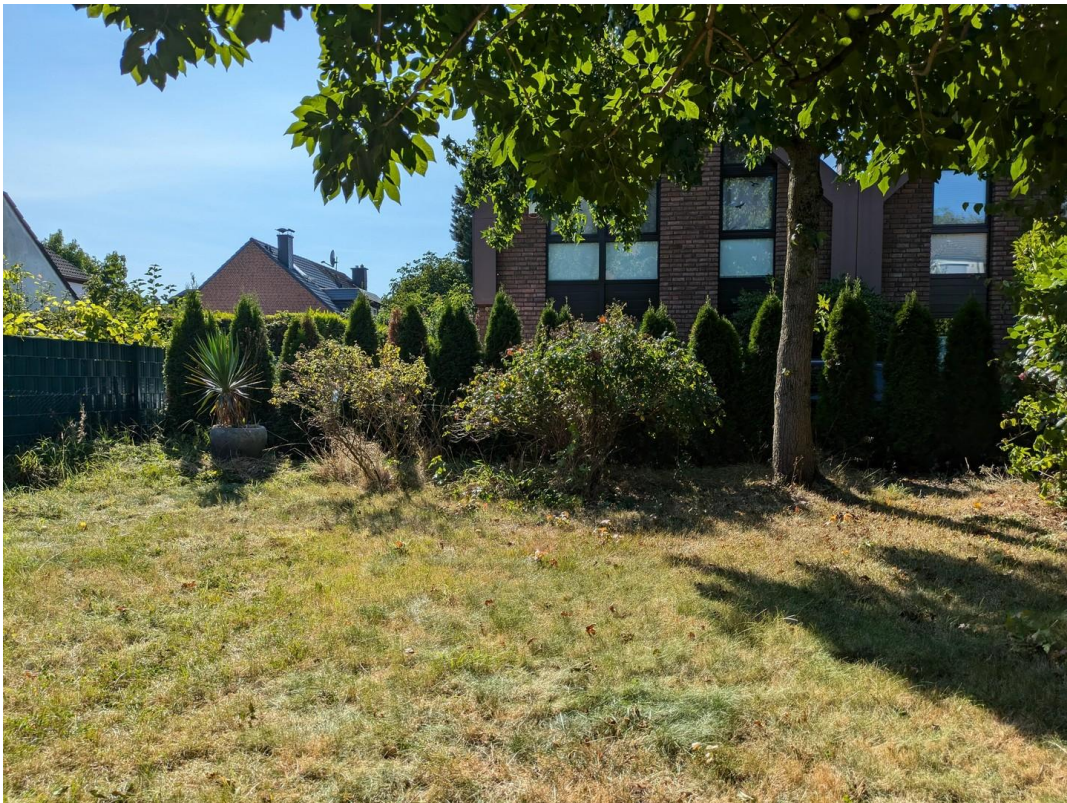
Garten mit alten Bäumen