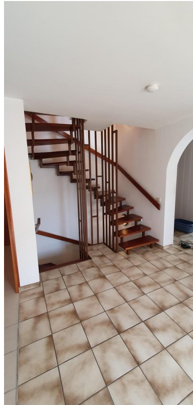
Aufgang zum 1. OG