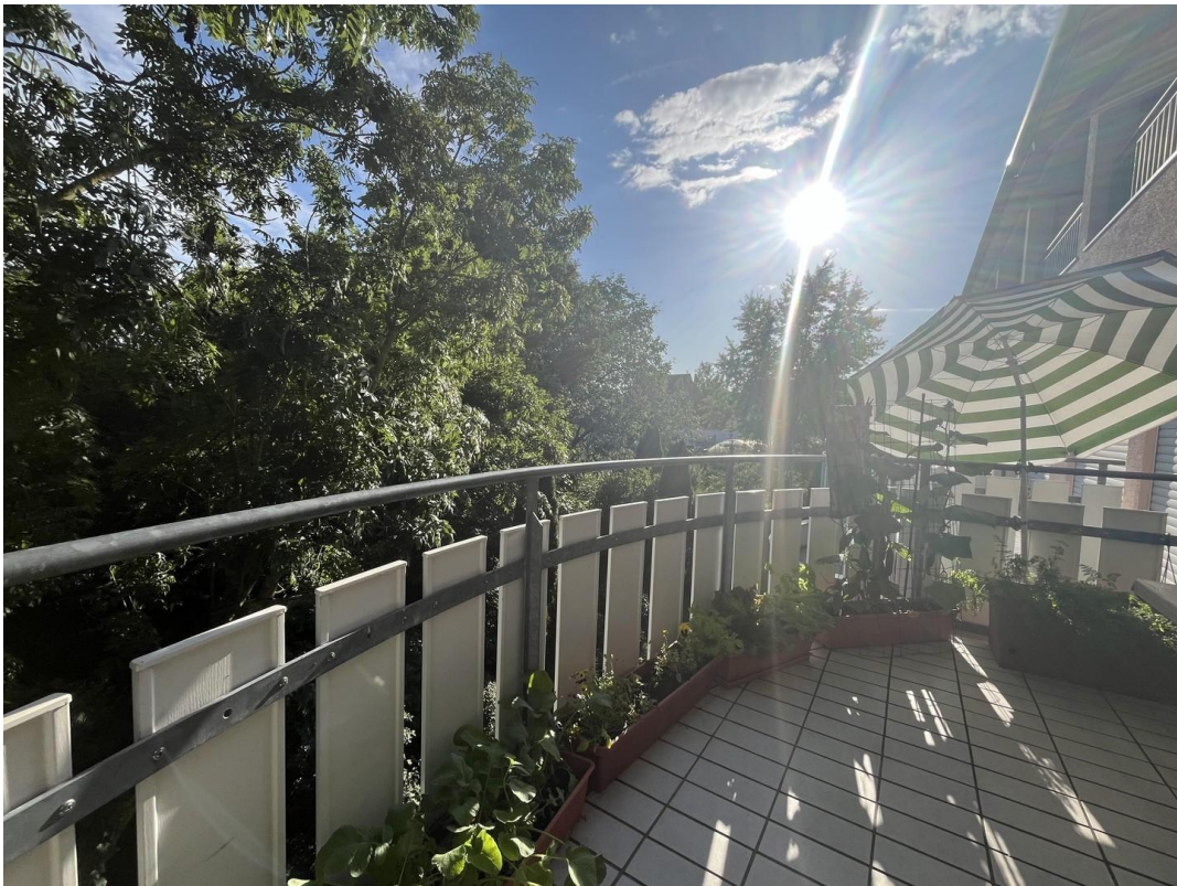
Abendsonne auf dem Balkon