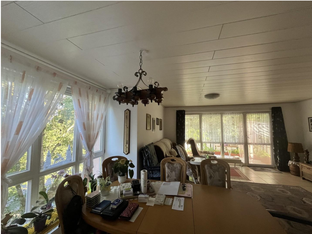
Essbereich zum Wohnzimmer