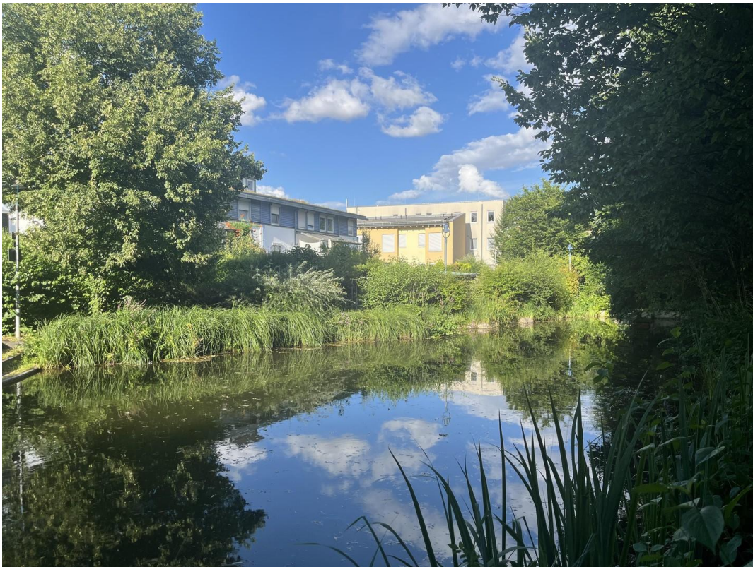
ruhige Lage am Park mit See