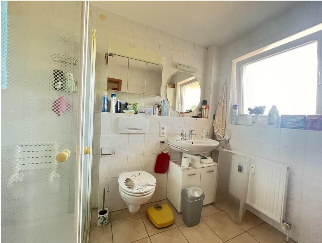
Bad mit bodenebener Dusche