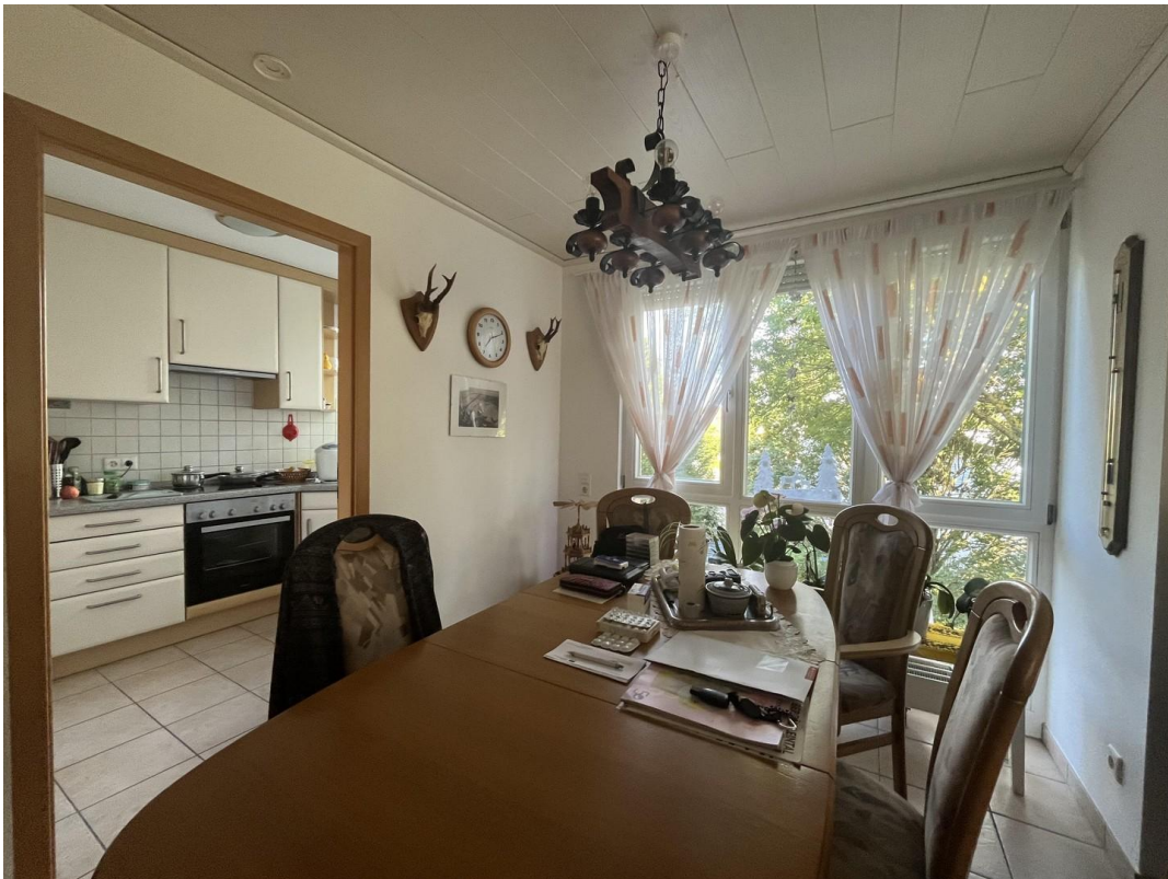
Essbereich zur Küche