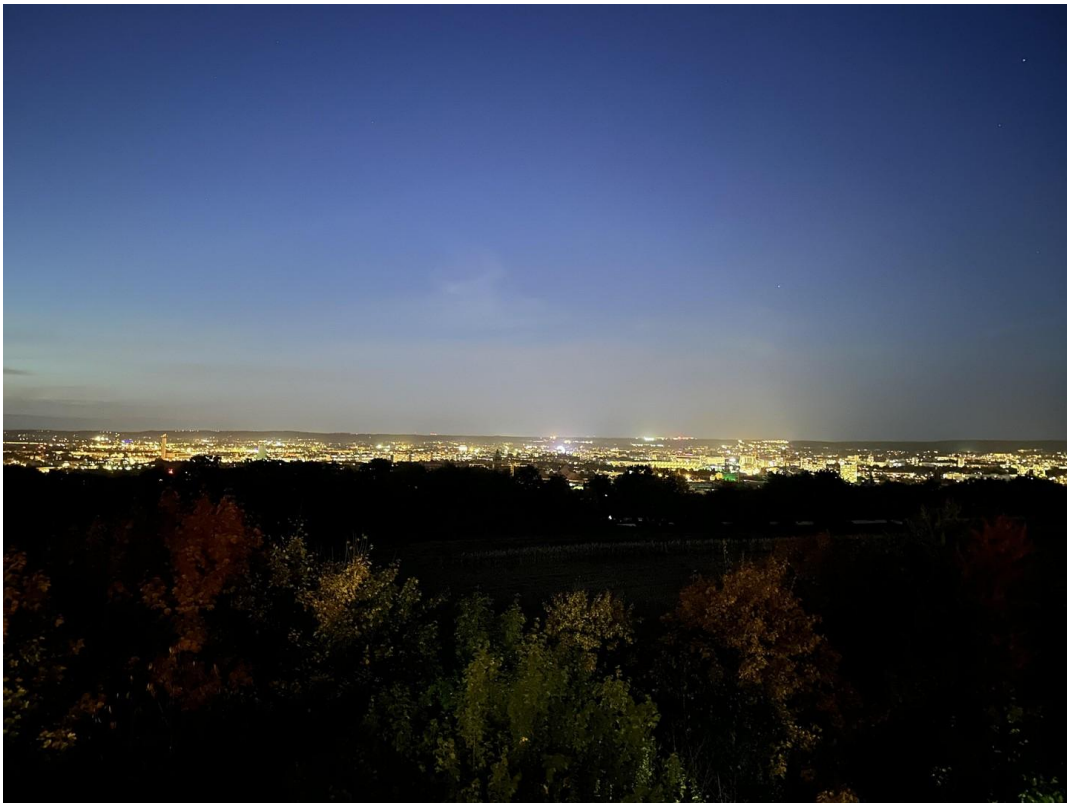
Ausblick von der Wohnung