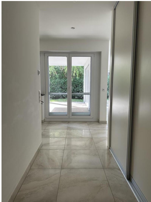
Ausgang zur Terrasse