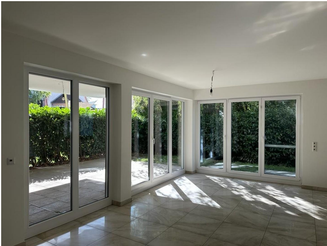
Wohnzimmer(Blick auf Terrasse)