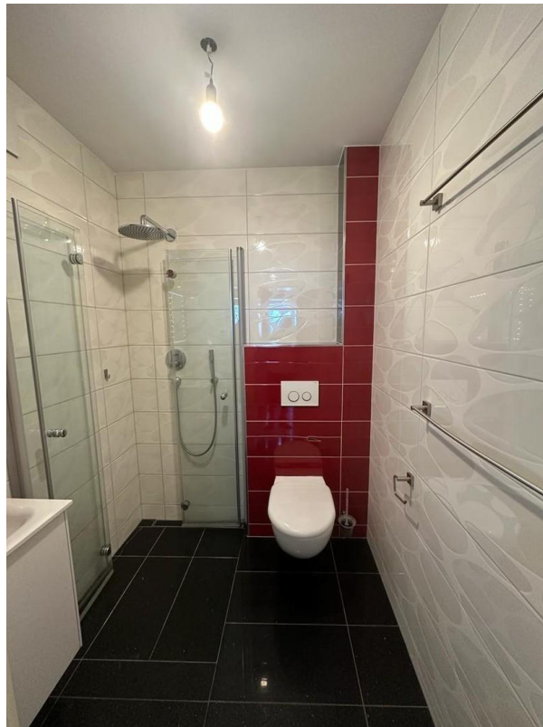
Dusche mit WC_01