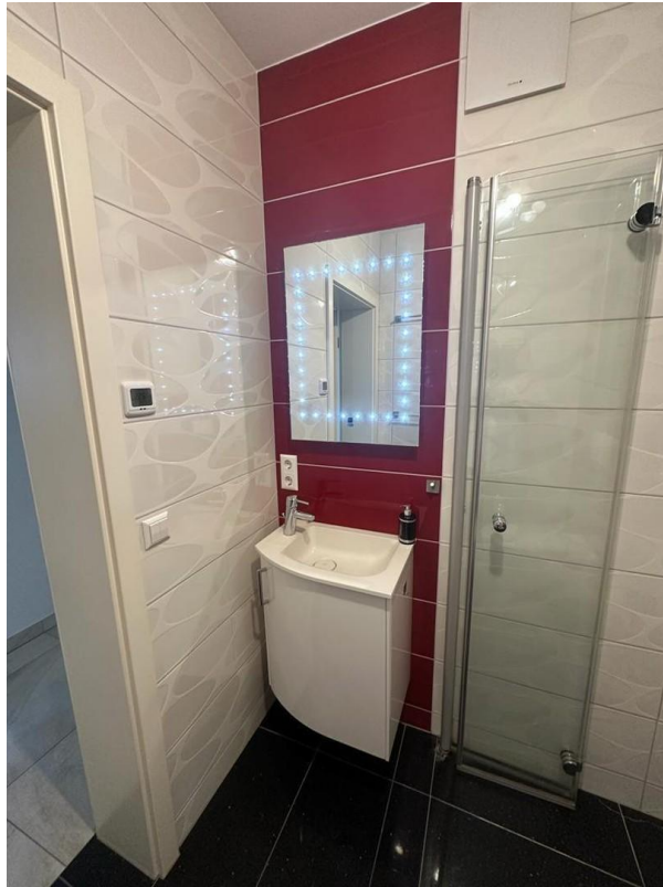
Dusche mit WC_02