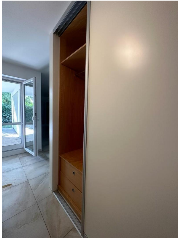
Diele mit Einbauschränk