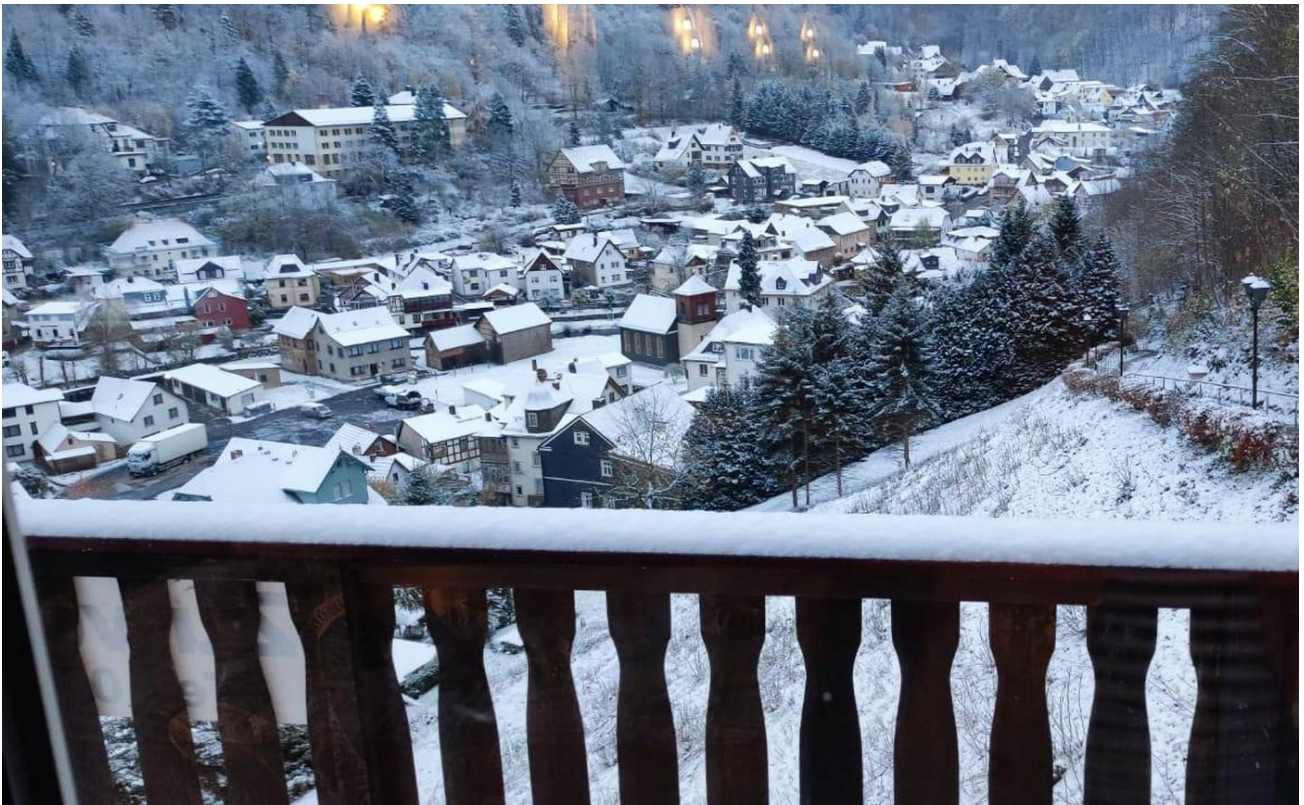
Aussicht im Winter