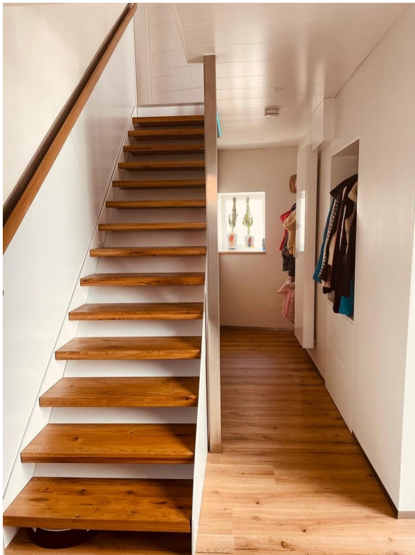
Treppe ins 1.OG