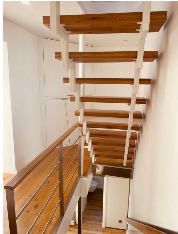
Treppe ins 2.OG