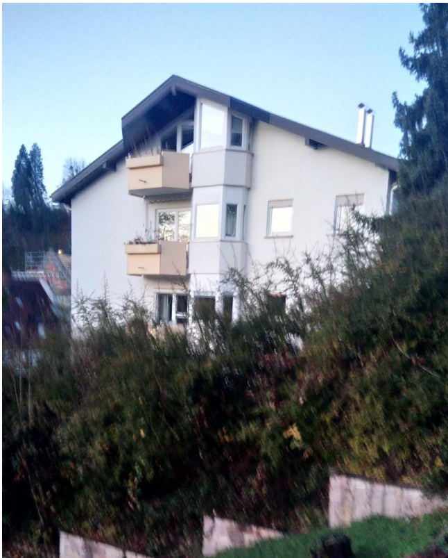
Ansicht des Hauses