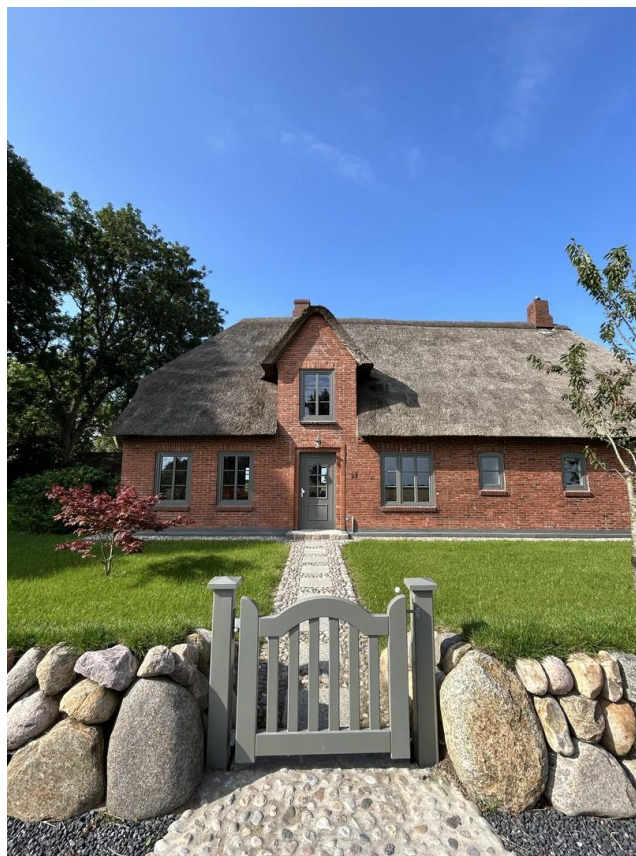
Reetdachhaus in Risum-Lindholm