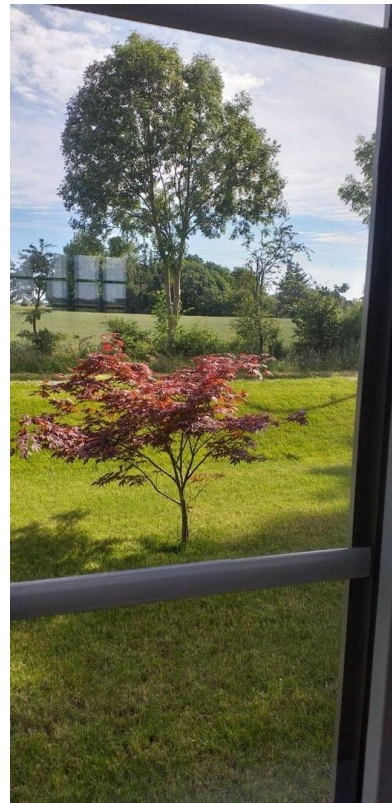
Blick ins Grüne