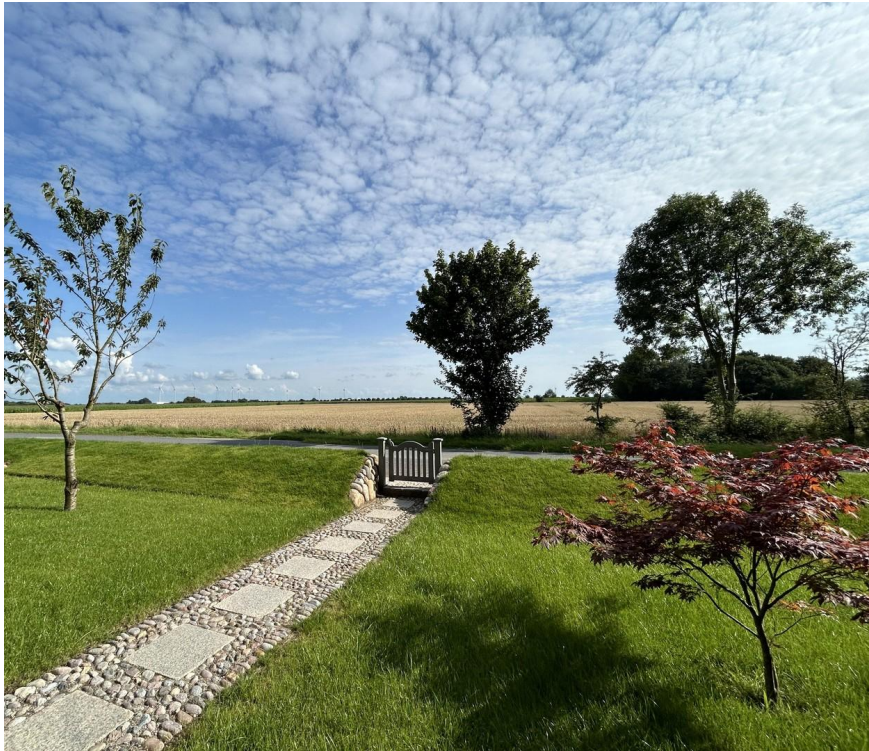
Weg zum Haus