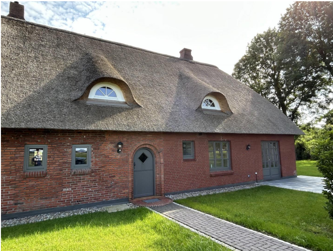
Weg zum Hintereingang Klöntür