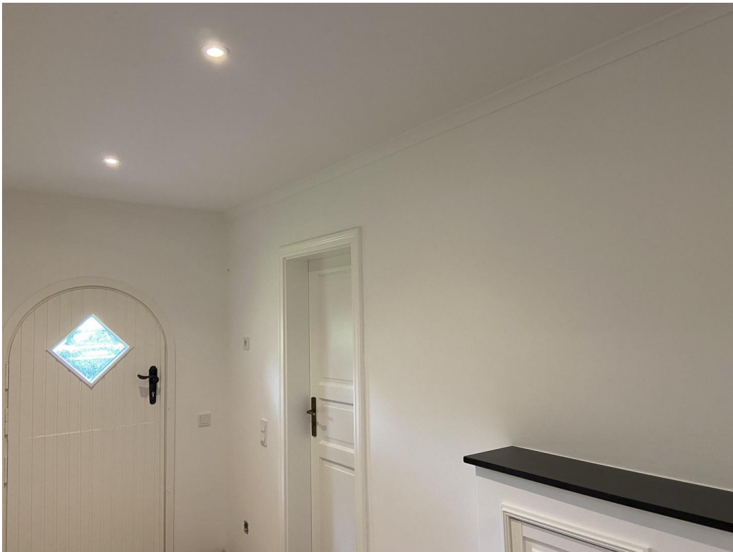
Flur und Klöntür Garten