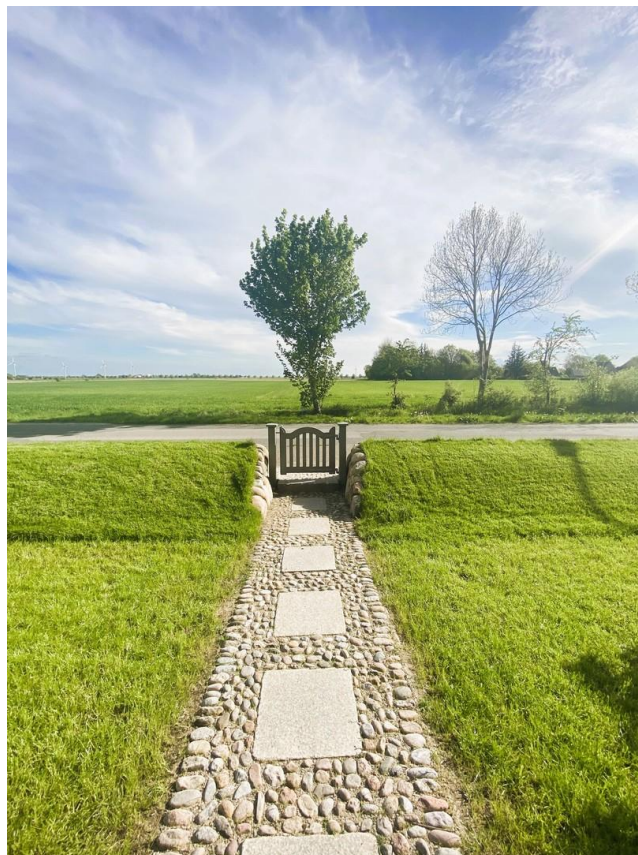
Weg zum Haus