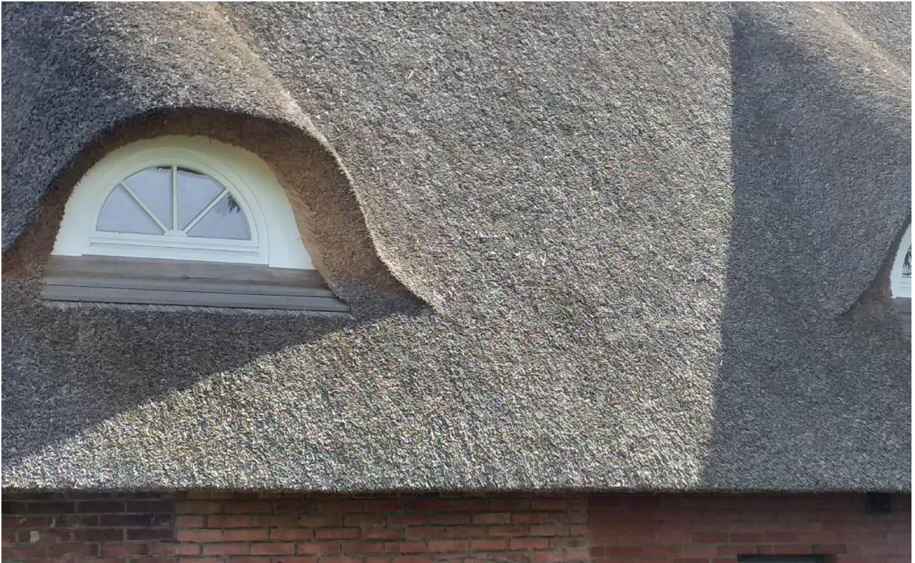
DG mit Gauben ausbaufähig