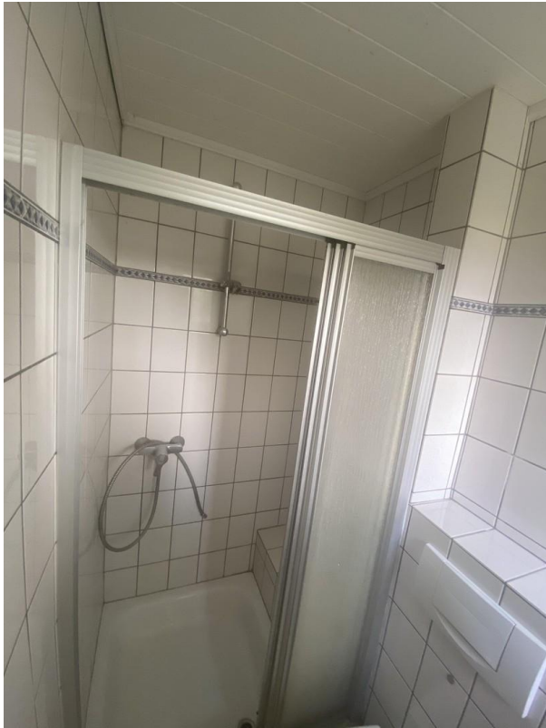
Gäste-WC mit DU