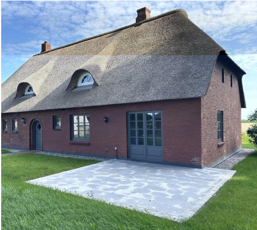
Große Süd/West Terrasse