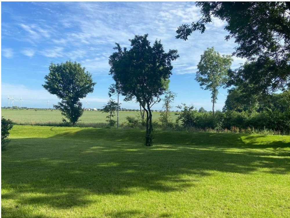
Garten mit altem Baumbestand