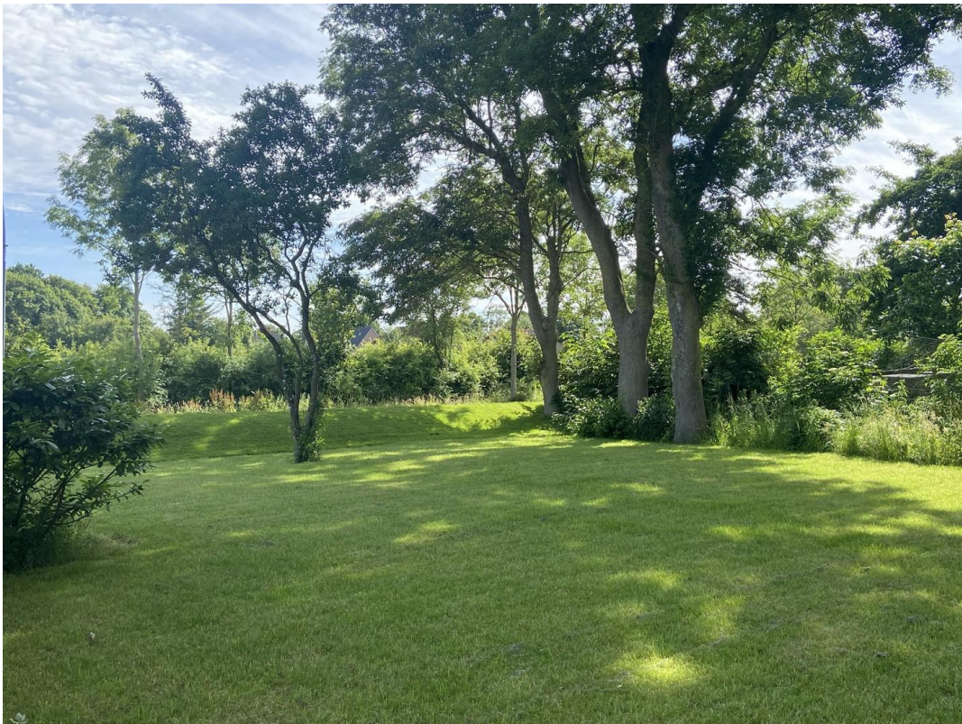
Garten schön eingewachsen