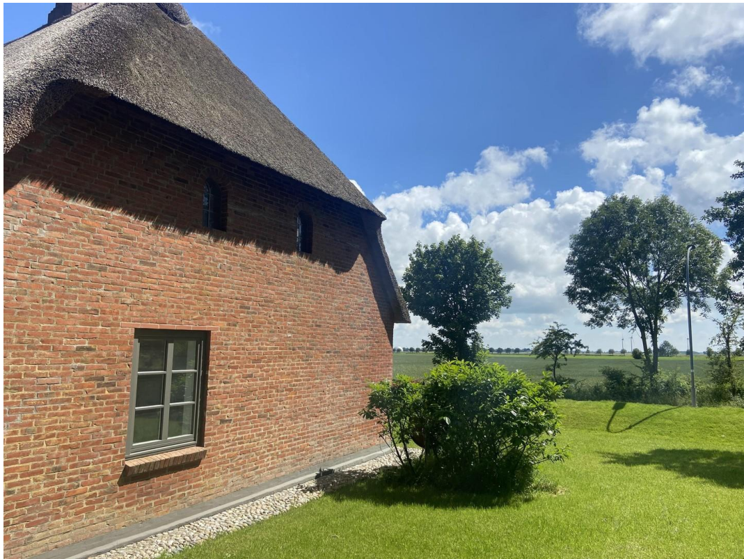
Fenster Essbereich Garten