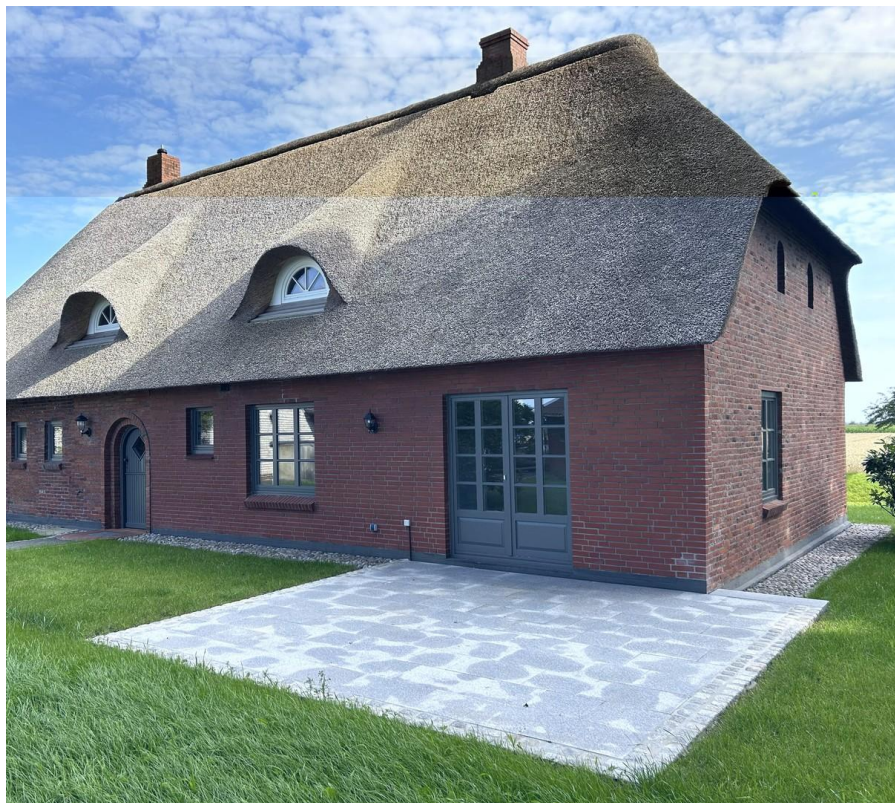
Große Süd/West Terrasse