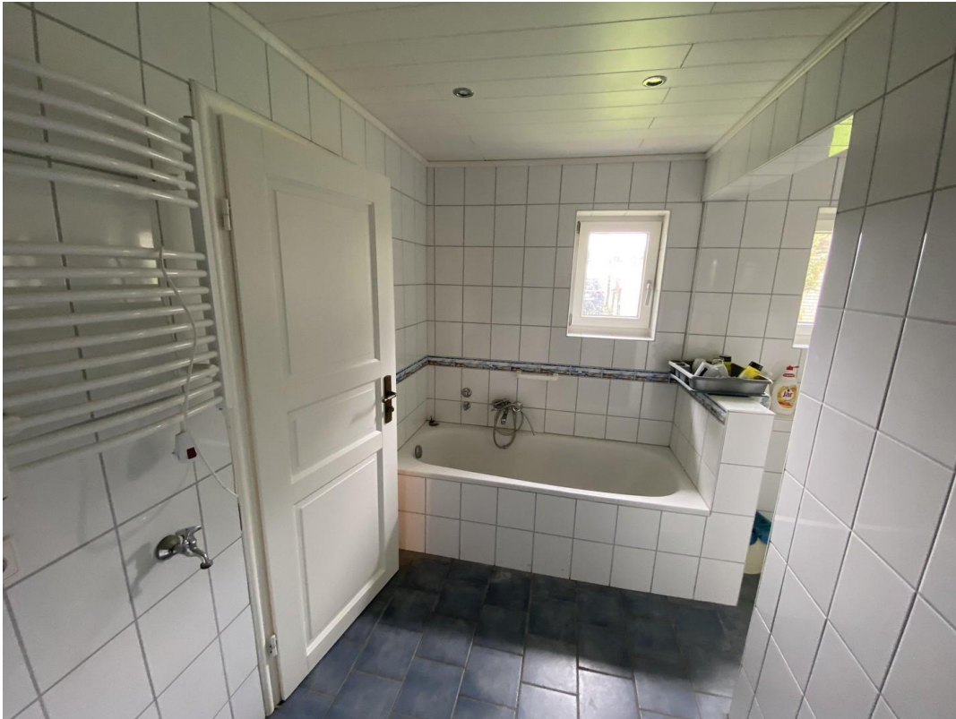
Bad mit Badewanne