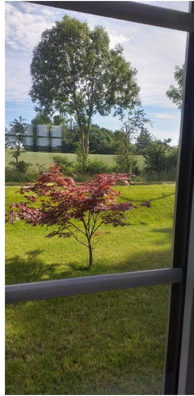
Blick ins Grüne