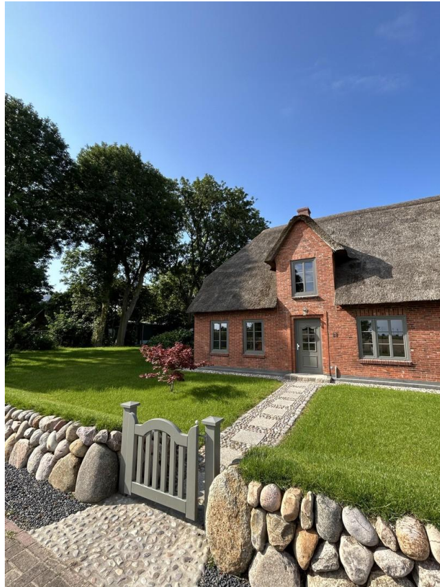
Sehr schön angelegt