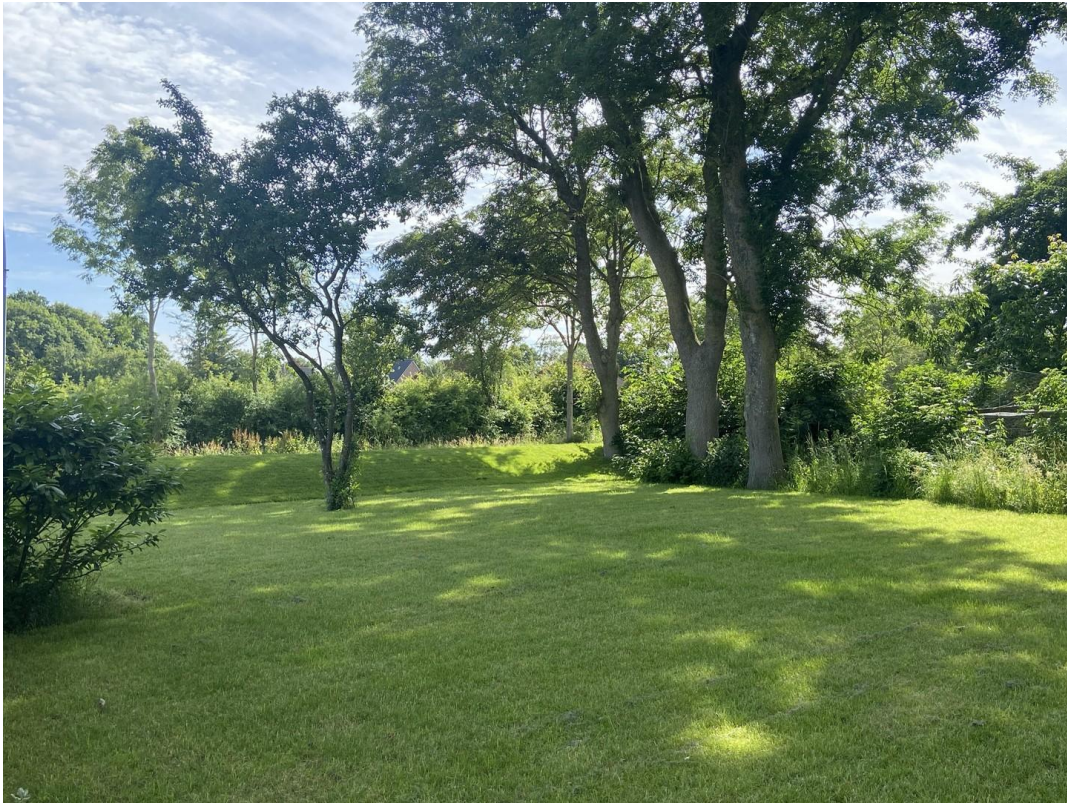
Garten schön eingewachsen