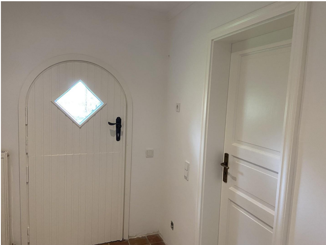
Ausgang Klöntür zum Garten