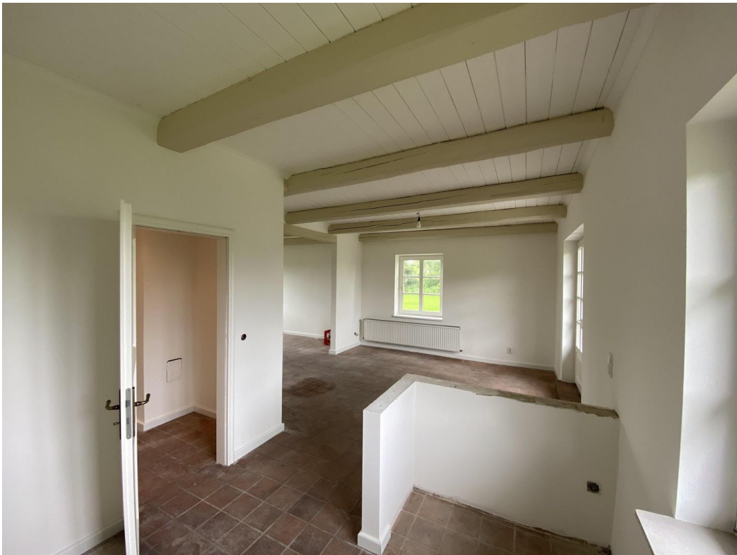
Küche mit Essbereich