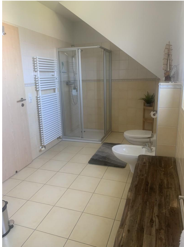
Vollbad mit bodentiefer Dusche