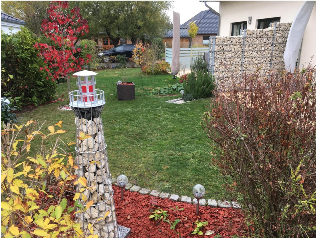
Garten mit Leuchtturm