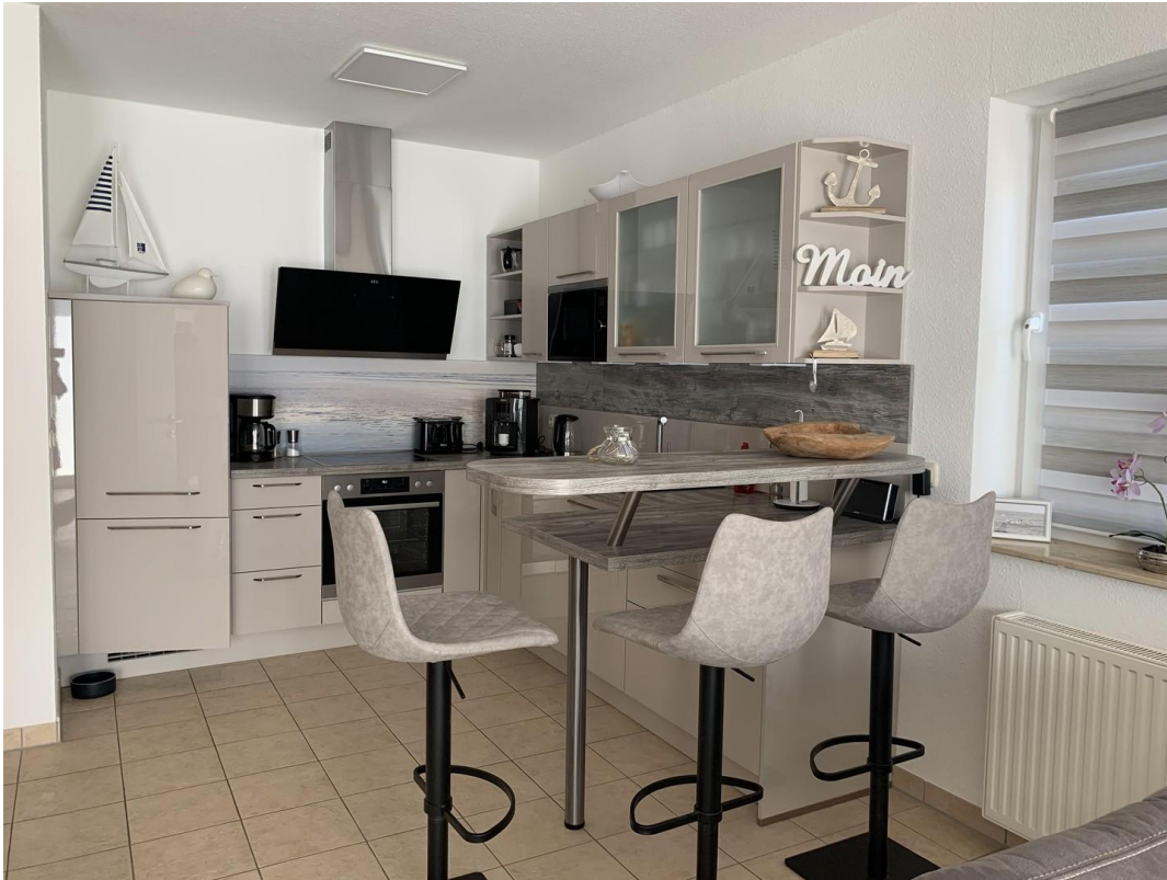
maßangefertigte Küche mit Bar