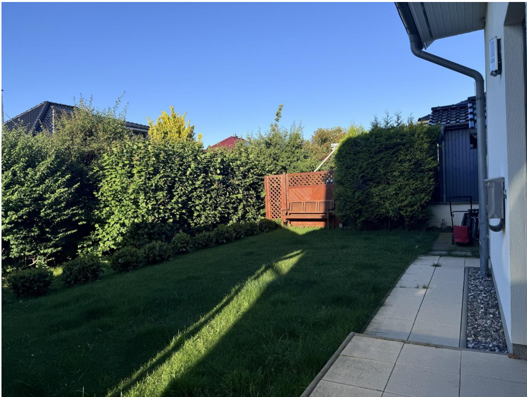
Rasenfläche hinter dem Haus