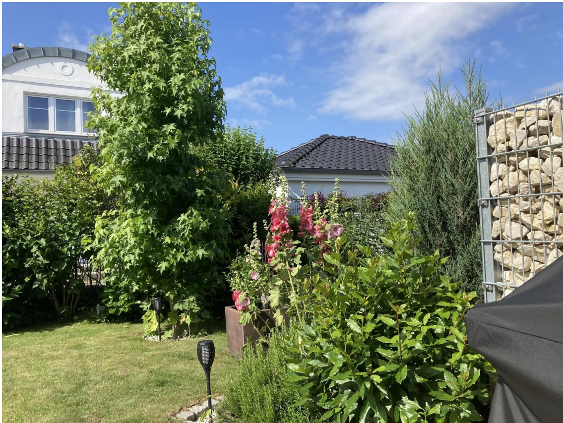
Garten vor dem Haus