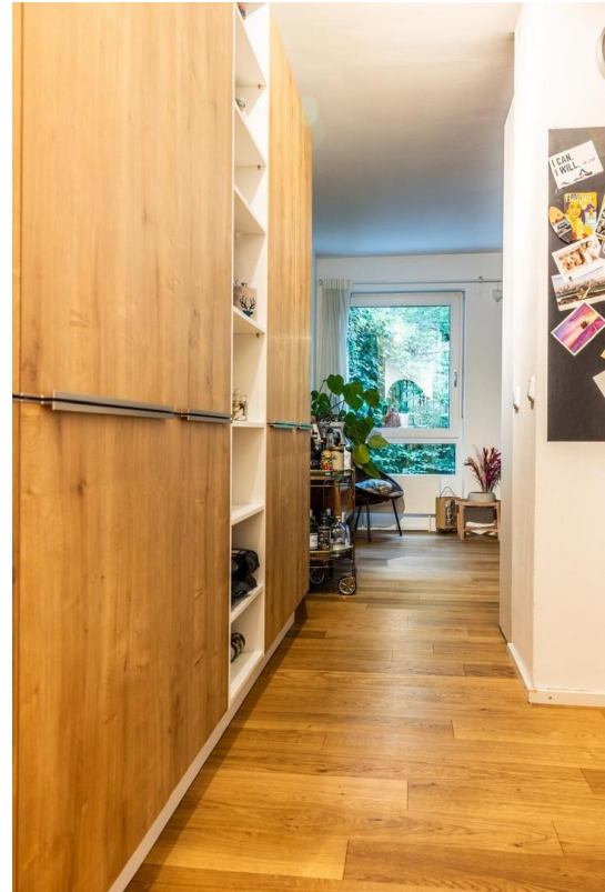
Wohnbereich / Küche