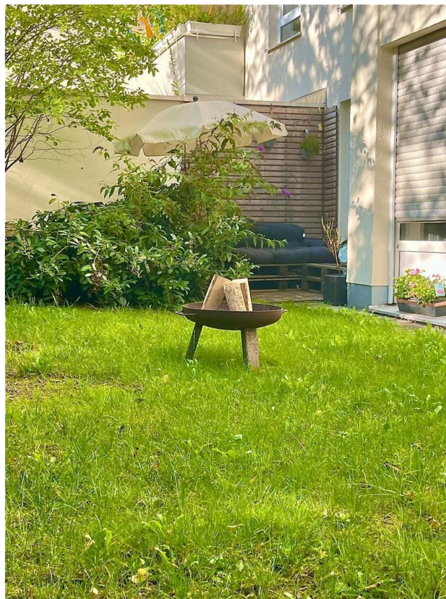
Garten / Lounge