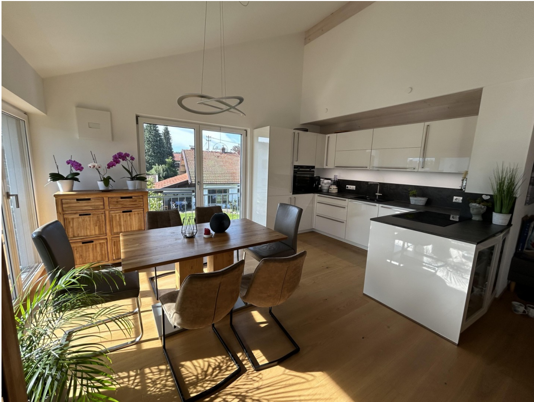
offene moderne Wohnküche