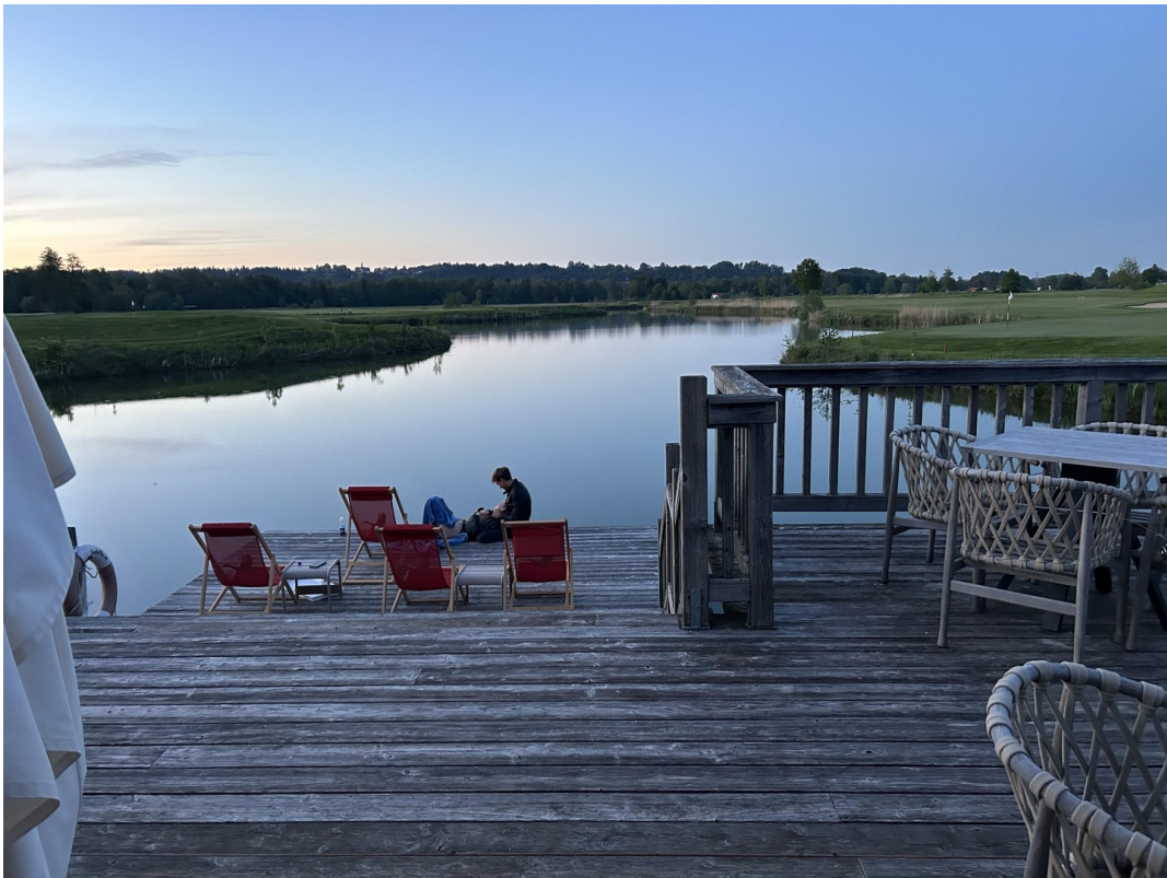
Café am Golfplatz