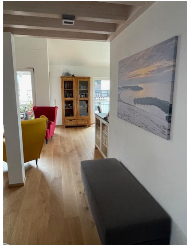
Gang zum Wohnbereich