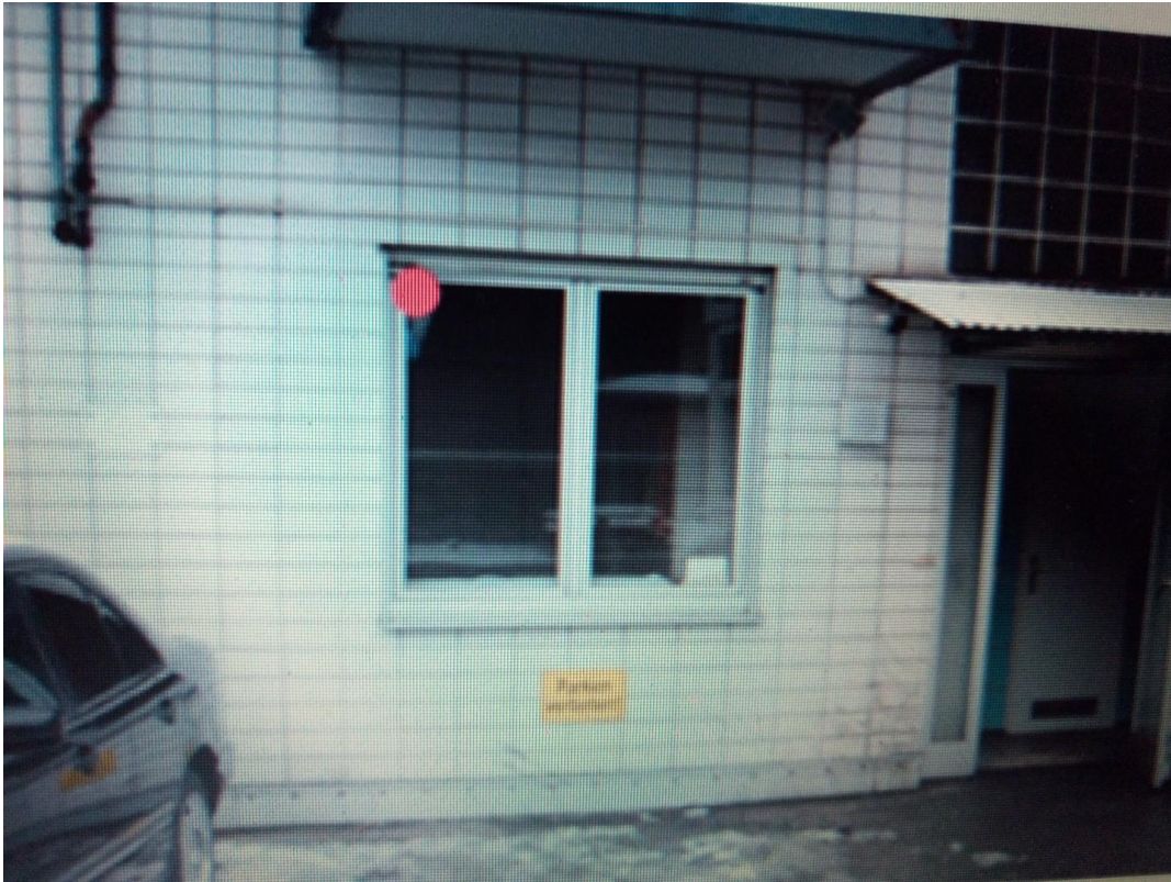
Fenster zum Hinterhof