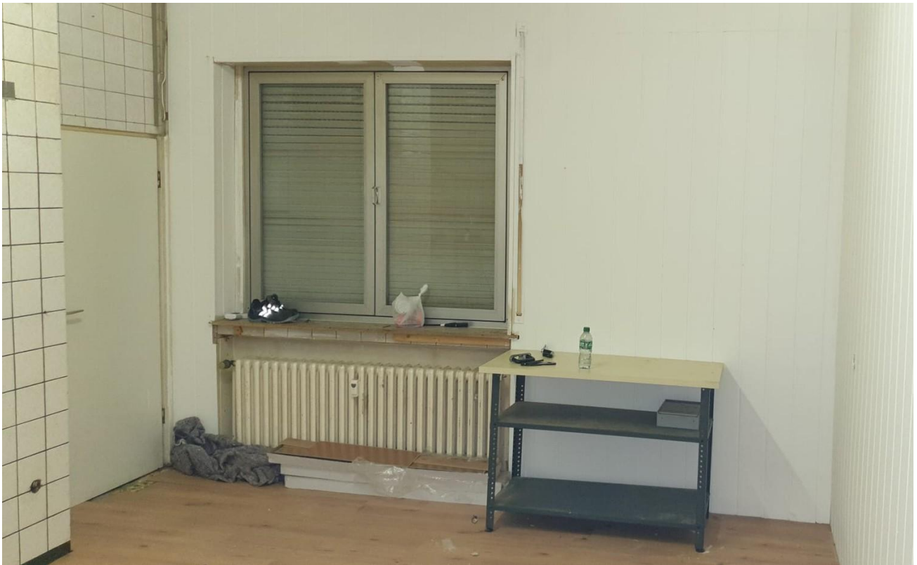
Zimmer oder Laden