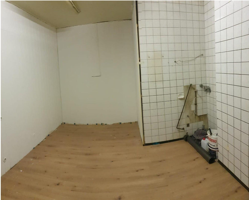
Zimmer oder Laden