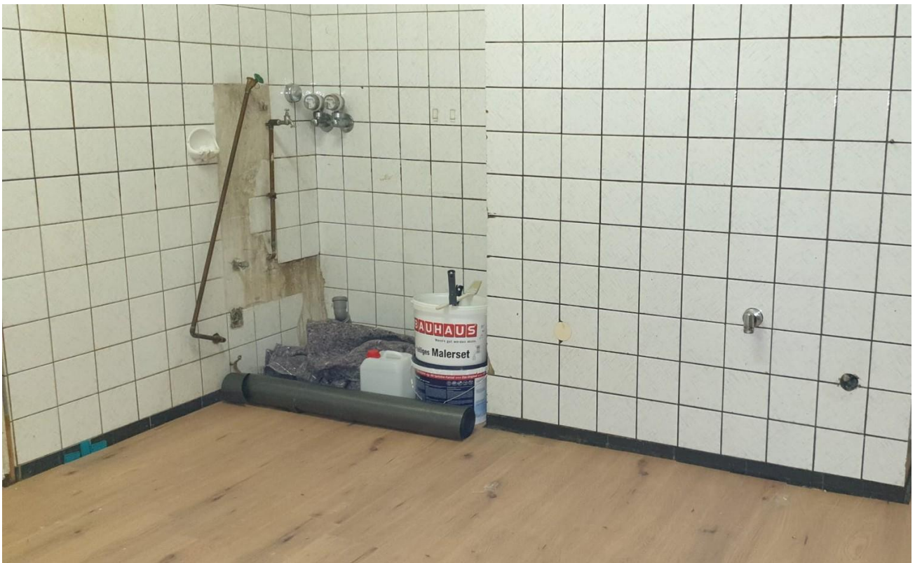
Zimmer oder Laden