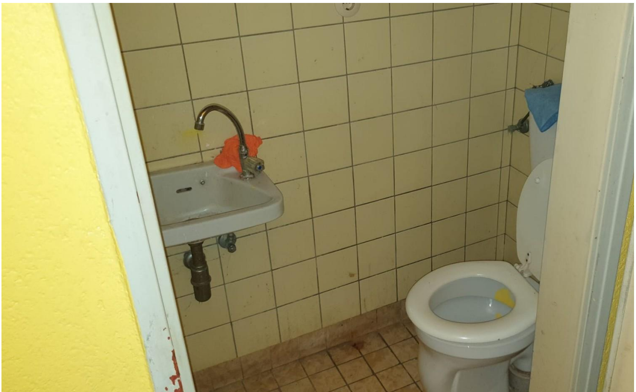
WC mit Waschbecken