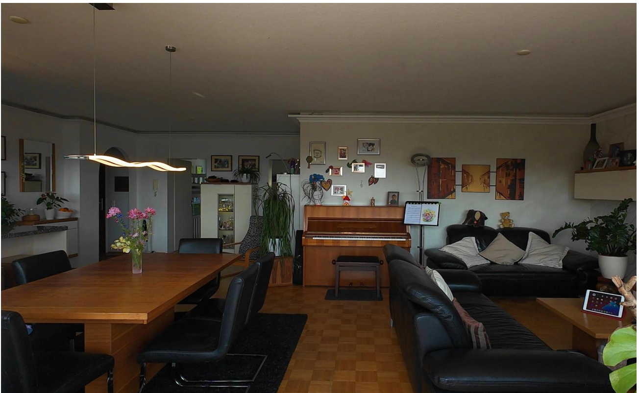
Zimmer 1. - Wohnbereich