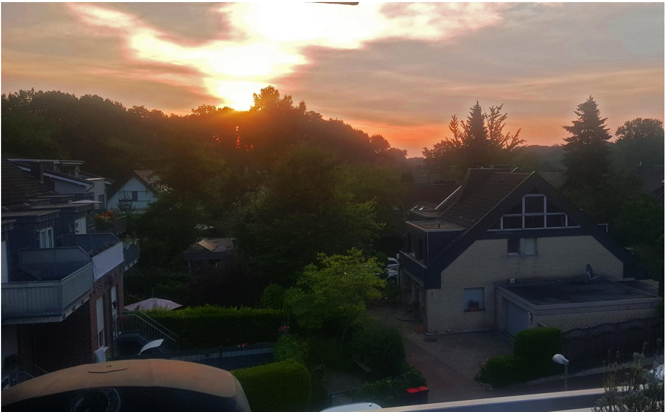
Die schönsten Sonnenaufgänge