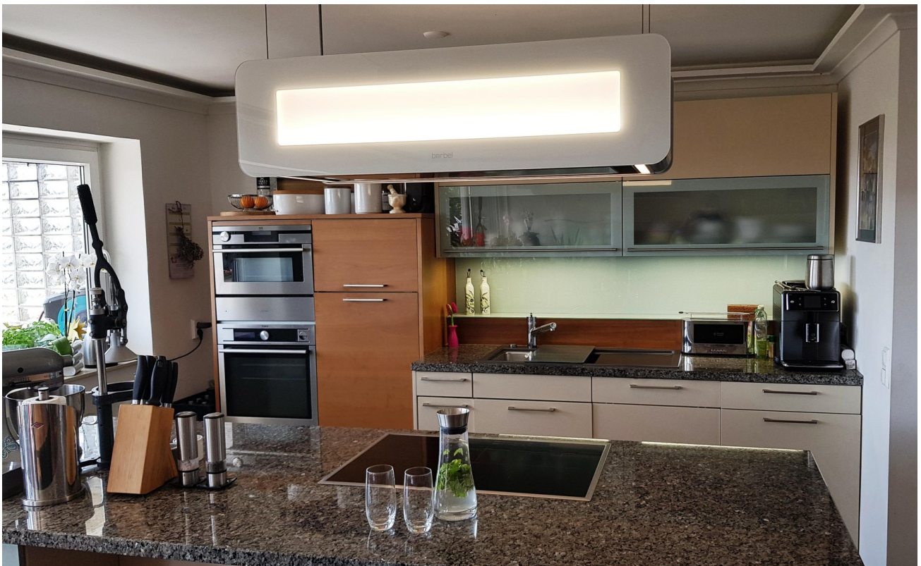
Top Ausstattung Berbel Skyline