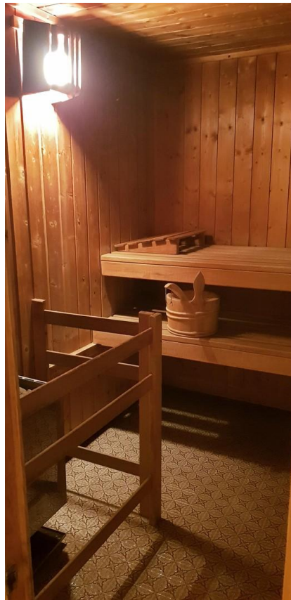
Platz für bis zu 6 Personen