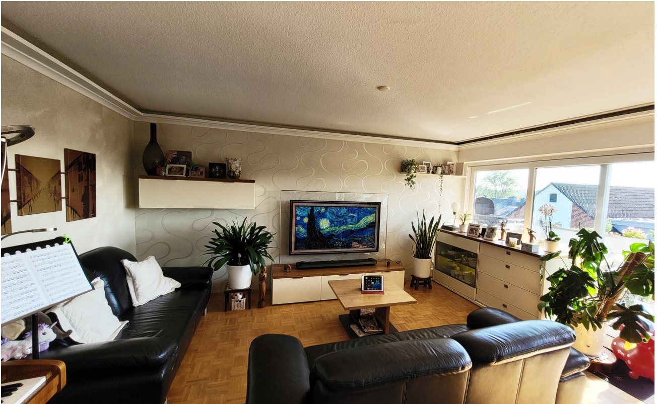
Zimmer 1. - Wohnbereich