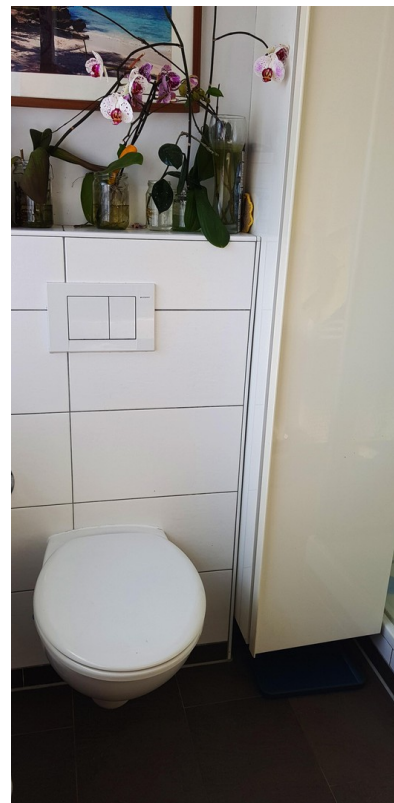
modernes Bad mit Hänge WC