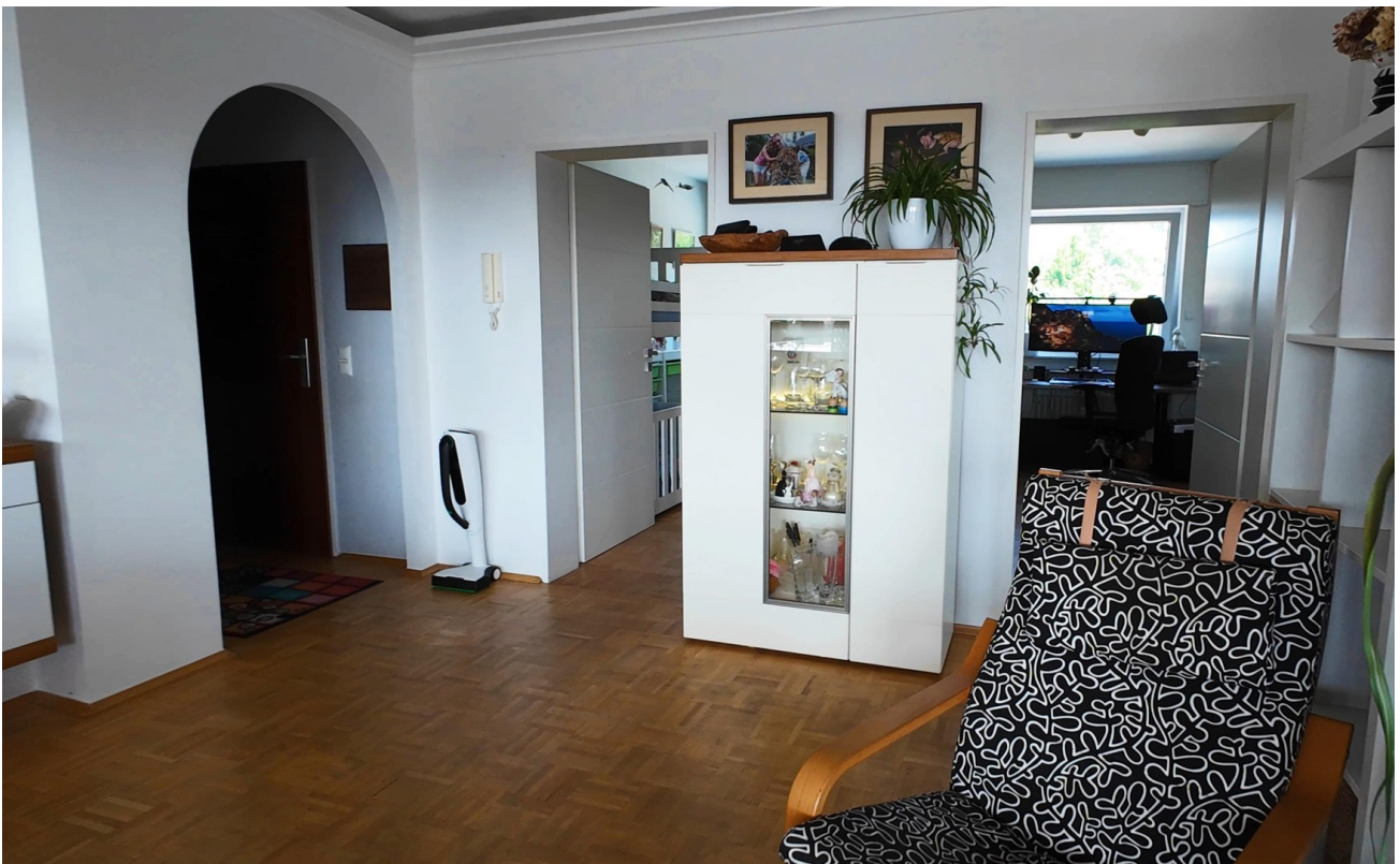
Großer heller Innenraum