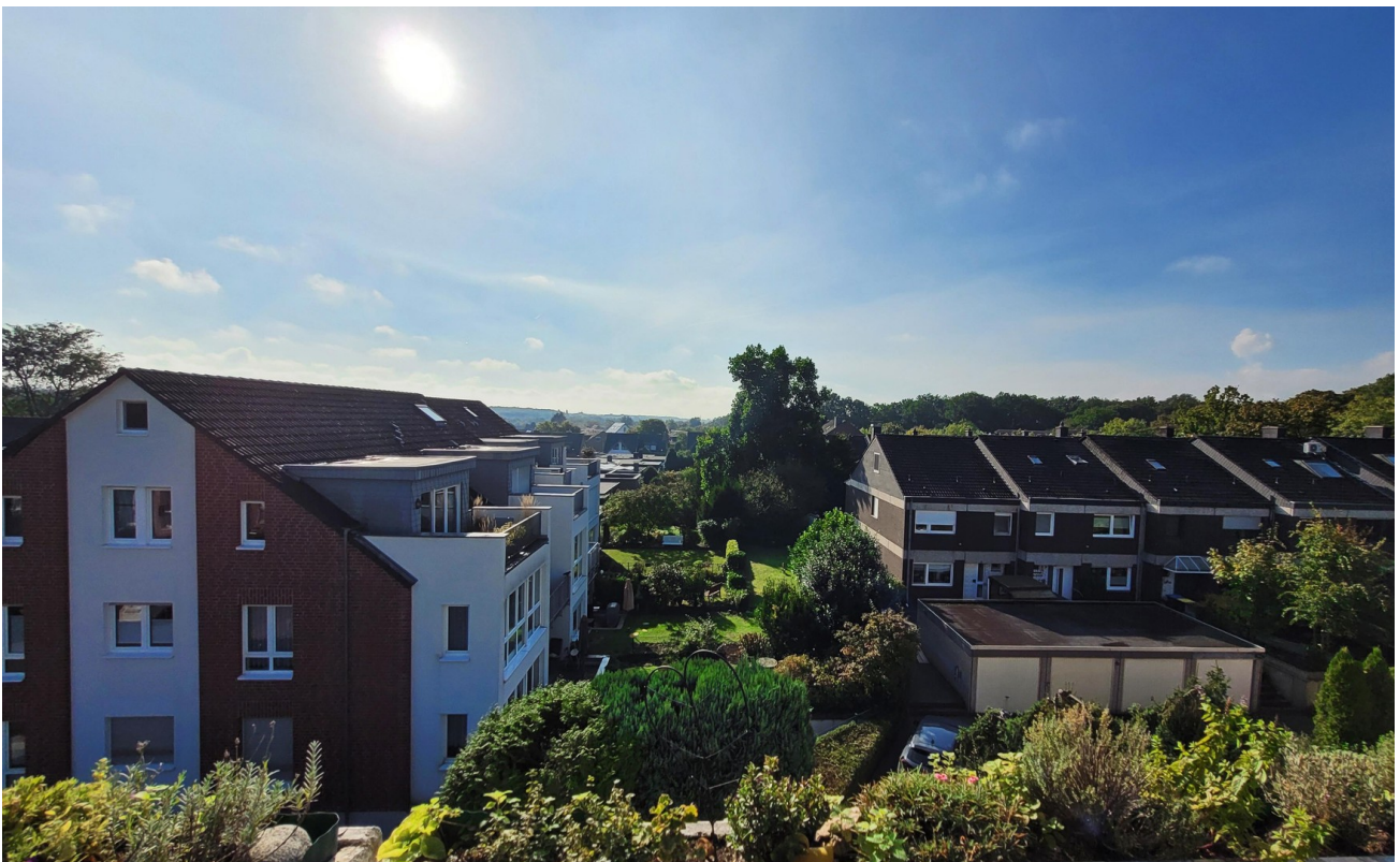
Sonne von morgens bis abends