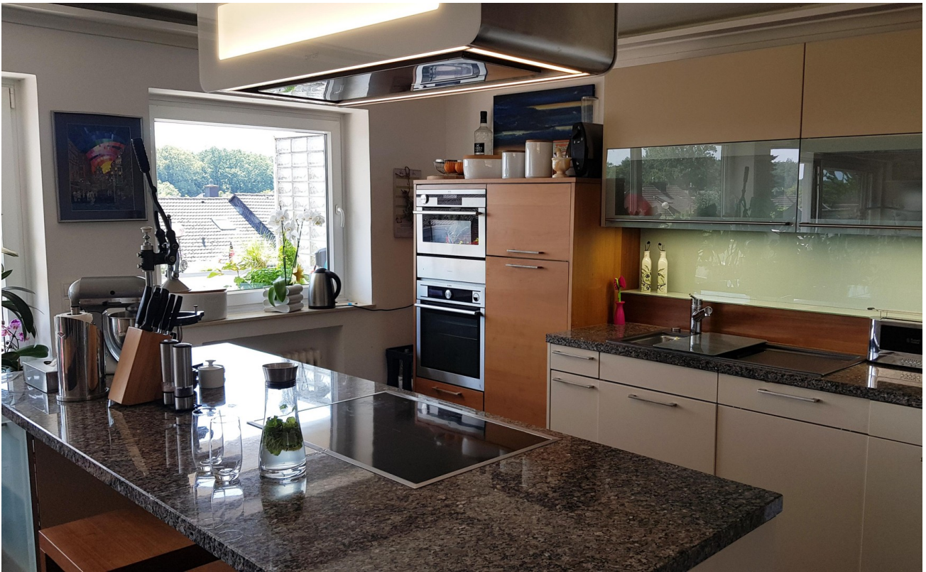
2 große Granitplatten, 2 Dampf