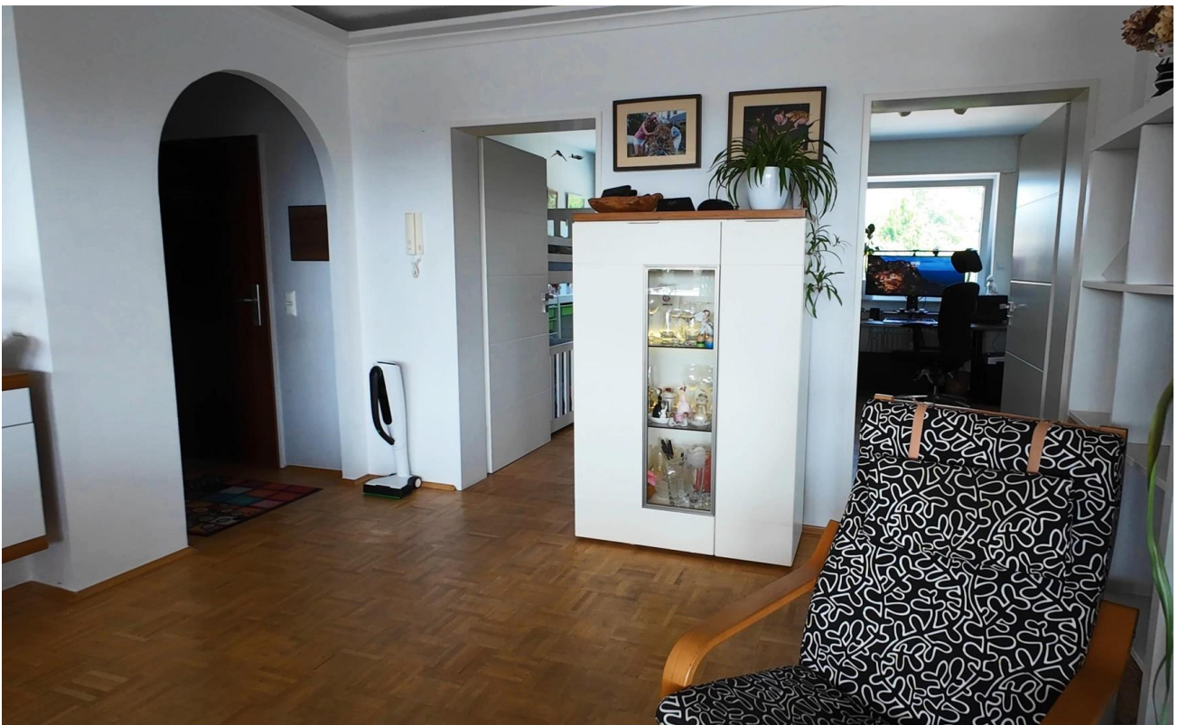
Großer heller Innenraum