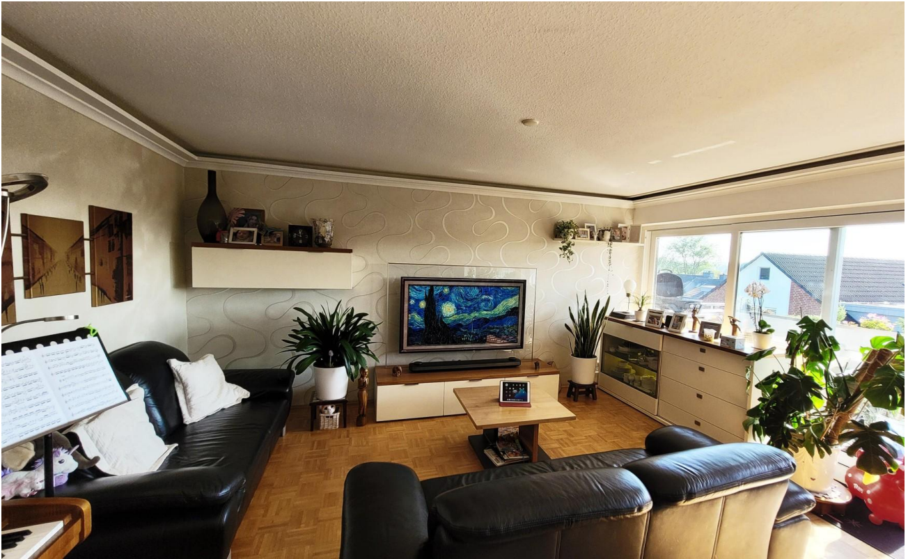
Zimmer 1. - Wohnbereich