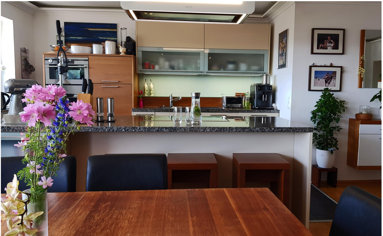
Luxus Designer Inselküche