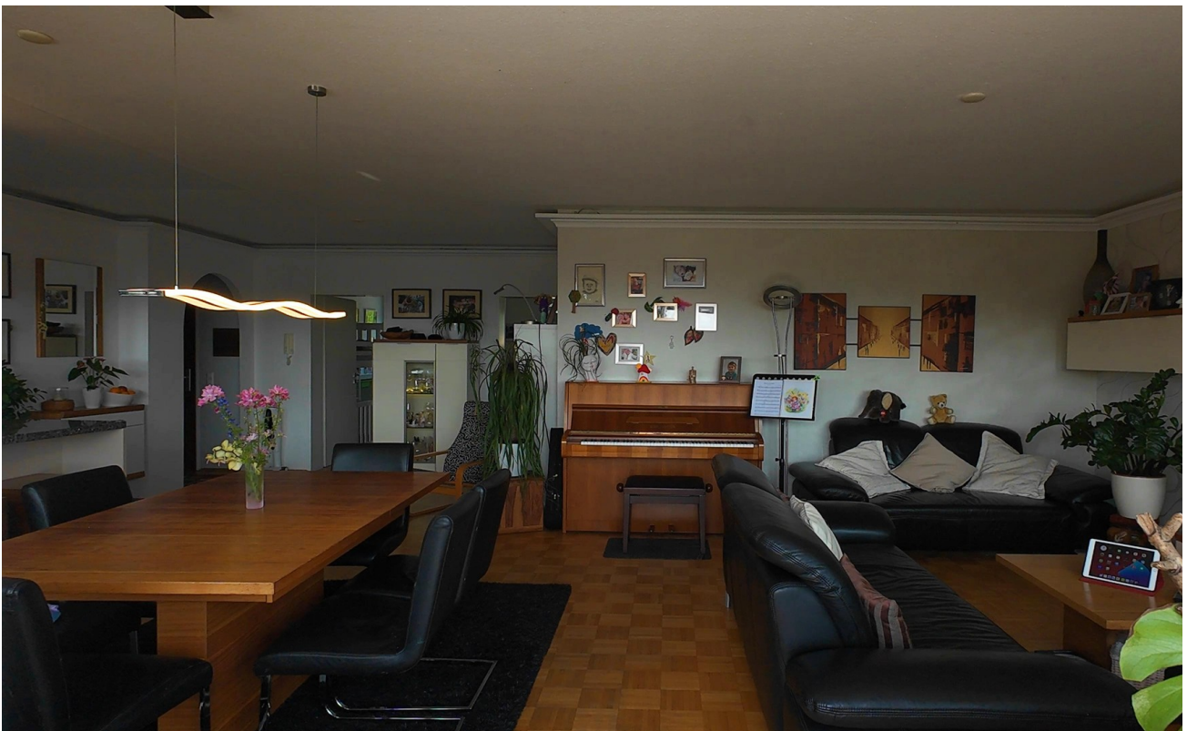
Zimmer 1. - Wohnbereich