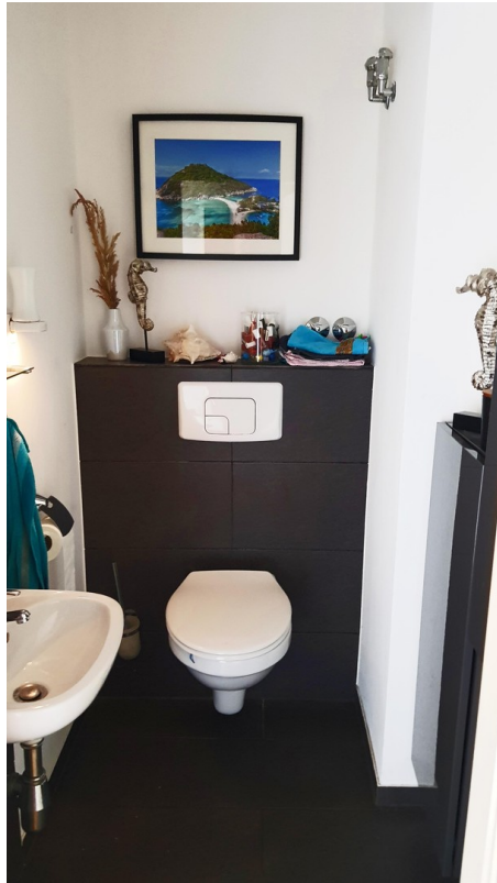
Bad 2. - modernes Gäste WC