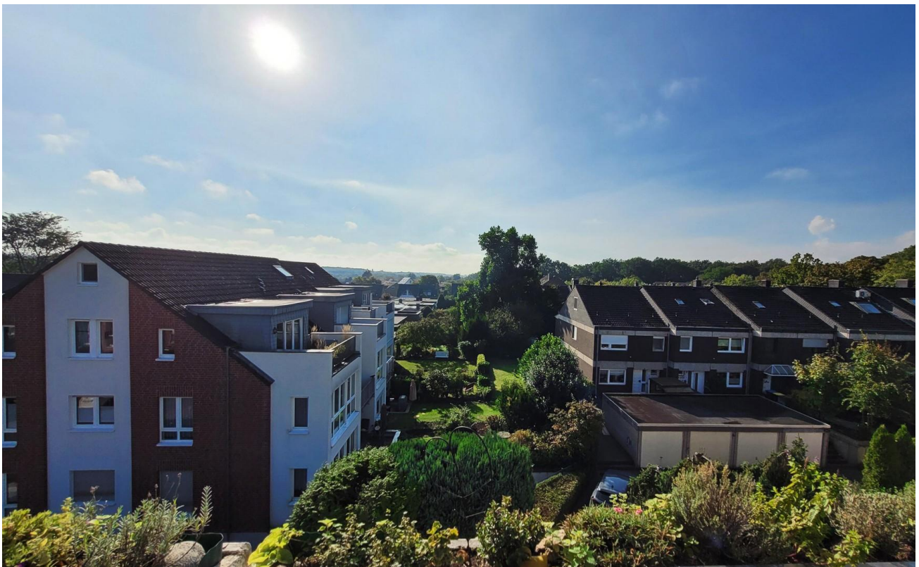
Sonne von morgens bis abends