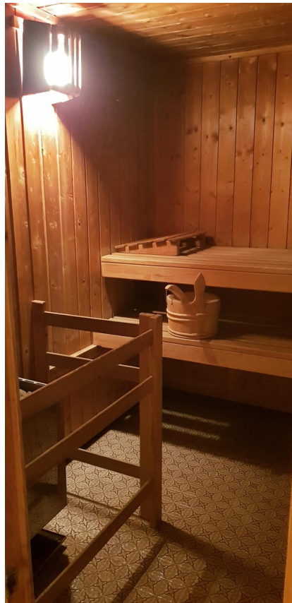
Platz für bis zu 6 Personen