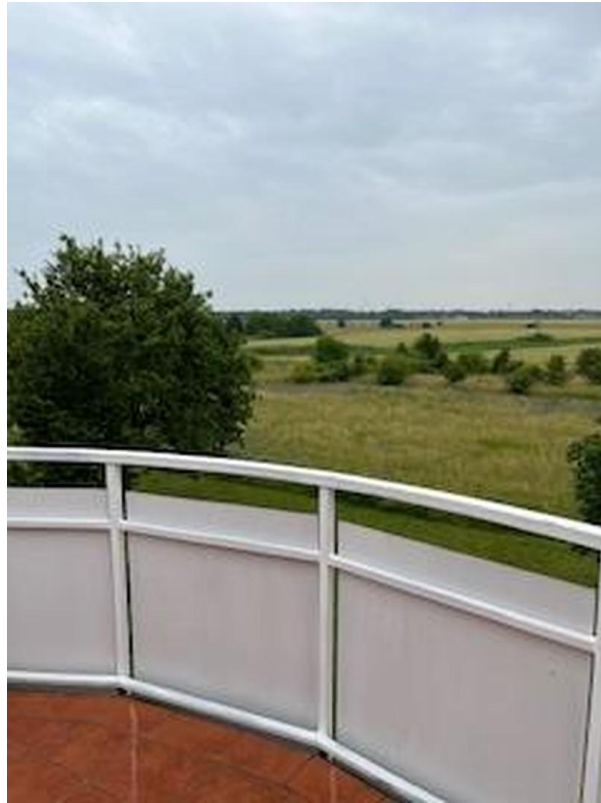
Blick vom Balkon ins Grüne