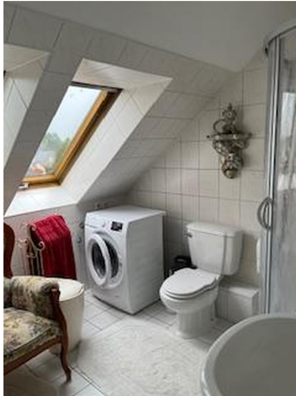
modernes Duschbad mit Fenster