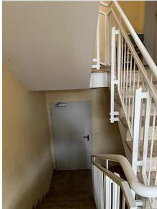
Zugang zur Tiefgarage