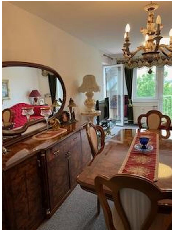
Wohnzimmer- Bild 1