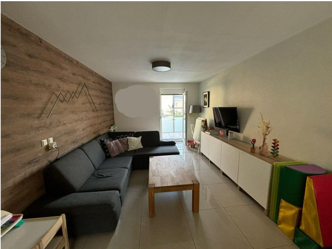
Blick aus Küche z Wohnbereich