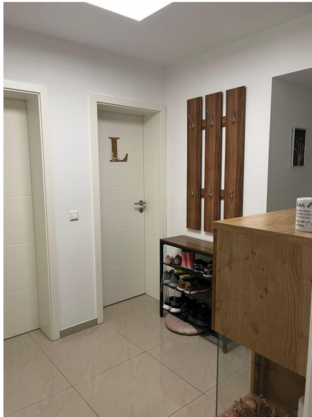
Blick in Flur aus Wohnzimmer