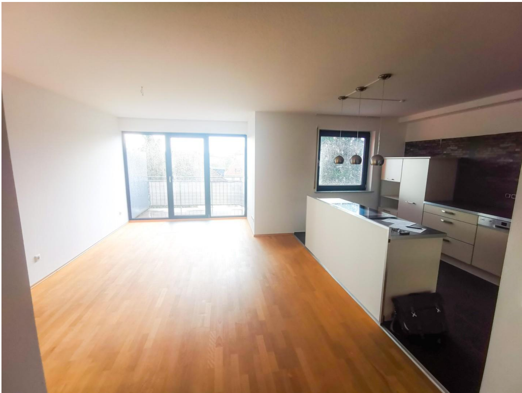
3.OG Esszimmer (leer)