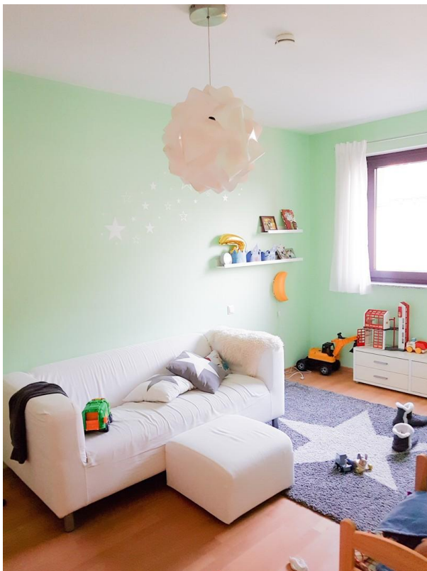
Erstes Kinderzimmer 30G