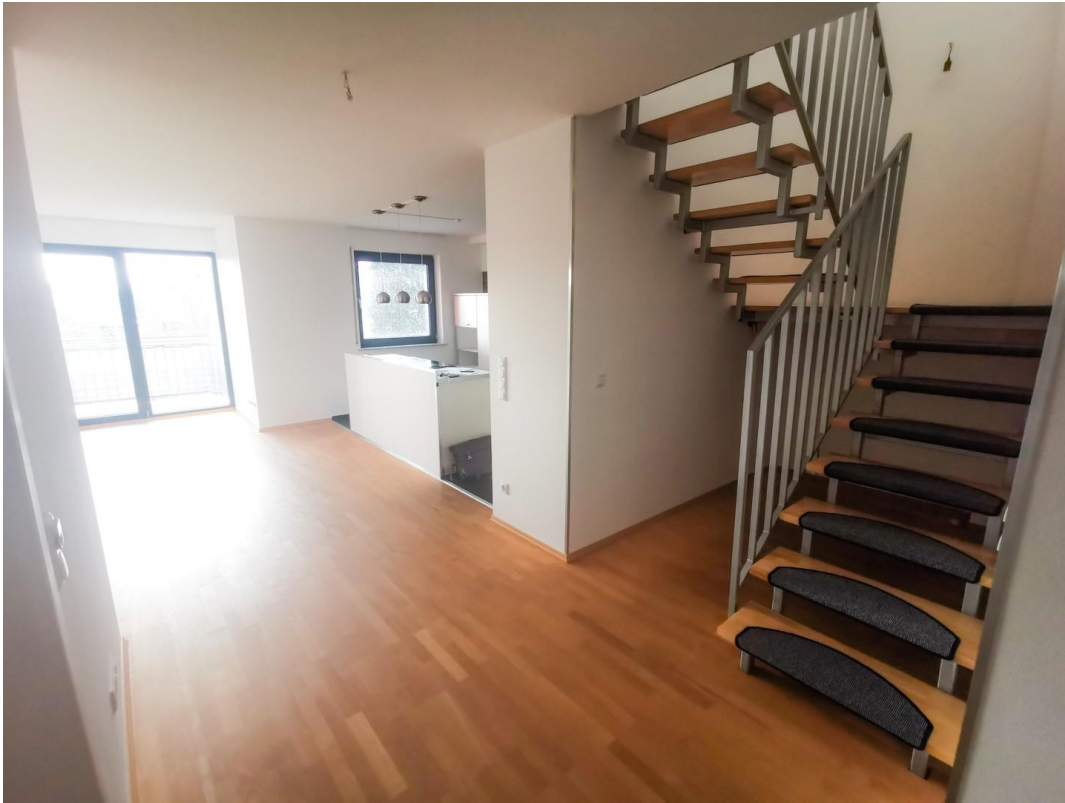
3.OG Flur (leer)