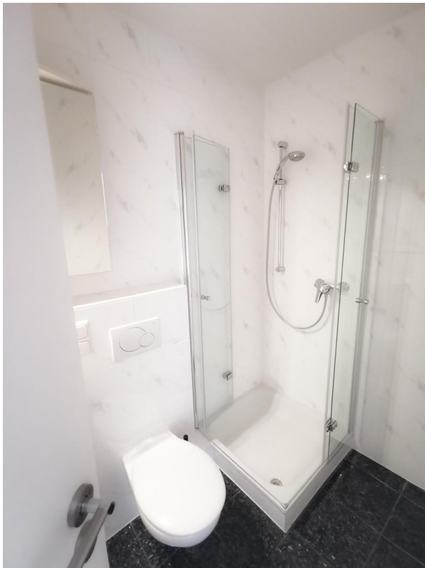
3.OG Bad (leer)