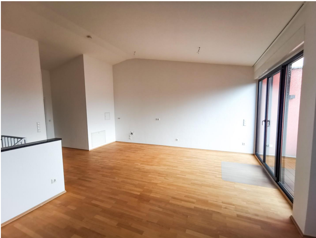
4.OG Wohnzimmer (leer)