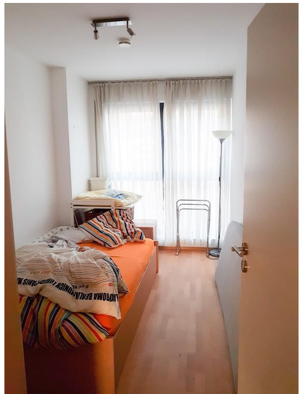
Zweites Kinderzimmer 30G