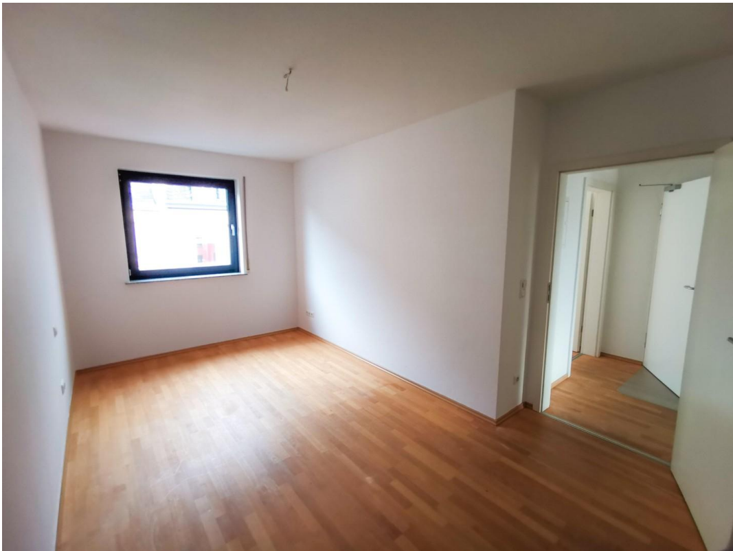
3.OG erstes Zimmer (leer)