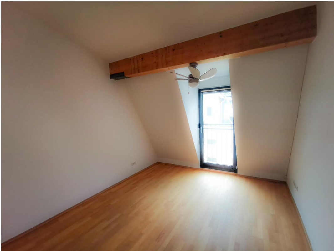
4.OG drittes Zimmer (leer)