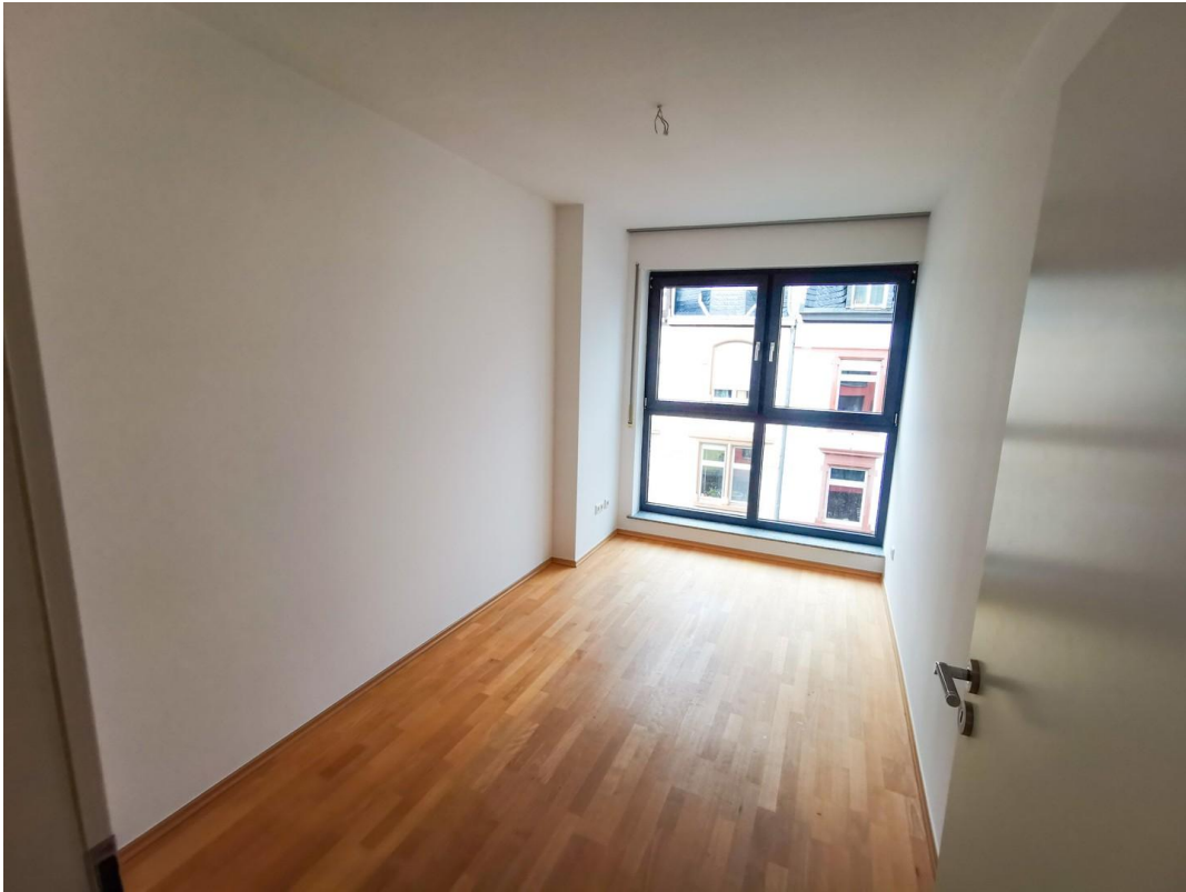
3.OG zweites Zimmer (leer)