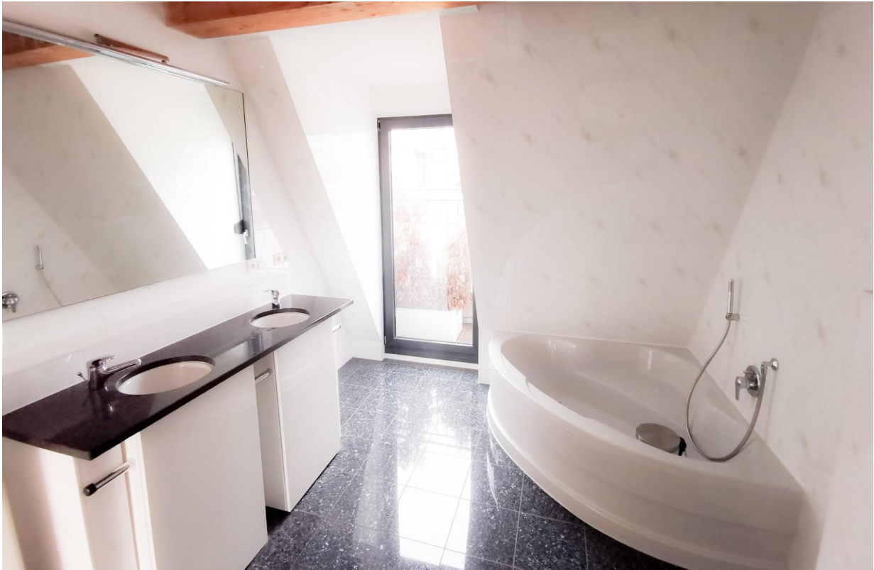
4.OG Bad (leer)