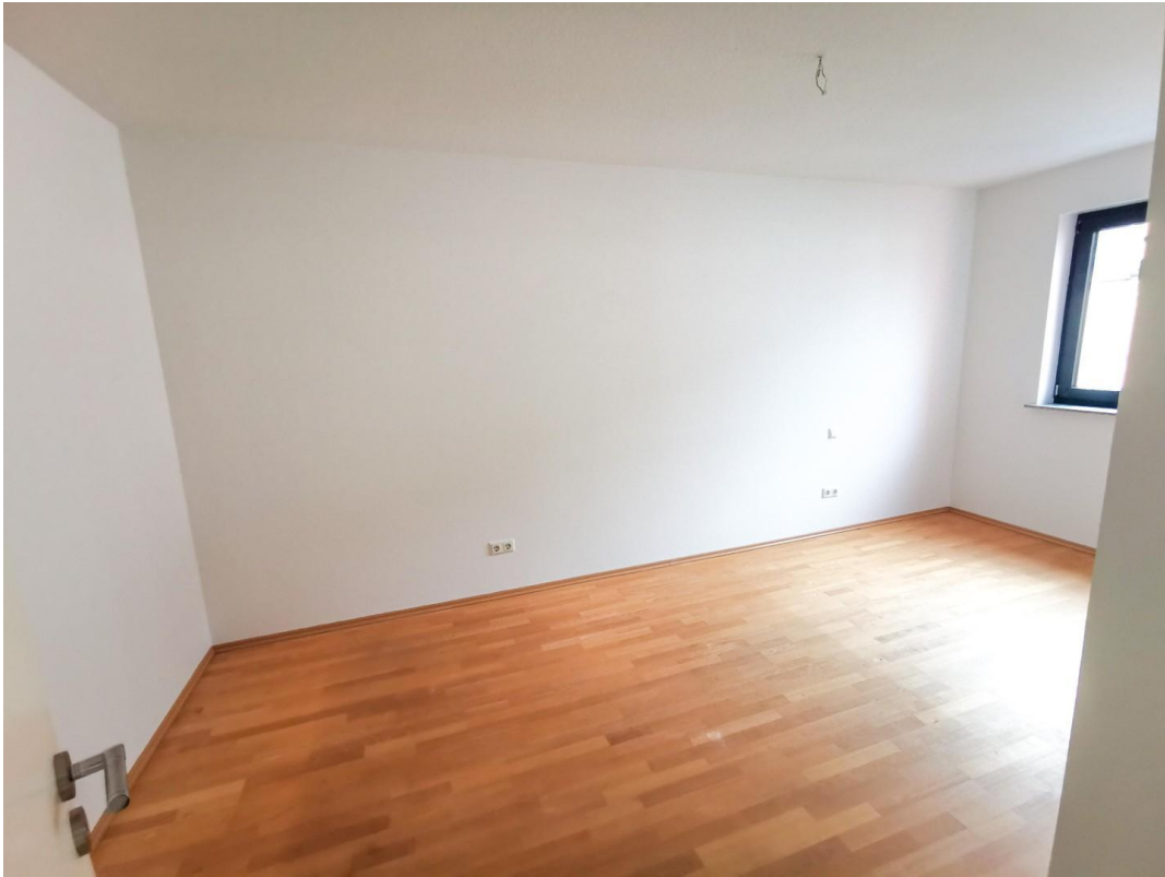
3.OG erstes Zimmer (leer)