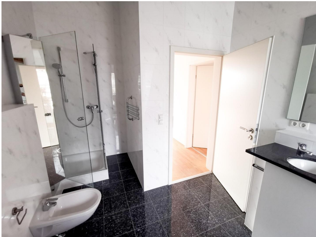
4.OG Bad (leer)