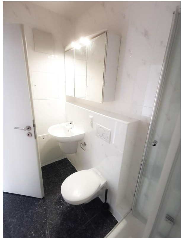
3.OG Bad (leer)