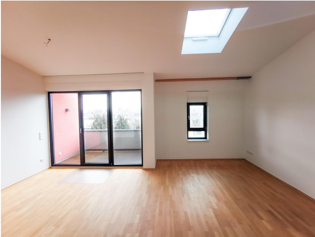
4.OG Wohnzimmer (leer)