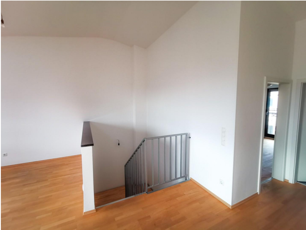
4.OG Treppe (leer)