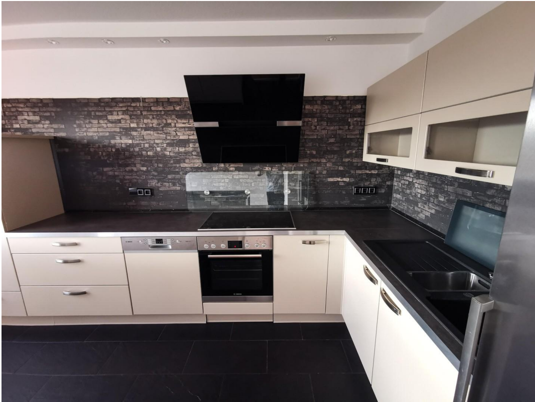
3.OG Küche (leer)