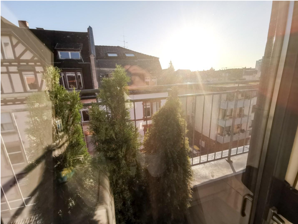
Blick aus Bad 4OG