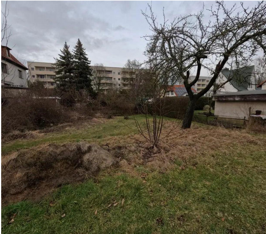
Hinterer Teil des Grundstücks