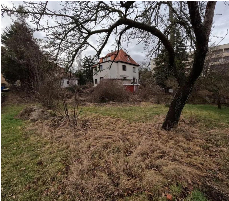
Hinterer Teil des Grundstücks