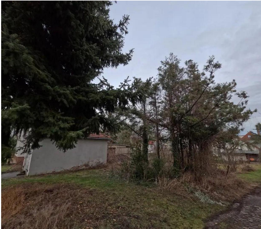
Blick vom Nachbargrundstück