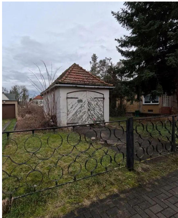
Garage Blick von der Strasse