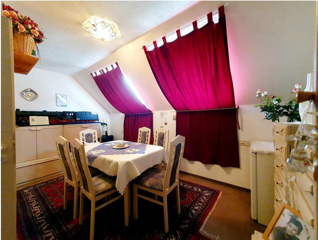
2. Esszimmer /Kinderz. möglich