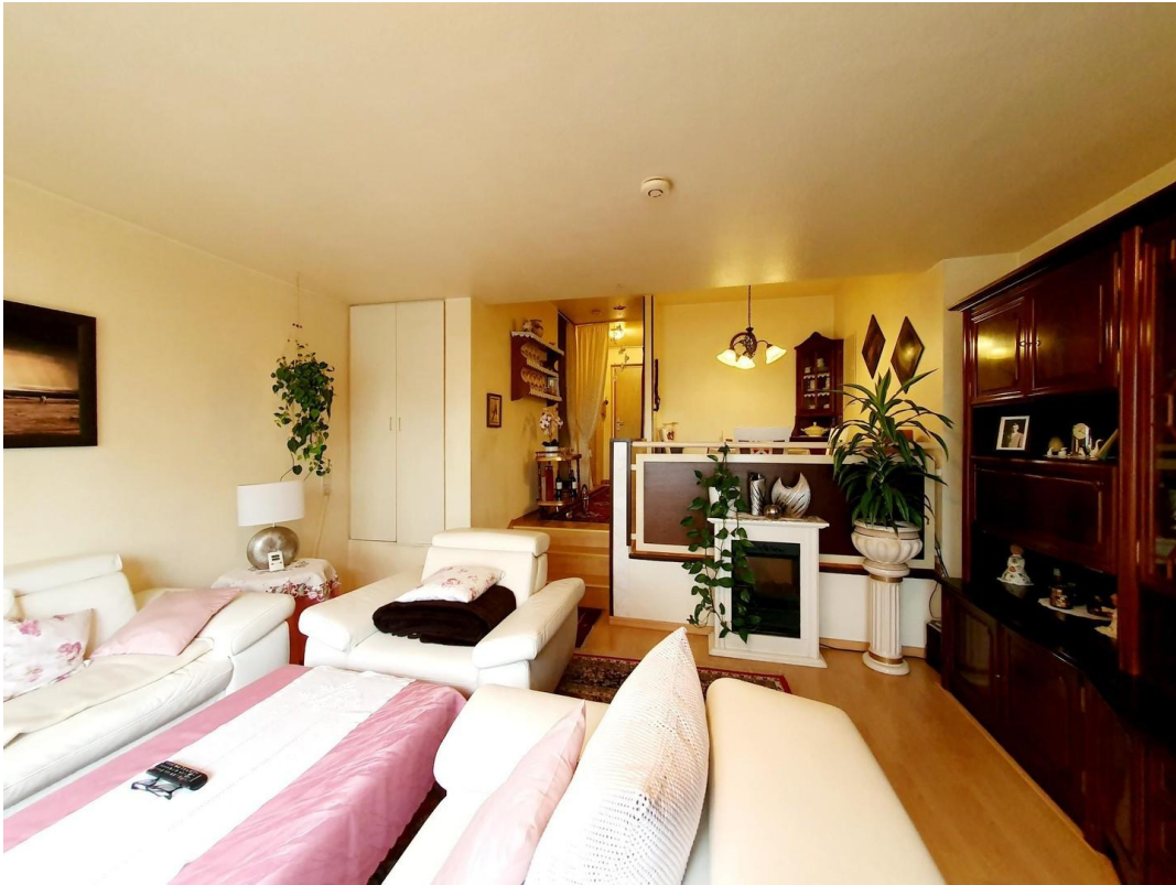
offener Wohn- und Essbereich