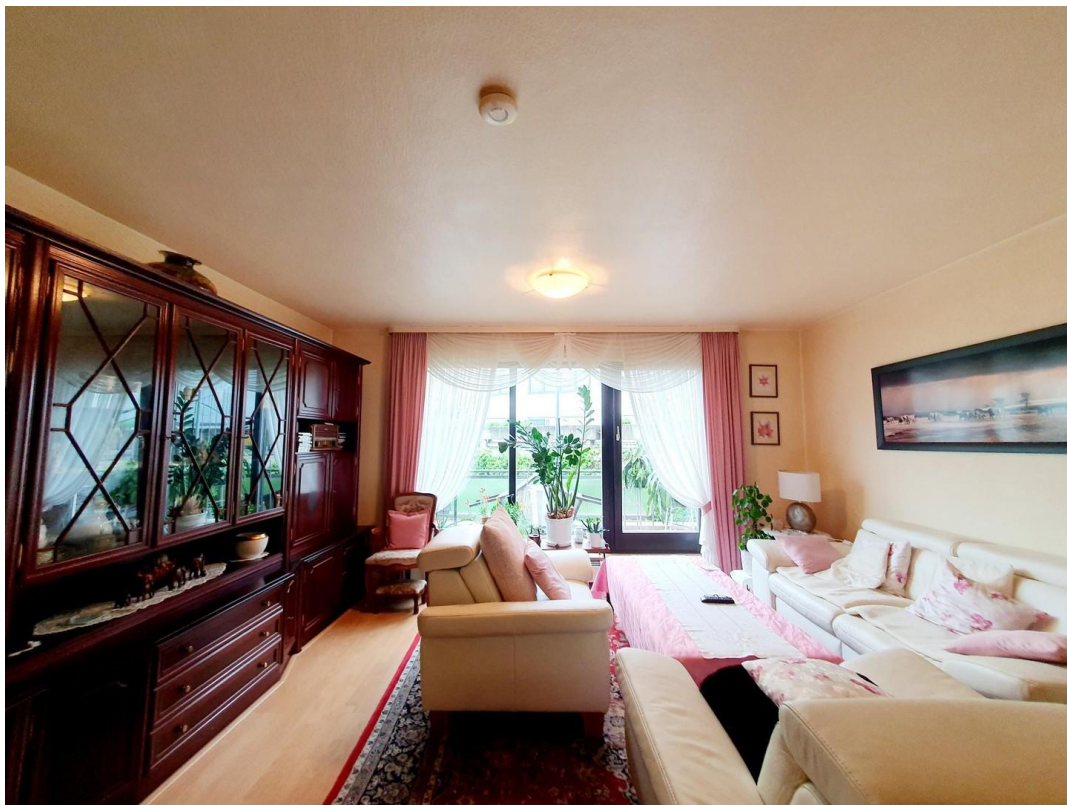
offener Wohn- und Essbereich