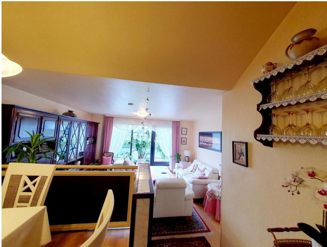
offener Wohn- und Essbereich