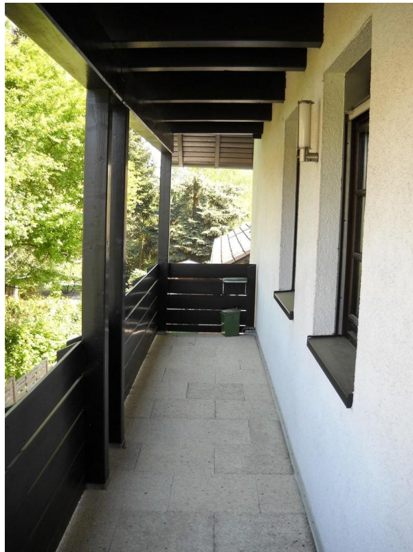
Balkon lang seitl.