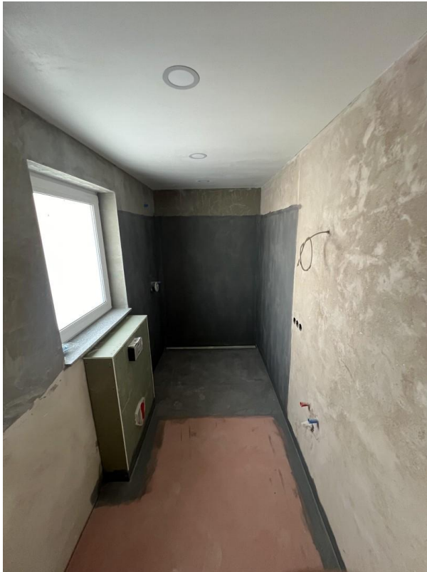
Gäste Bad EG