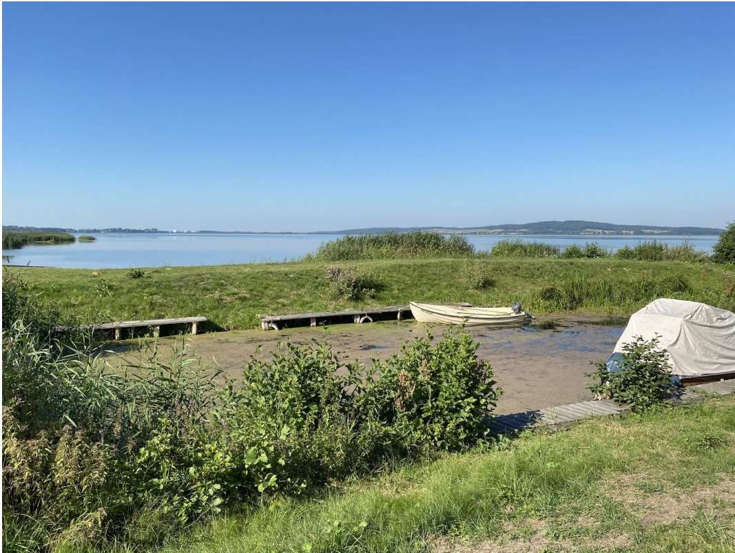
See in unmittelbarer Nähe