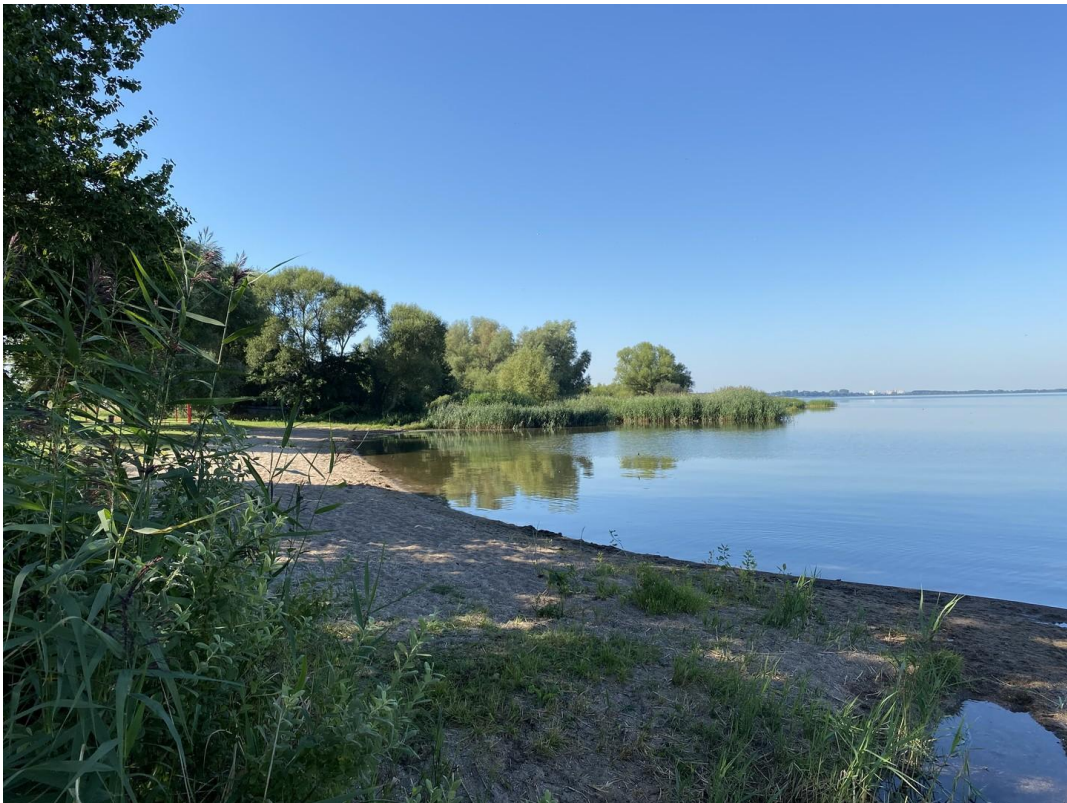
See mit Sandstrand