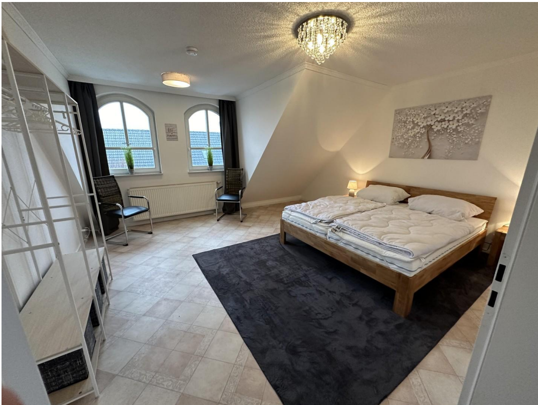
Schlafzimmer 1 OG