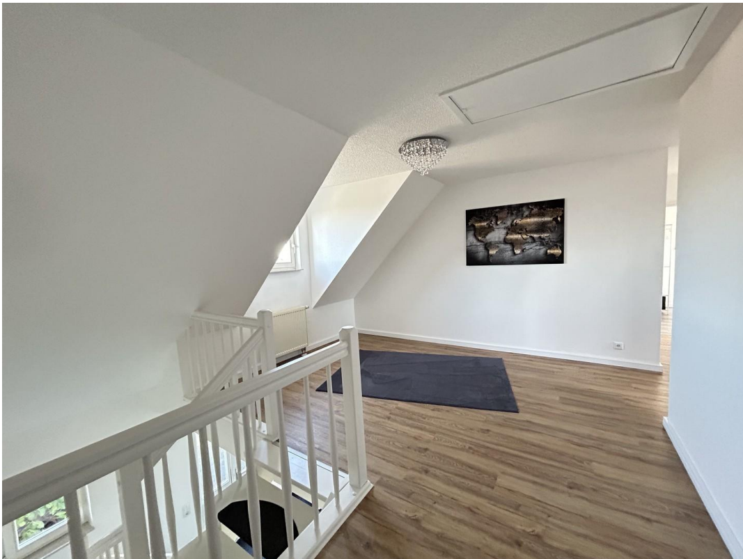
Studio, Flur OG