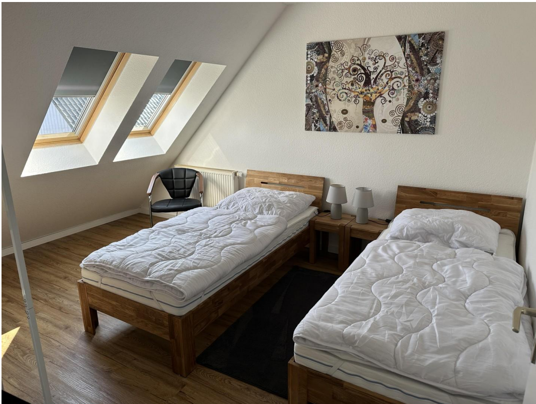
Schlafzimmer 3 OG