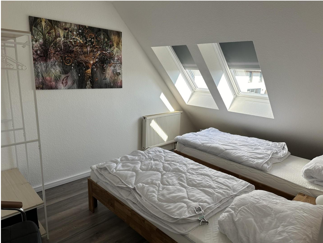
Schlafzimmer 2 OG