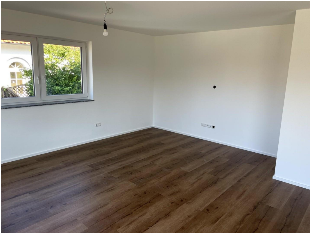
Wohnen OG 2