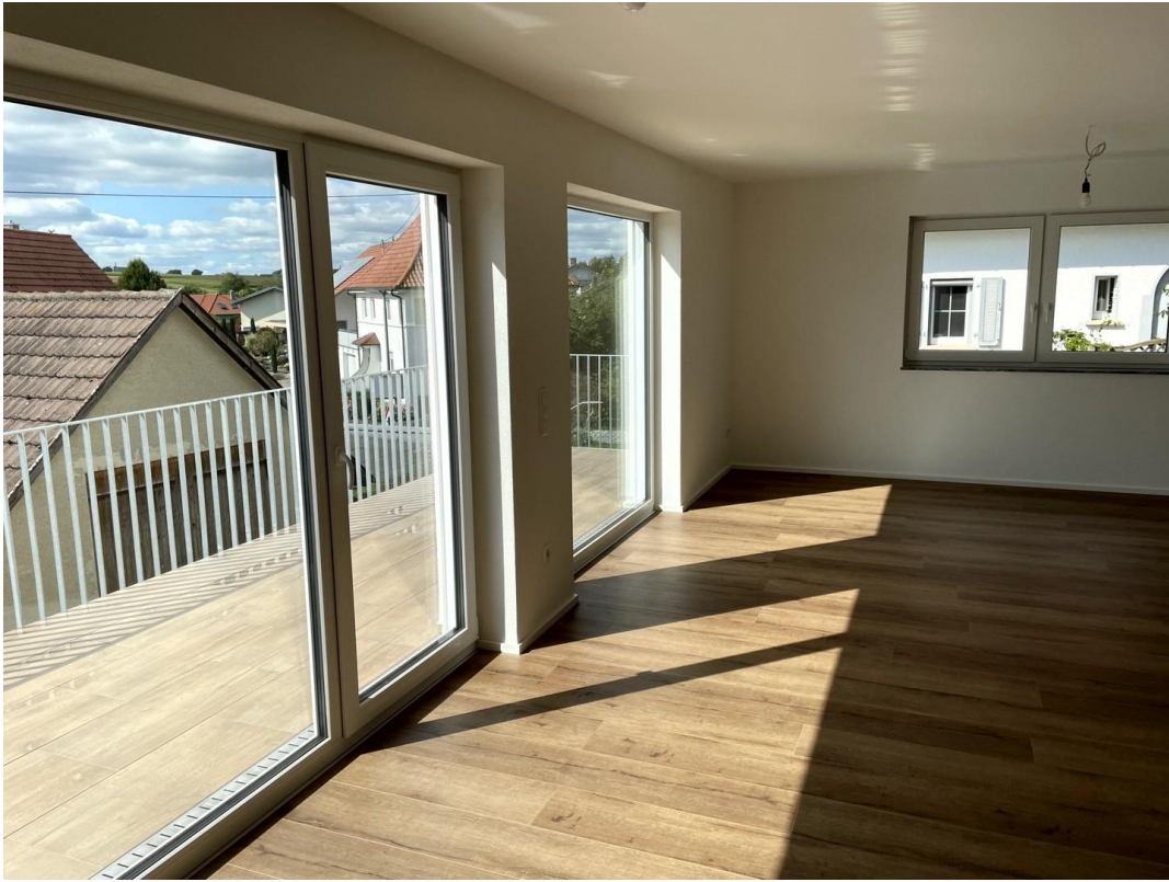
Wohnen OG 1