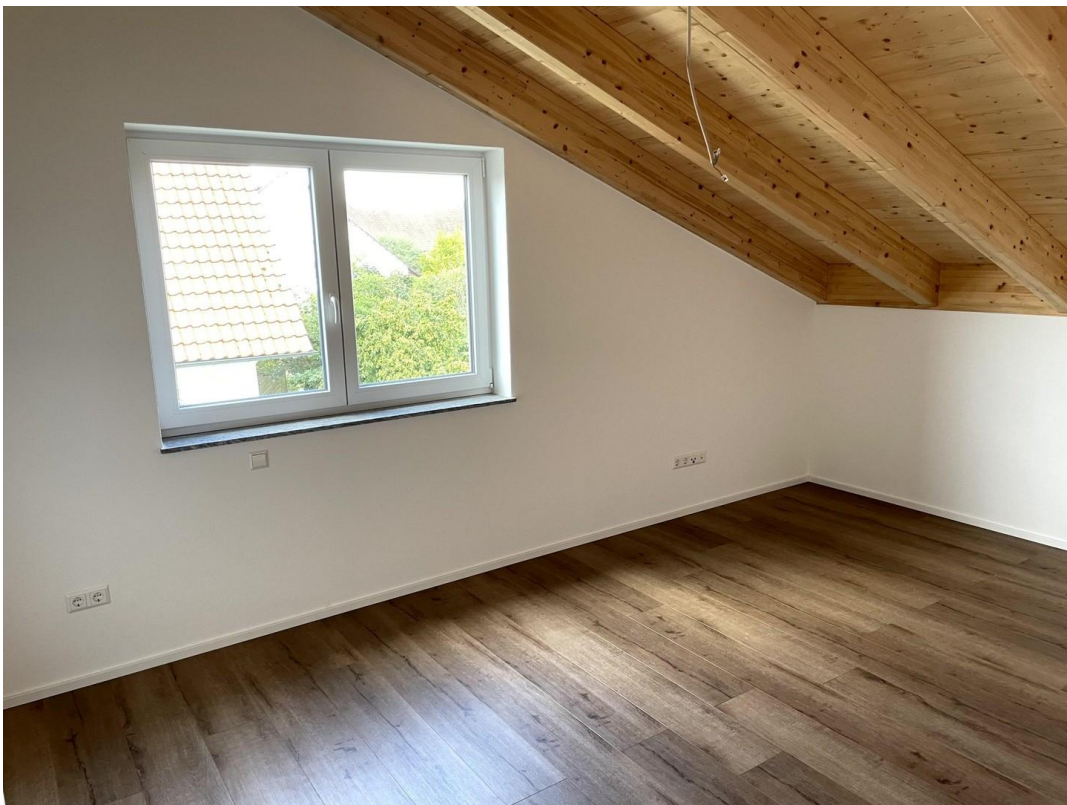
Kind 1 DG