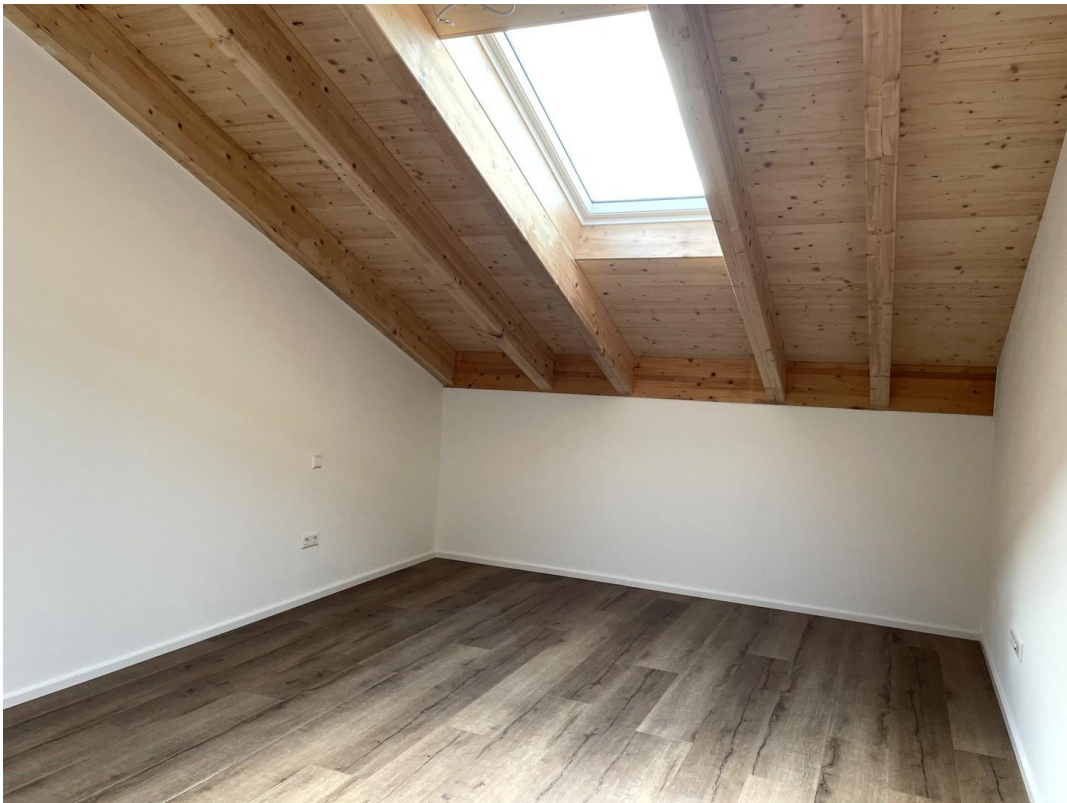
Kind 3 DG