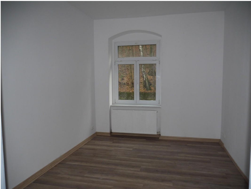
Kind oder Arbeiten