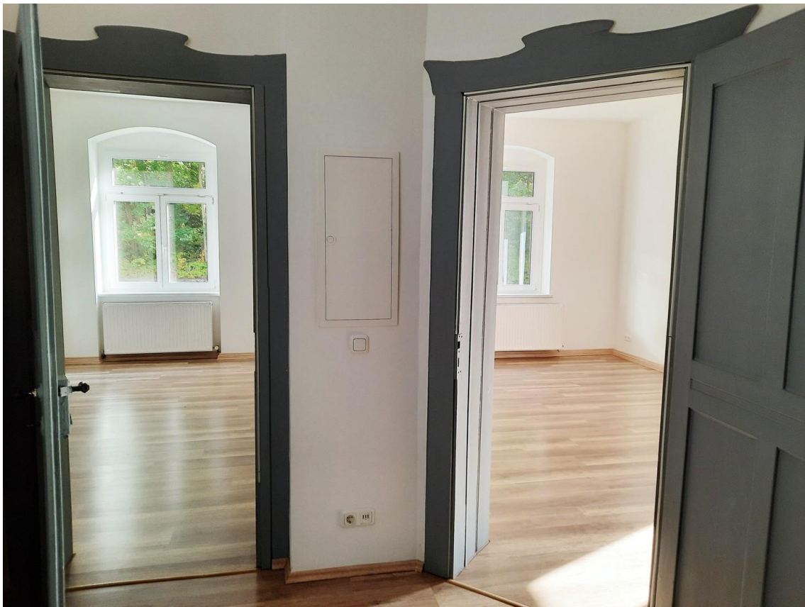
Blick in Wohnraum