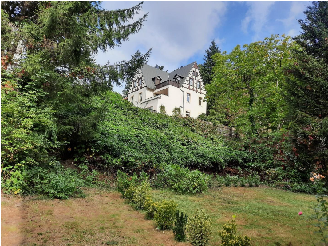
Blick aus Schlafzimmer