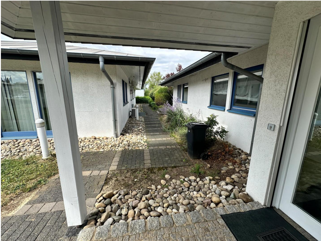
Weg Eingang / Stellplätze