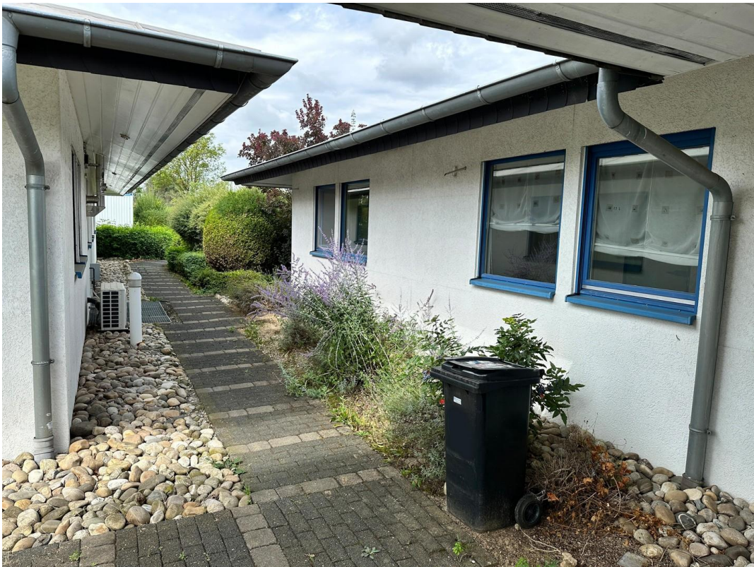
Weg Eingang / Stellplätze