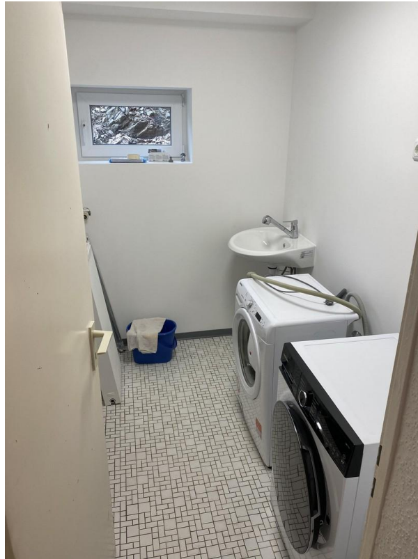
Waschkeller und Abstellraum