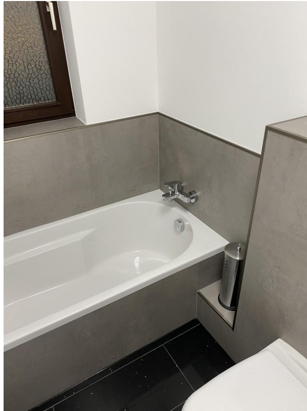
Bad mit Wanne EG