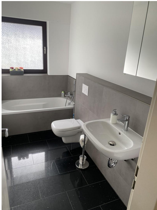
Bad mit Wanne EG