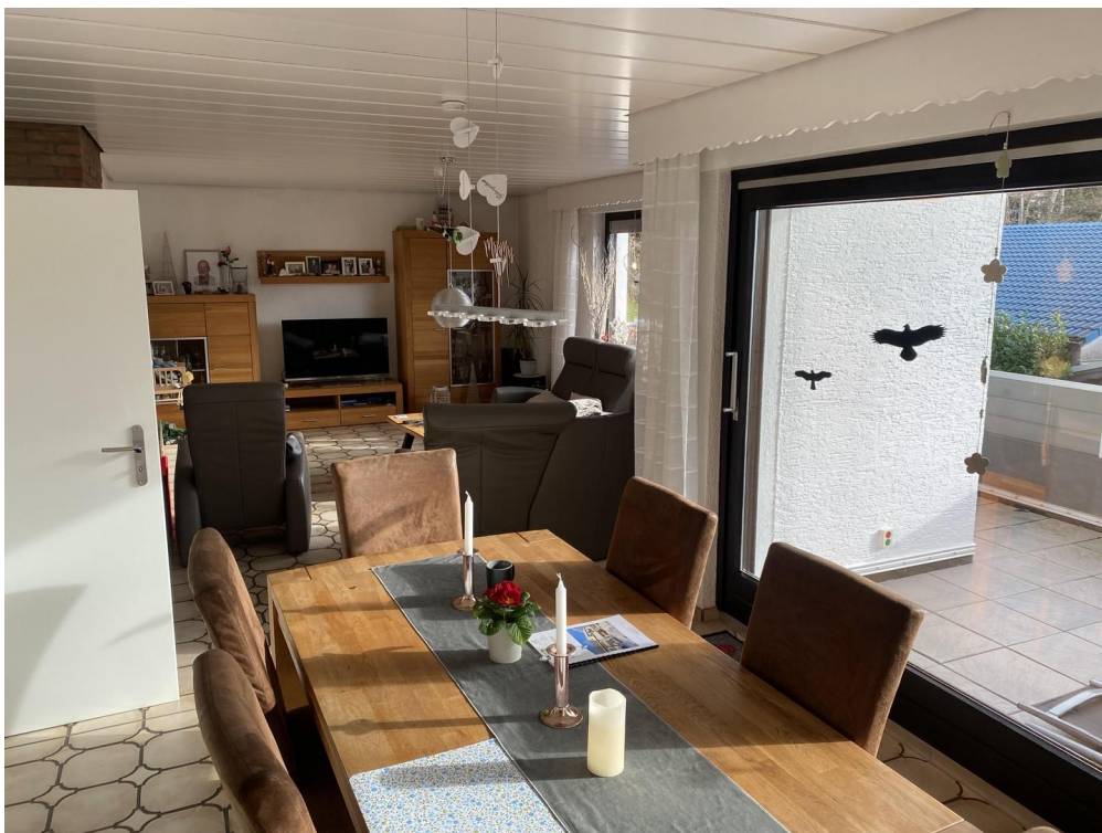
Wohn/Esszimmer 1. OG