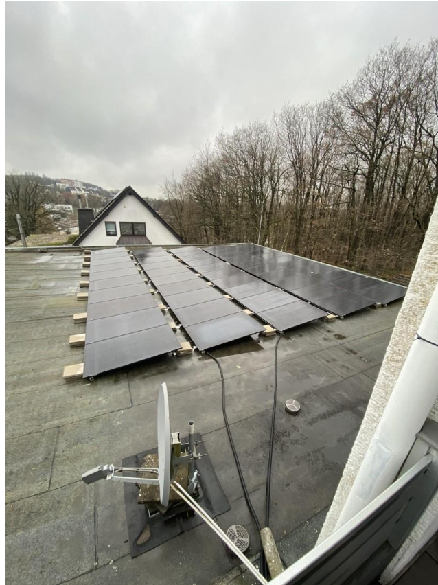
20kw Pv Anlage mit Speicher