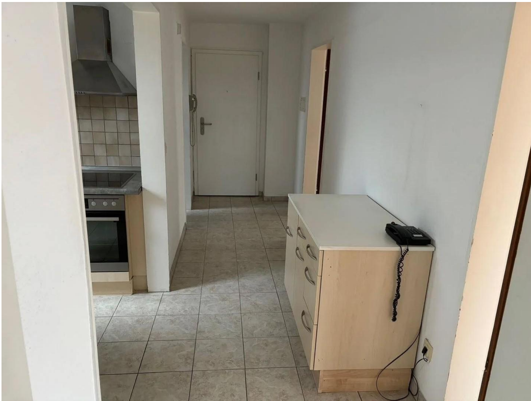
Flur - alte Bilder