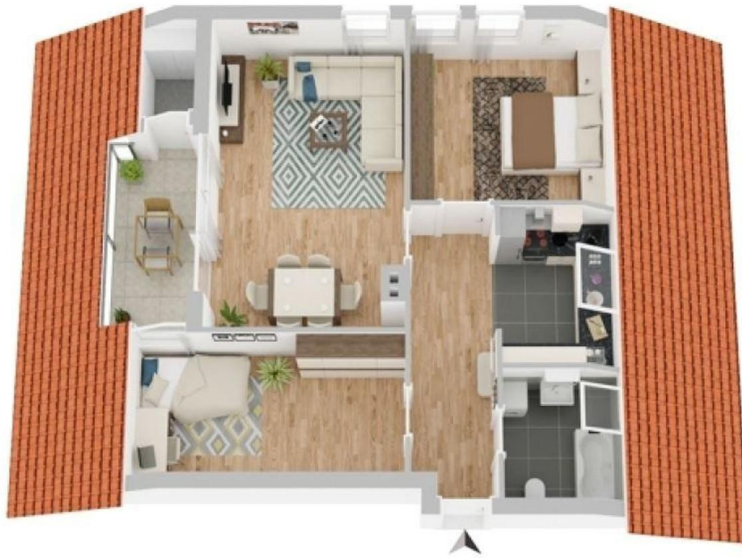
Grundriss (Ausstattung und Möblierung nur beispielhaft)