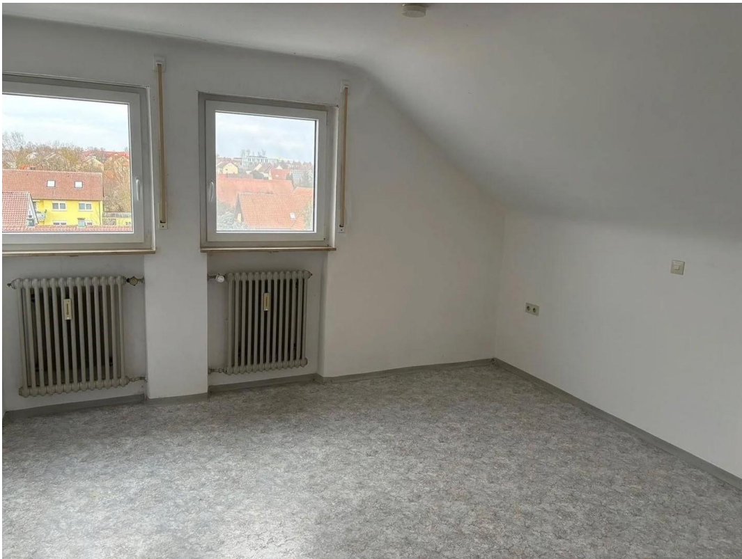
Schlafzimmer - alte Bilder