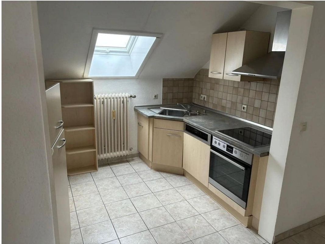
Küche - alte Bilder vor Renovi