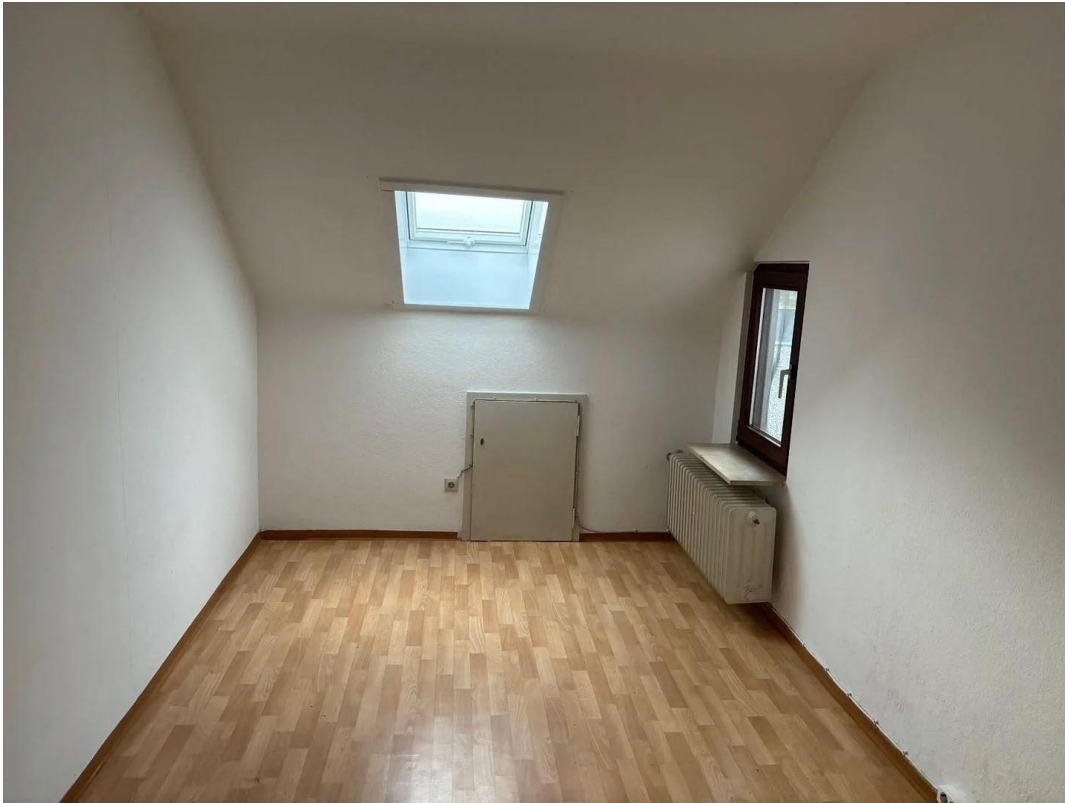
Kinderzimmer - alte Bilder