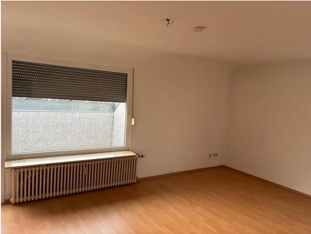
Wohnzimmer - alte Bilder vor R