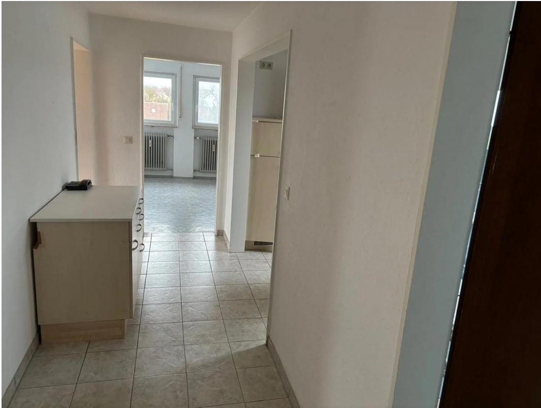
Flur - alte Bilder