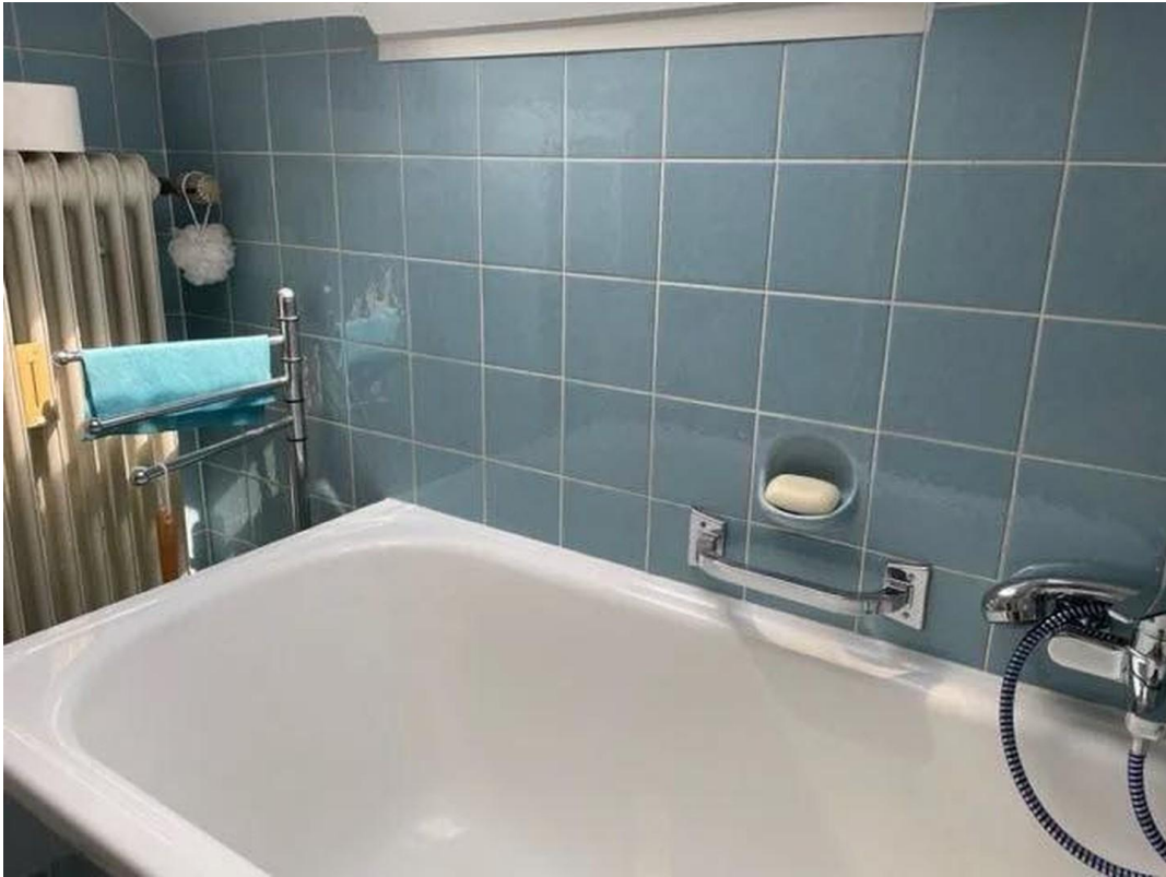
Bad - alte Bilder vor Renovier