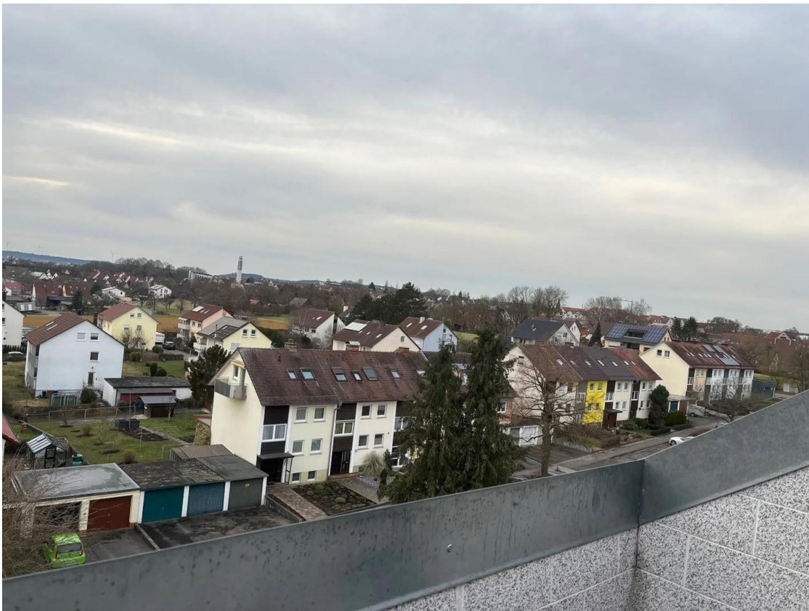
Balkon - alte Bilder vor Reno