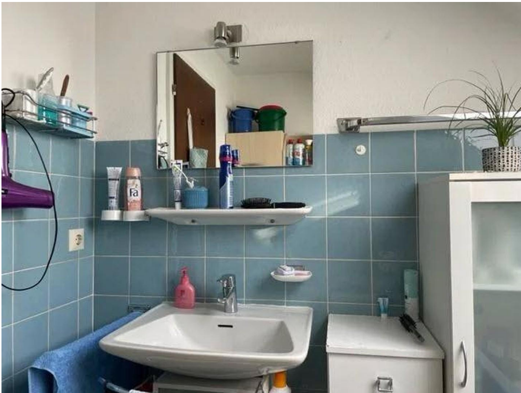
Bad - alte Bilder vor Renovier