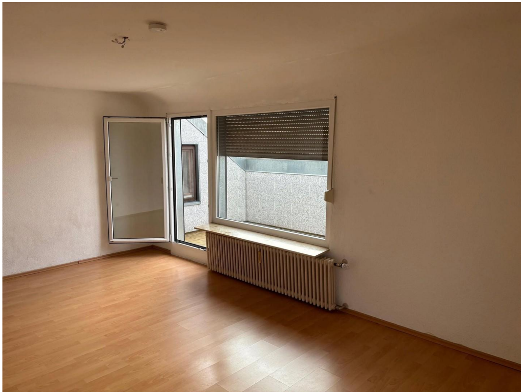
Wohnzimmer - alte Bilder vor R