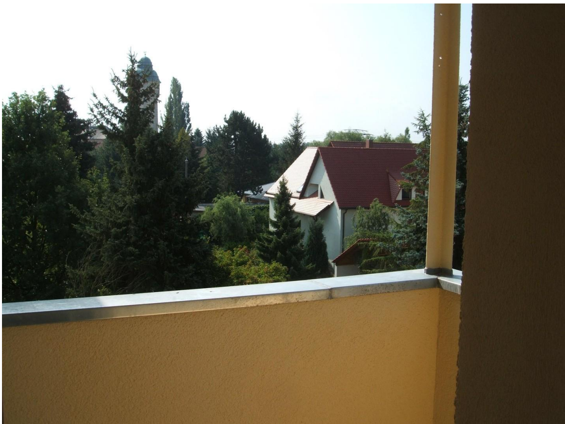
Blick vom Balkon Leipzig Süd