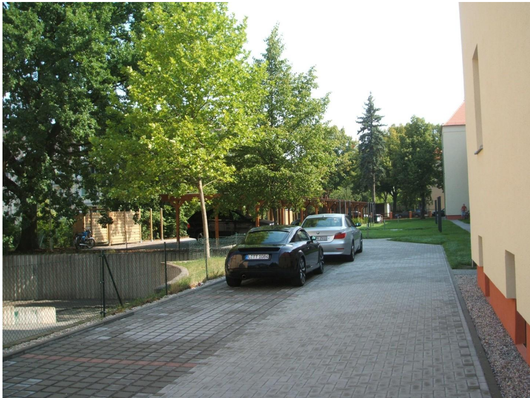
Hof PKW Stellplätze