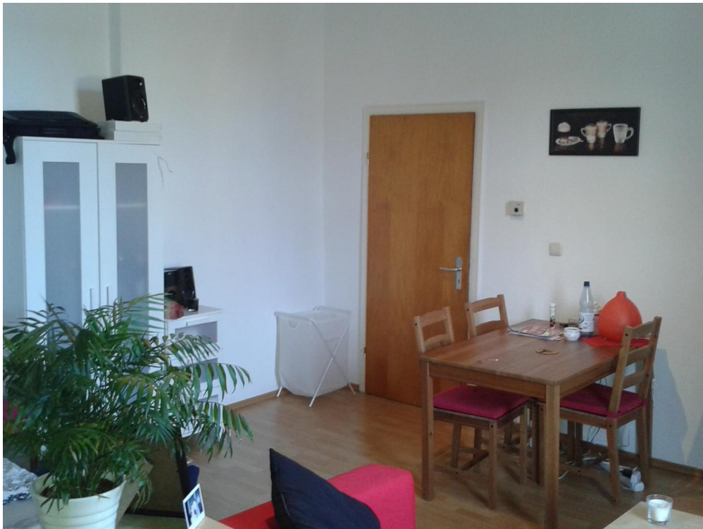
Essecke oder PC Arbeitsplatz