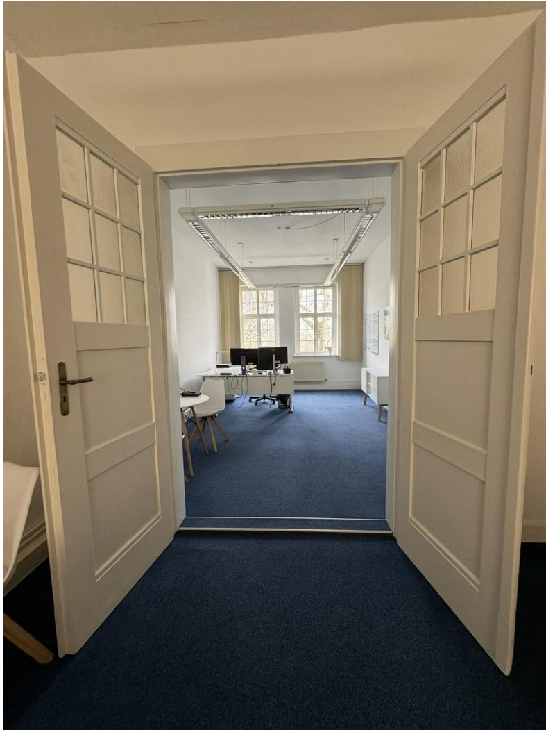
Geöffnete Flügeltür zwischen 2