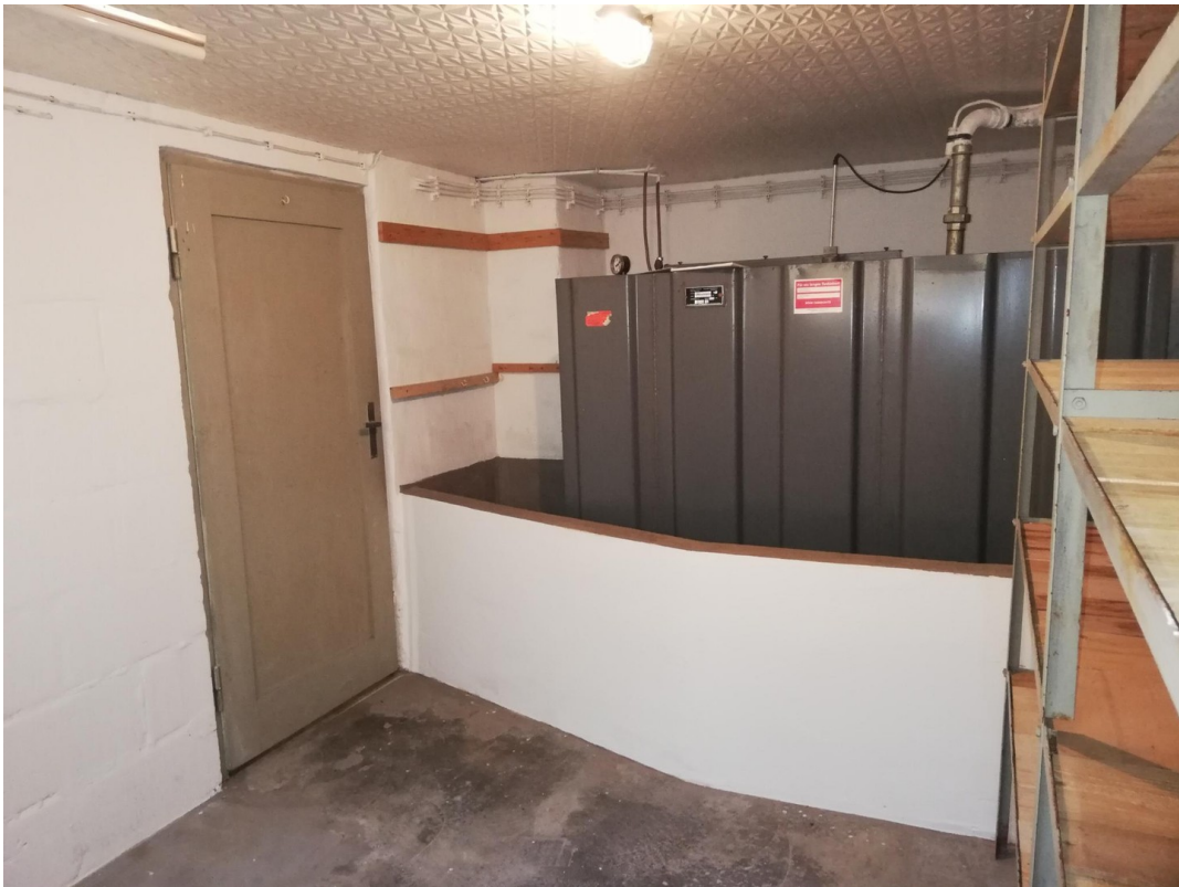
Öltank im Keller