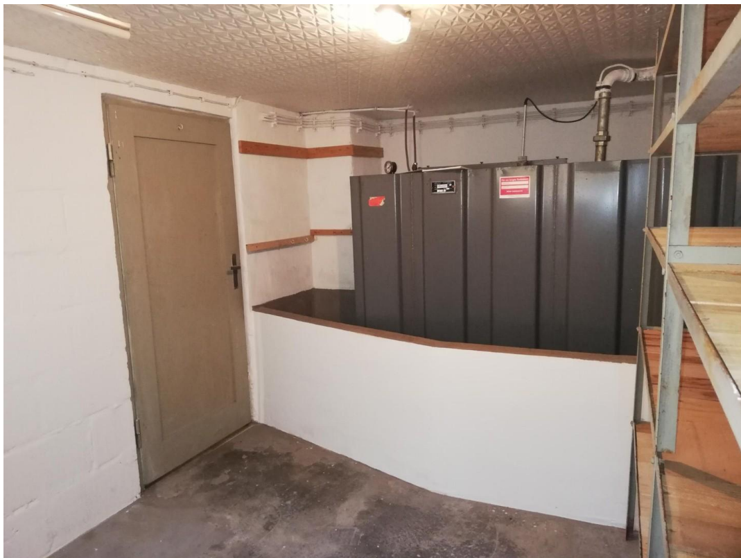
Öltank im Keller