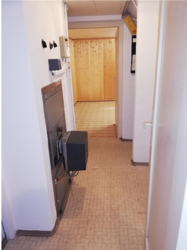
Kellerflur mit Heizung