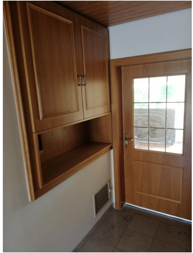
Flur mit Einbauschränk