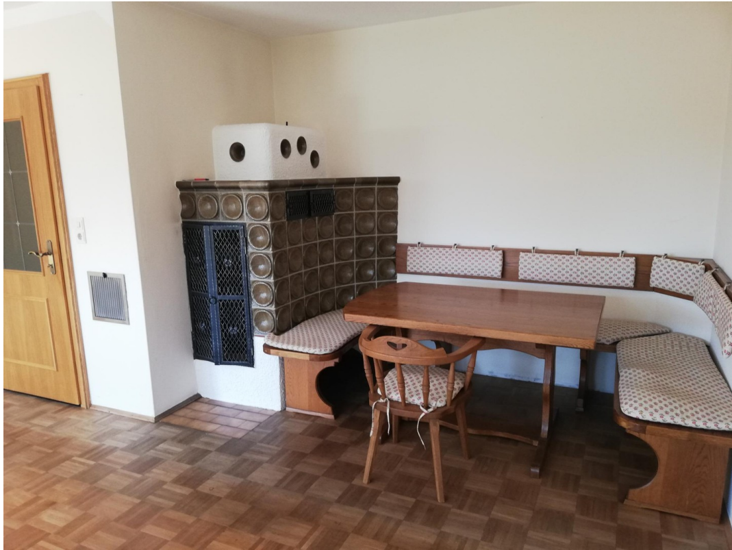
Kachelofen und Sitzecke