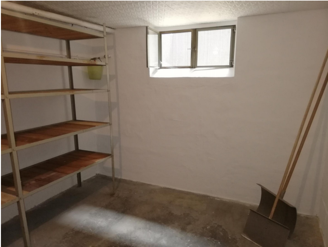
Keller mit Regal