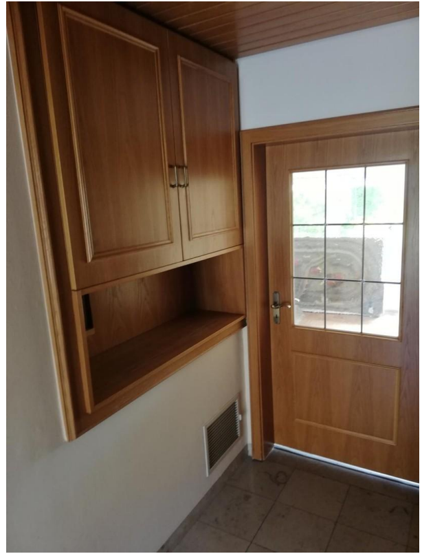
Flur mit Einbauschränk