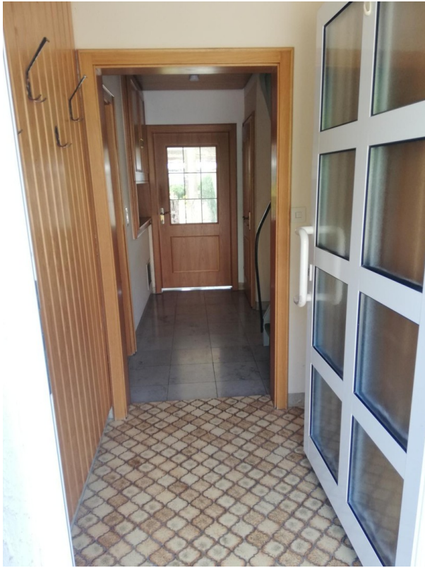
Eingangsbereich mit Haustüre