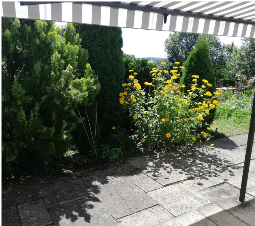
Terrasse mit Markise