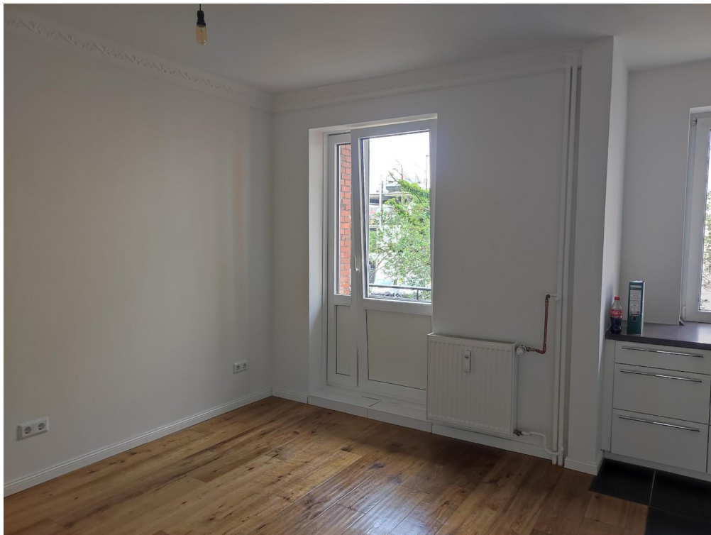
Essen / Wohnen